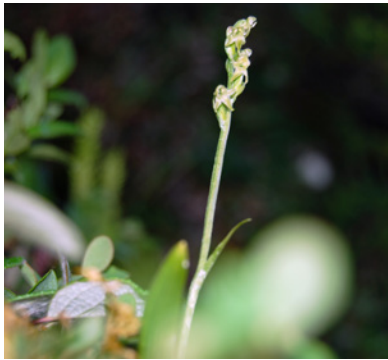
Lappfela (orkidé).