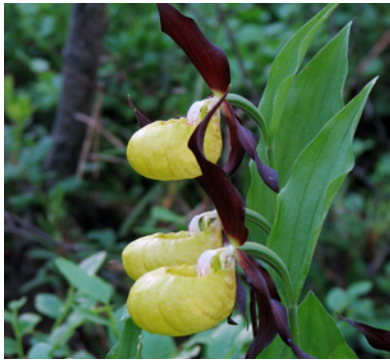
Guckusko (orkidé).