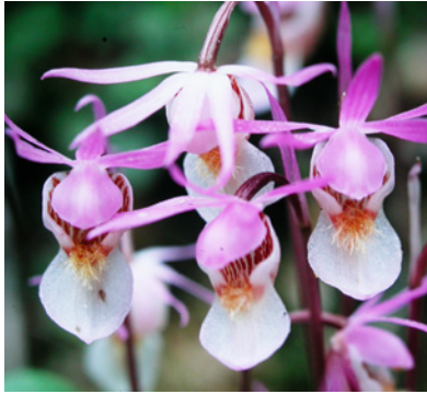
Norna (orkidé).