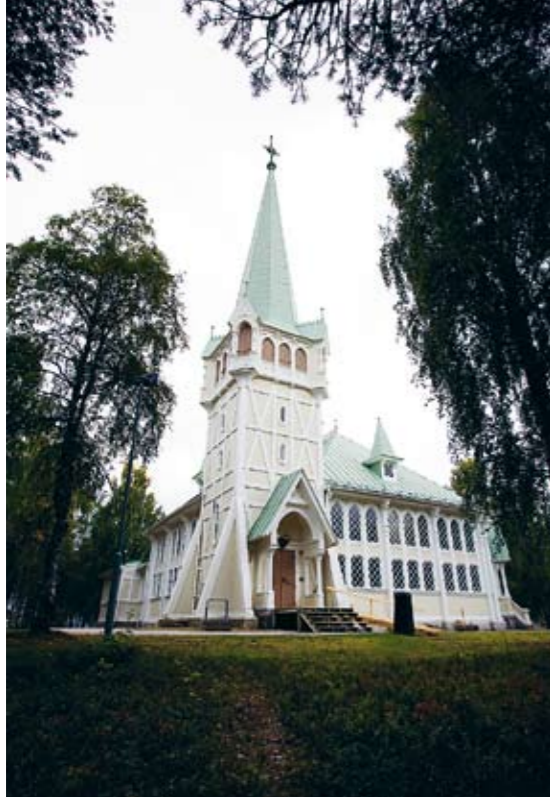
År 1889 invigdes Jokkmokks tredje kyrka. Den andra finns kvar i restaurerad form och kallas Gamla kyrkan eller Lappkyrkan. Älvdalens första kyrka, i Gammelstad Luleå, byggdes på 1300-talet. Stenkyrkan på bilden är från 1400-talet.