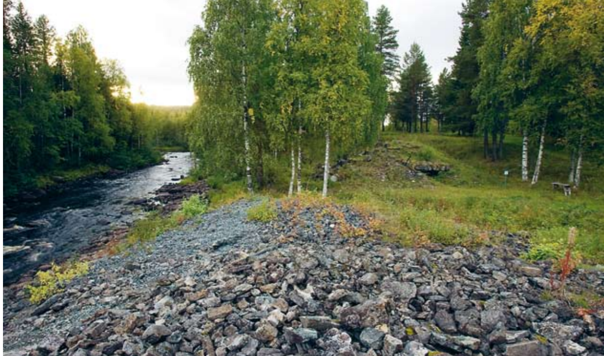
Resterna av Avafors masugn ligger längs stranden av Vitån. Närmast i bild syns slagghögen och lite längre bort ruinen efter masugnen. Avafors masugn drevs 1827–1887.