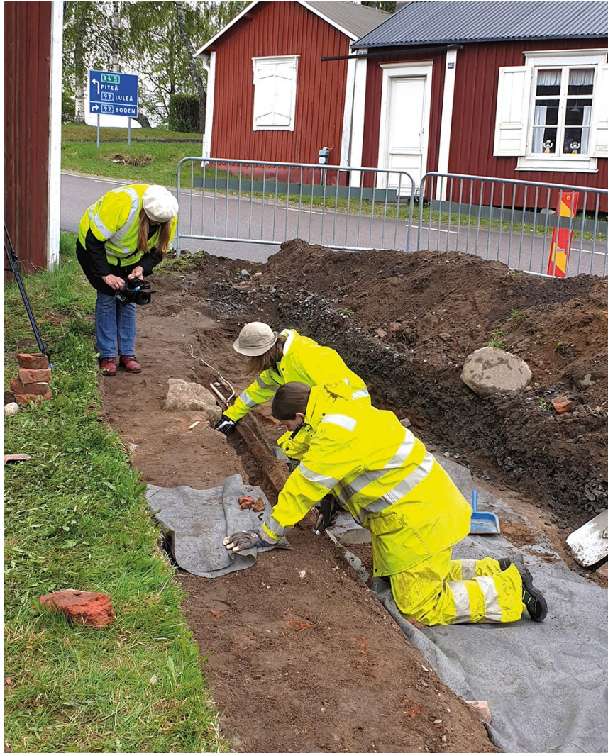
Norrbottnens museums arkeologer gör en undersökning. Här är det små murslevar och borstar som används när man närmar sig kulturlagret.