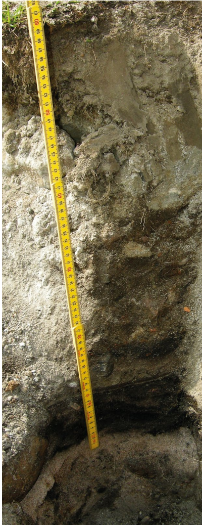
Stolphål från brunnstängen (killvindan) söder om kyrkan. De syns som mörkare lodräta färgningar genom kulturlagren. Utifrån dem vet man grovleken på stolparna som en gång stod på platsen, ca 40 cm.