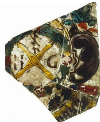
En bit målat fönsterglas, en bruklig minnesgåva i köpmanskretsar vid bröllop och jubileer. Rundeln med initialerna "HG" kan ha varit ett yrkesemblem eller bomärke. Funnet vid Sandåkersvägen.

man använde till vardags. Kritpiporna för tobaksrökning tillverkades av lera, som lätt gick sönder. Därför finns det gott om små fragment av kritpipor i kulturlagret. Dekoren och formen gör det möjligt att datera dem. Vid Sandåkersvägen har man funnit spår efter en odlingslott, troligen en kålgård. Odlingsytan tecknade sig som mörka ränder i jorden, under markytan, ränderna är troligen spår efter att jorden bearbetats med spade.