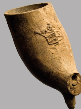
Huvud av svensk kritpipa med krona, från 1700-talets slut. Funnet under utgrävning vid Kyrkstugevägen.

Med historiska källor menas bevarade bilder och skriftliga dokument. Det kan vara brev, protokoll, kyrkböcker, boupteckningar, skisser, konstverk, kartor, böcker m.m.