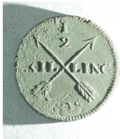
½ skillings kopparmynt från 1805, funnet under Gästgivarvägen.

Vi vet inte säkert när en permanent bebyggelse uppfördes på platsen. Men genom historieskrivaren Johannes Bureus skildringar från år 1600 vet vi att redan under 1500-talet fanns en bebyggelse av kyrkstugor kring stenkyrkan i Gammelstad som stod färdig omkring år 1500.