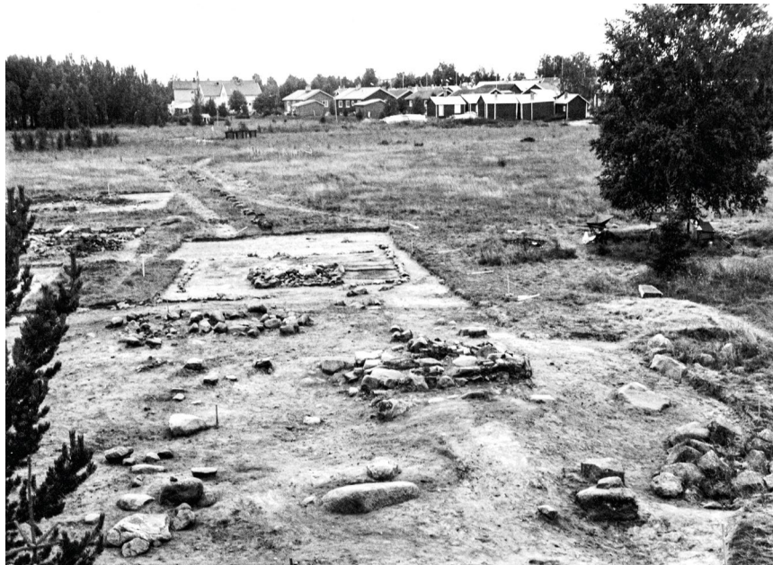
Prästgårdens husgrunder och spismursfundament blottlagda vid den arkeologiska undersökningen 1968-69.

Det finns idag få fynd som kan berätta om livet i Gammelstad före 1500-talet. De flesta kommer från den medeltida prästgården där friluftsmuseet Hägnan nu ligger. I gräset mellan husen syns ännu spisirösen och husgrunder från prästgården. Vid ett dike mellan Gamla Hamngatan och Hägnan har man funnit rester av en bro som var byggd vid samma tid som kyrkan. Det som nu är ett dike var då en bäck. I anslutning till prästgårdsgrunderna har man också hittat stengodskeramik, tillverkad i Rhenlandet under 1300- och 1400-talen.