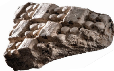
Skärva från kärl av stengods, tillverkad på 1300- eller 1400-talet i Rhenlandet. Funnen vid utgrävningen av grunden till en prästgård i nuvarande Hägnanområdet.

Dessa fynd kan vi se som en bekräftelse på att Nederluleå församling tillhörde Uppsala stift. De visar också att här i norr fanns långväga handelskontakter redan under medeltiden.