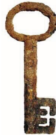
Nyckel, påträffad vid utgrävningar i kyrkan 1969-70.

På flera platser i området har man hittat slagg som tolkats som smidesslagg från tillverkning och repa-