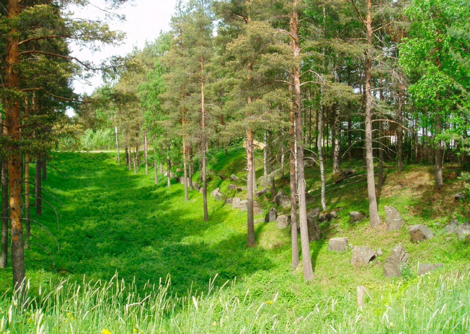
De torra kanaldikena vid Heden.