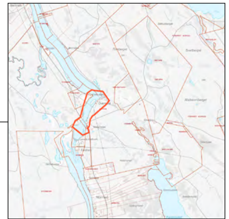
Edefors (norra området)