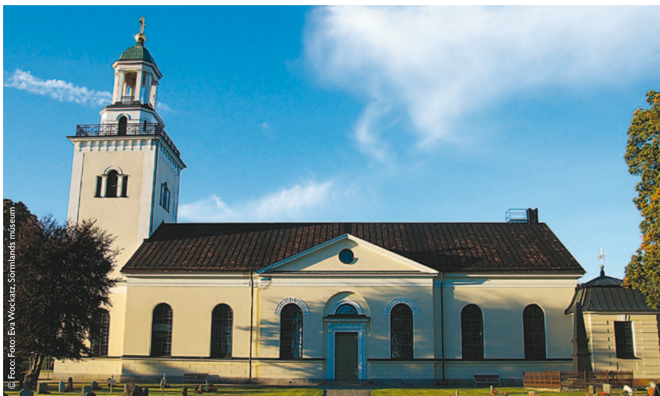
Öja kyrka, Eskilstuna kommun.