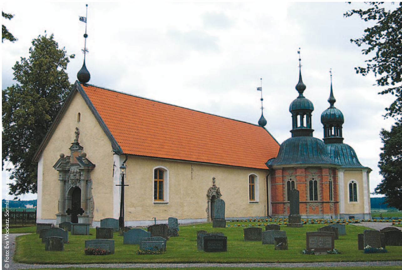
Vadsbro kyrka, Flens kommun

Länets kyrkor speglar olika historiska epoker under en nästan tusenårig obruten användning. Kyrkorna och socknarna har även haft en stor betydelse för landets geografiska indelning. De äldre kyrkomiljöerna omfattar i många fall vår äldsta och i allmänhet bäst bevarade bebyggelse. Dessa miljöer har ett så högt kulturhistoriskt värde att det är allas vårt gemensamma ansvar att de bevaras för framtiden. Ändringar som påverkar de kulturhistoriska värdena i skyddade kyrkomiljöer kräver tillstånd från Länsstyrelsen.