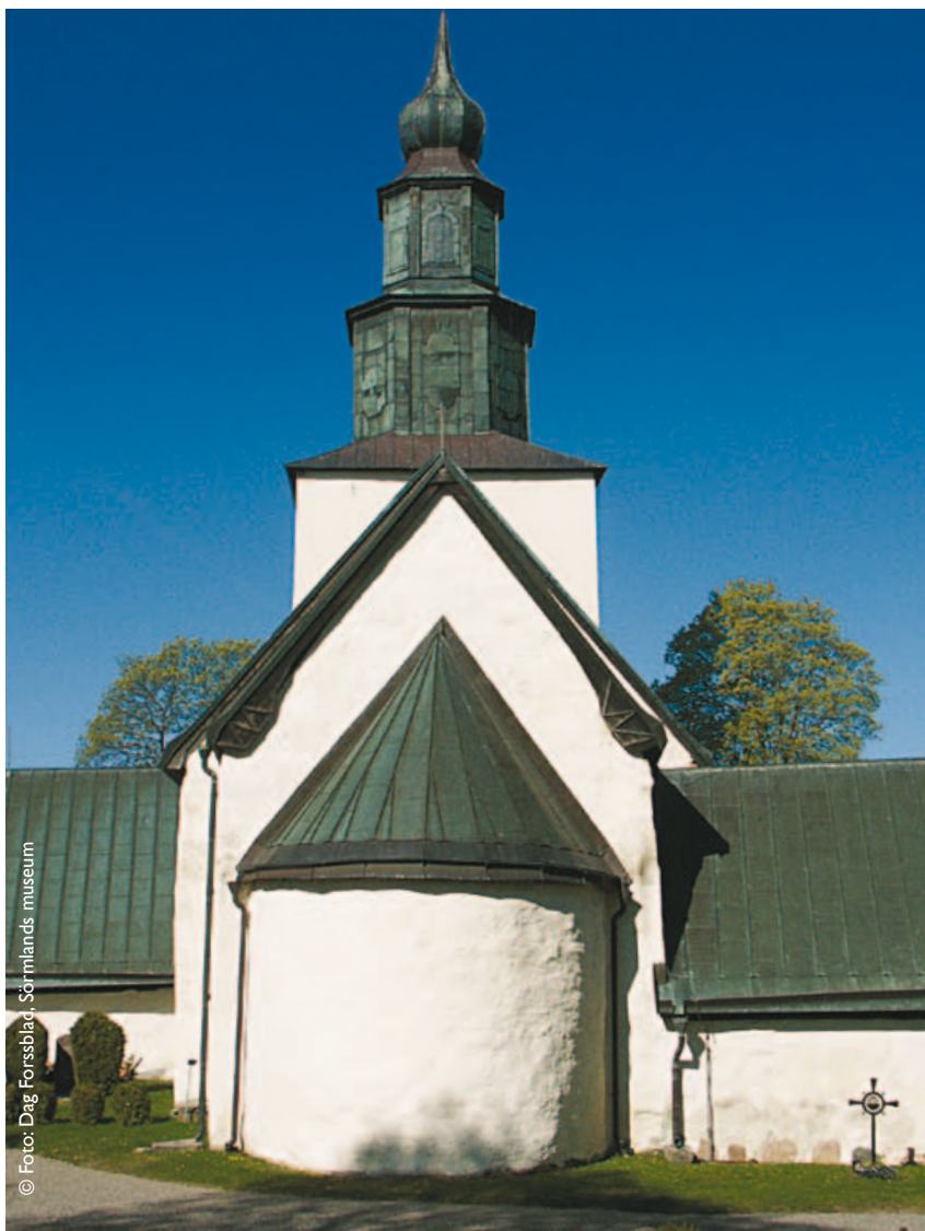
Tumbo kyrka, Eskilstuna kommun.

Innan beslut om kyrkoantikvarisk ersättning kan ges, ska tillståndspliktiga åtgärder först vara prövade och beslutade av Länsstyrelsen. Därför är det lämpligt att först söka tillstånd hos Länsstyrelsen och därefter ansöka hos stiftet om kyrkoantikvarisk ersättning.