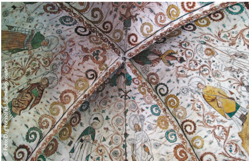
Överselö kyrka, Strängnäs kommun.

Tillsyn av inventarierna ska regelbundet göras av Strängnäs stift och Länsstyrelsen. Denna del av vårdplanen bör utföras av konservatorer med specialistkompetens inom respektive materialområde. Vårdåtgärder bör även utföras av konservator med särskild materialkunskap. För reparationer och konservering krävs tillstånd enligt kulturminneslagen.