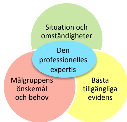
Figur 1. De fyra kunskapskällorna enligt en evidensbaserad praktik

En första kunskapskälla handlar om att få insikt om den situation och de omständigheter som den praktiska verksamheten råder under. En annan viktig kunskapskälla är bästa tillgängliga evidens inom området. Det är viktigt att komma ihåg att evidens handlar om det sammanvägda och bästa tillgängliga faktaunderlaget för en viss fråga. En tredje källa till kunskap är målgruppen. För att kunna utveckla föräldrastödet på ett sådant sätt att det attraherar föräldrar med olika bakgrund och livsvillkor måste vi ha kunskap om målgruppens önskemål och behov. Att alla föräldrar erbjuds samma möjlighet till stöd innebär inte med automatik att alla föräldrar har samma möjlighet att ta del av det stöd som erbjuds. Om stödet bara attraherar en viss grupp föräldrar finns en risk att ojämlikheten i hälsa ökar. I litteraturen kring implementering framhålls vikten av att kunna anpassa en insats både utifrån lokala förutsättningar och utifrån insatsens målgrupp. 9 Den fjärde och sista kunskapskällan handlar om hur den professionelle väger samman kunskapen från de övriga kunskapskällorna med sin yrkeskunskap och sin personliga kompetens.