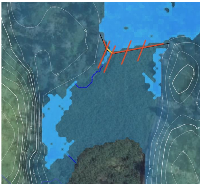
Figur 3: Dämme av altimmer med tvärsgående stockar som fungerar som strävor och reglerar vattenflödet genom ett v-format utlopp (gult). Stockarna som ligger nedtryckta i torv är av al som återfinns lokalt. Al har historiskt använts för konstruktioner i vatten eftersom träslaget är rötbeständigt i den miljön.

Det är dock angeläget att åtgärden är försiktig och reversibel om det visar sig att den tänkta funktionen uteblir. Att skapa en vall med hjälp av grävmaskin är därför åtminstone initialt inte önskvärt. Med tanke på att tröskeln inte böver vara så hög föreslås en lösning där ett dämme konstrueras av lokalt altimmer som sjunker ner i torven på grund av sin vikt, och som förankras i marken med hjälp av dymlingar.