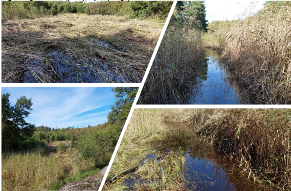
Figur 1: Översiktsbilder till vänster och vattnets väg till havet till höger.

Länsstyrelsen i Södermanlands län | 010-2234000 | Sodermanland@lansstyrelsen.se Egentliga Östersjön | Nyköping | HARO/Havsområdesnummer