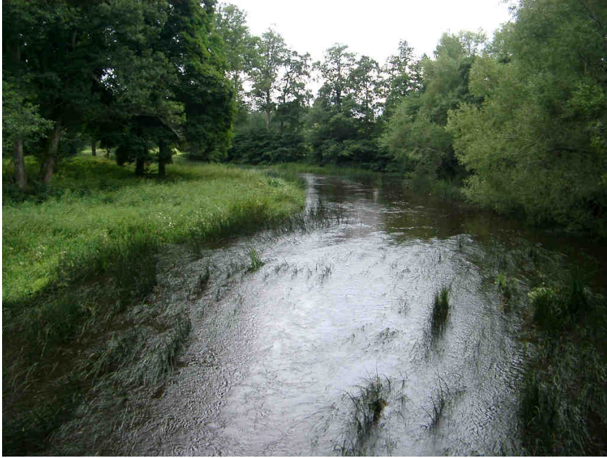
Figur 3. Tämnrån vid Västland. Här påträffades spetsig målarmussla och flat dammussla.