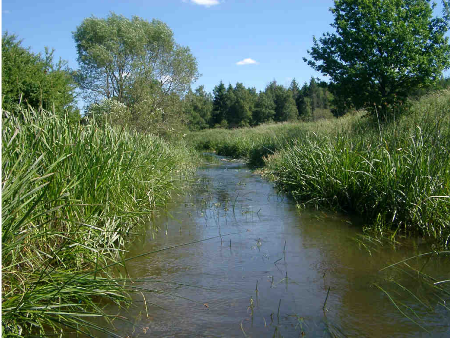
Figur 4. Sävjaån. Bilden visar lokalen vid Spångtorp. Här påträffades spetsig målarmussla, vandrarmussla och allmän dammussla

6639704 1614500 Spetsig målarmussla, vandrarmussla och allmän dammussla 50 m Medel Beläget på strömsträckan vid Spångtorp. Strömmande vatten över ler-, sand- och grusbotten. Beväxt med säv. Se Figur 4. 17 exemplar av spetsig målarmussla samt ett 30-tal vandrarmusslor. Tre skal och tre levande allmänna dammusslor.