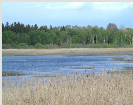
Sjön testen, en typisk Uppländsk sjö med sänkningsskador.

Ett exempel på en sådan sjö är Testen, i Olandsåns avrinningsområde. I slutet på 1800-talet sänktes vattennivån i sjön med drygt två meter och idag har den stora problem med igenväxning och brist på syre vintertid.