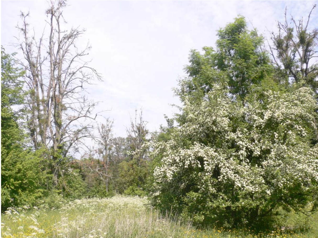
Starkt mistelangripen lind vid Ådö slott. Naturresevatet Ådö-Lagnö.

flera exemplar av den sällsynta arten varierad brunbagge Ospyha bipunctata (VU). (Arten är enligt rödlistan från 2005 ej påträffad i Uppsala län, men hittades i flera exemplar på Stora Lindholmen av mig själv, Bengt Ehnström och Tommy Lennartsson år 2003). Här hittades även avlång flatbagge Grynocharis oblonga , tidigare klassad som sårbar men nu avförd från rödlistan. Ytterligare en lokal för linddyna påträffades mellan Kvarnberget och slottet. Även i detta fall vid nyligen nedsågade lindar!