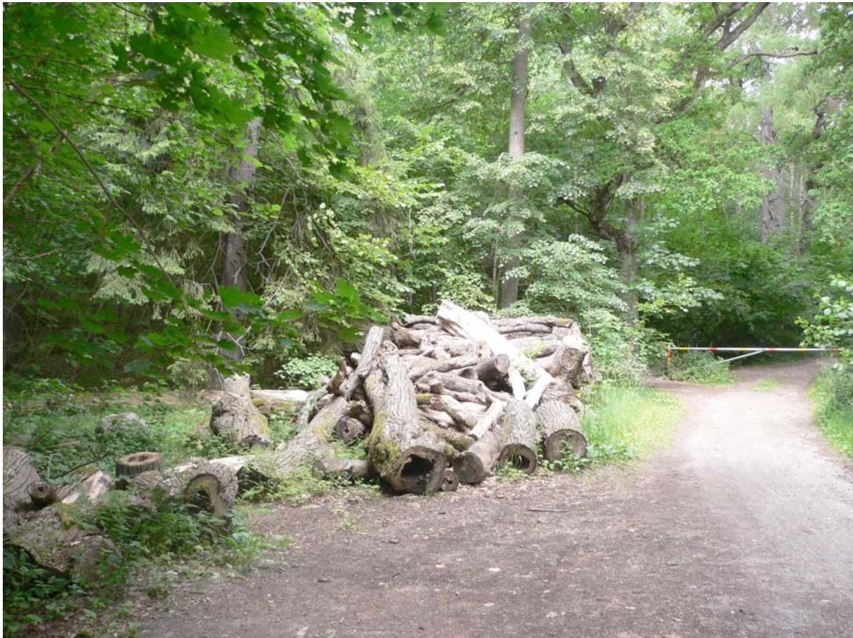
Ihåliga lindar med linddyna som nyligen avverkats i Korpbergets naturreservatet.