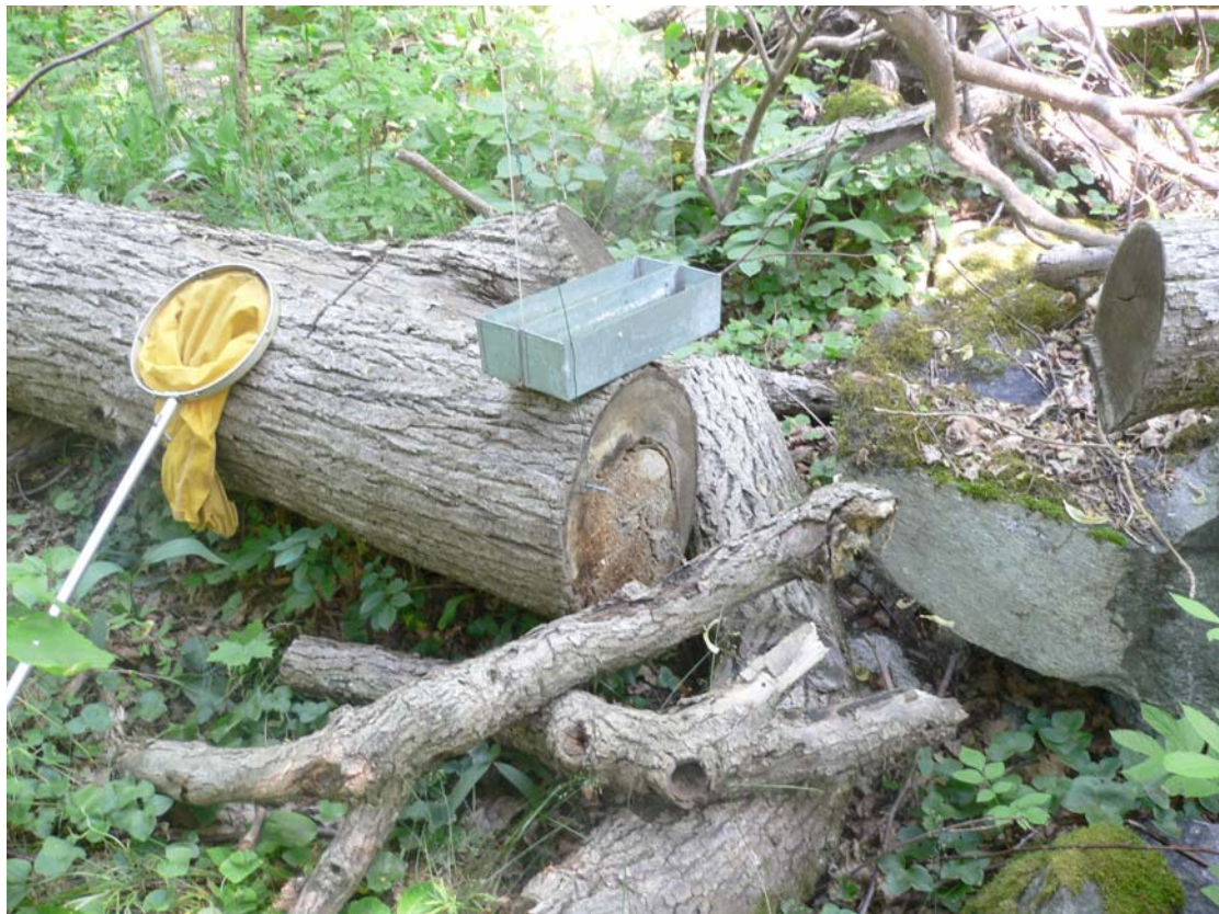
Lind som huggits av vedhuggare. På trädet fanns linddyna. Naturreservatet Ädö-Lagnö.

Sammanlagt insamlades 696 cm lindgrenar. I ett par grenar hittades spår av den eftersökta arten lindgrennagare Pseudoptilinus fissicollis (VU).