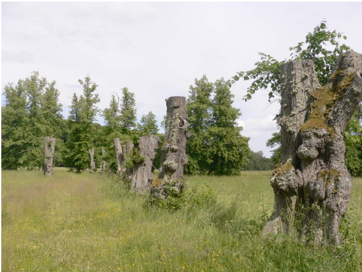
Några av den sista gamla lindarna vid Drottningholms slott. Lokal för Synchita separanda och Laemophloeus monilis .

Lokalen besöktes 26 juni. En stor del av parken kring slottet genomströvades under en varm solig dag. Väster om slottet vid punkt X 6579809- Y1617734 står en kort allé med 13 gamla lindar. Träden är hårt hamlade och mer eller mindre döende, möjligen som en effekt av allt för hård hamling. På fyra stammar växer linddyna. Här sågs flyghål med en speciell karaktär som gjorde mig nyfiken och som visade sig härröra från Synchita separanda . I övrigt hittades enstaka hållindar men bara en enda död gren på hela anläggningen!