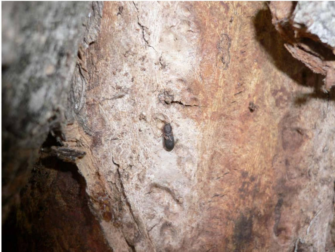
Synchita separanda på några av de sista gamla lindarna vid Drottningholms slott.