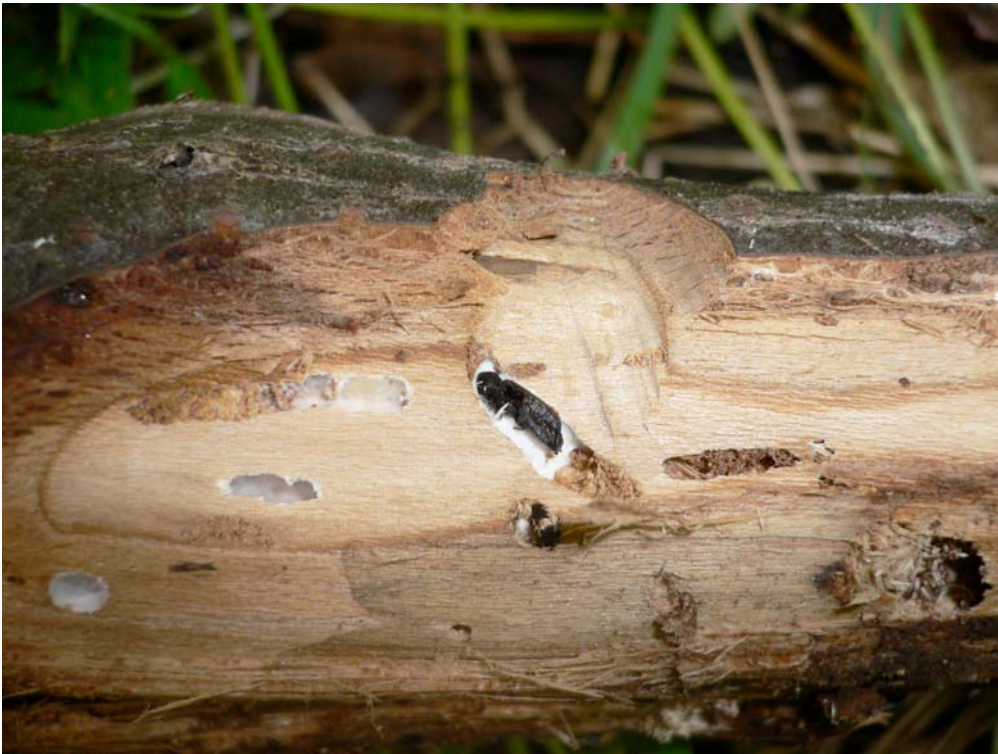
Angrepp och ett dött exemplar av lindgrengnagare Pseudoptilinus fissicollis . Naturreservatet Eldgarnsö.

Sammanlagt insamlades 499 cm lindgrenar. I ett par grenar hittades spår av den eftersökta arten lindgrengnagare Pseudoptilinus fissicollis (VU) samt lindfläckbock Chlorophorus herbsti (VU).