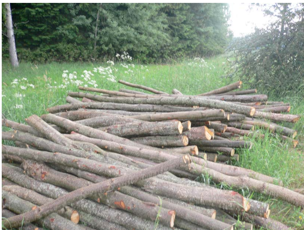
Förnyringen av lind på Eldgarnsö måste säkerställas. Här ung lind som avverkats ön.