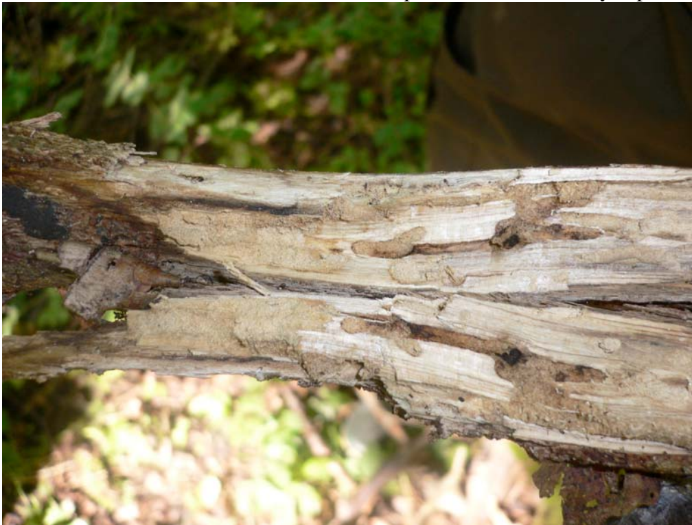
Angrepp av lindfläckbock Chlorophorus herbsti . Naturreservatet Eldgarnsö.

Vid besöket den 22 juni hittades angrepp av lindfläckbock Chlorophorus herbsti (VU) i mistelangripna lindgrenar samt lindgrengnagare Pseudoptilinus fissicollis (VU). Ett dött exemplar hittades även av sistnämnda art. På samma lokal påträffades även linddyna på tre lindar.