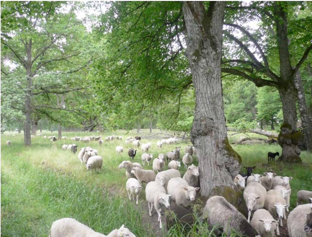
Vackra hagmarker med lind vid Tullgarns slott.

Ytterligare en lokal besöktes, Sörängen, som är en större dunge sydväst om slottet. Den består av sluten ek-hasselskog med inslag av grov lind, bland annat en låga. Relativt rikligt med lindgrenar på marken. Många gammelekar är här döende på grund av beskuggning.