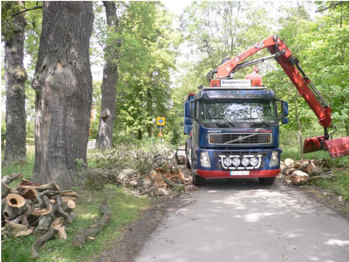
Delar av en nedblåst ek med angrepp av skeppsvärfluga (NT) har sågats upp och tas om hand av Djurgårdsförvaltningen för vidare transport till flisning. Ulriksdals slott.