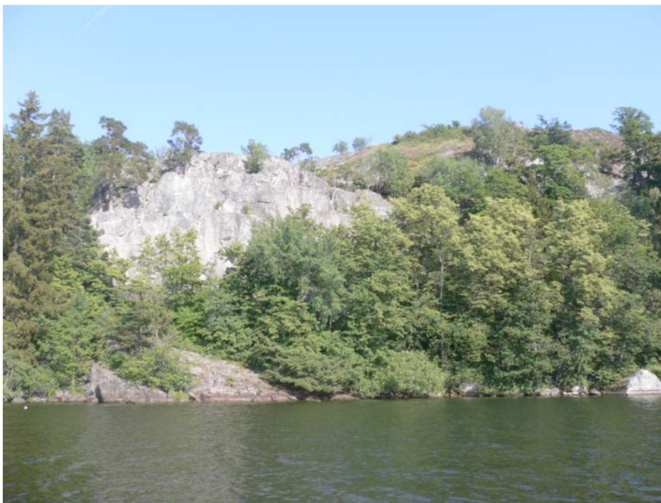
Gåseberg. En sannolikt intressant lindlokal nära Eldgarnsö.

Objektet har goda förutsättningar att hålla intressant lindfauna, i synnerhet med tanke på det geografiska läget.