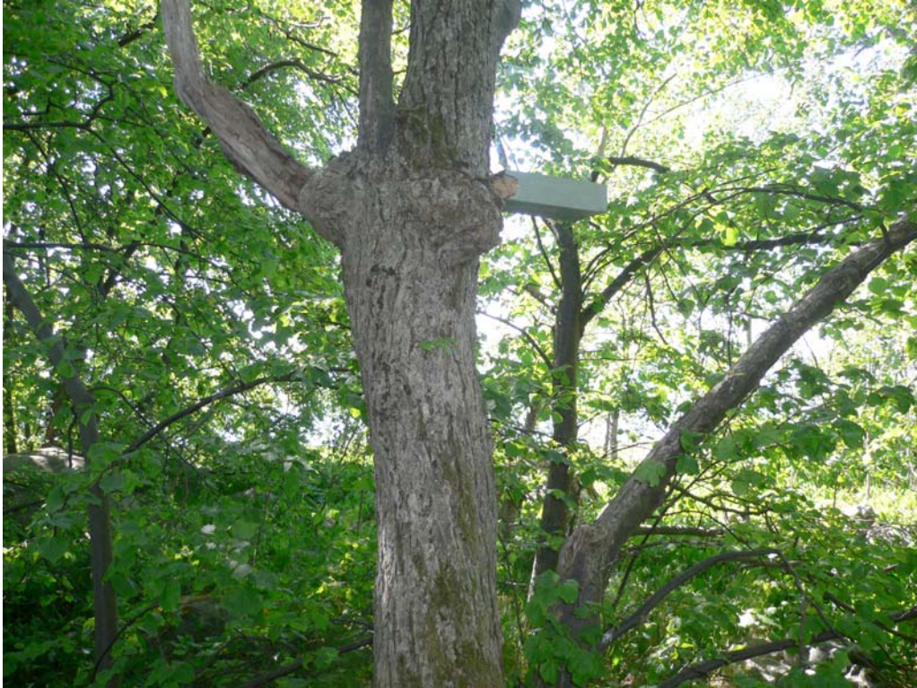
Fönsterfälla på lind med mistel. Lilla Lindholmen, Norra Björkfjärdens naturreservat.