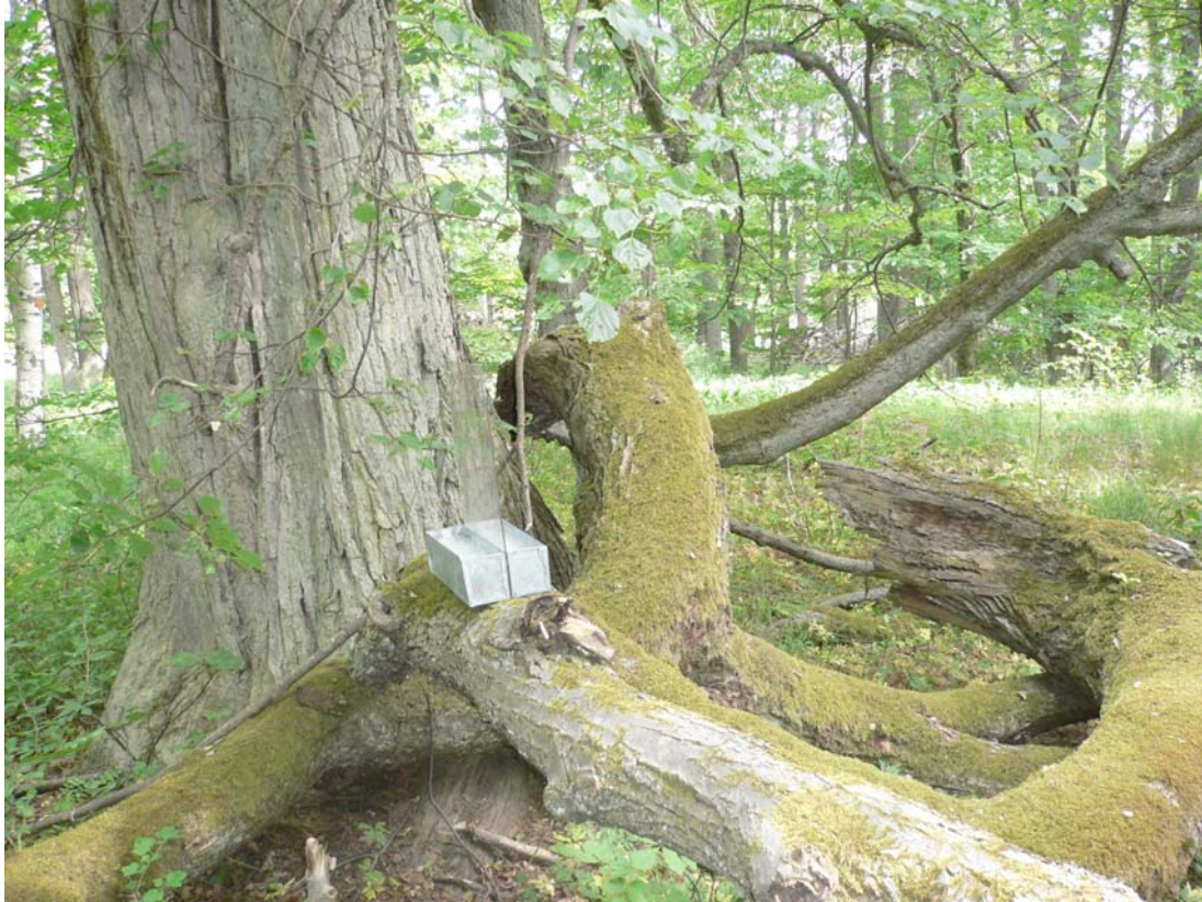
Fönsterfälla på lind. Frösvik Domänreservat.