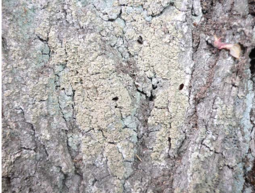
Flygål i lindbark från Synchita separanda och Laemophloeus monilis .