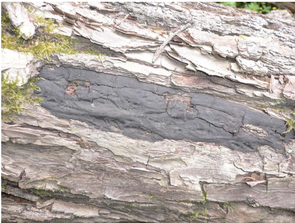
Fyra skalbaggsarter tycks vara helt knuten till svampen linddyna Biscogniauxia cinereolilacina . Svampen växer på grova döda eller döende lindstammar och grenar. Korpbergets naturreservat.

Svampen linddyna eftersöktes i samtliga objekt och påträffades på följande lokaler: Eldgarnsö, Lagnö, Hammarberget, Drottningholm slott samt Korpberget.