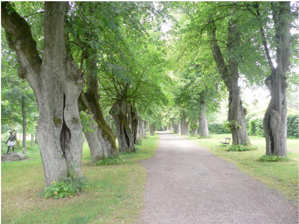
För att förbättra situationen för lindfaunan som omfattas av åtgärdsprogrammet krävs ett informationsarbete om parker och alléers naturvärde. Ulriksdals slott.

Generellt är bortstädningen av död ved mycket påtaglig i samtliga allér och parker som under- sökts. Flera allér har nyligen "friserat" och döda grenar sågats ner och sedan undantagslöst transporterats bort. För att förbättra situationen för lindfaunan som omfattas av åtgärdspro- grammet krävs ett informationsarbete om parker och alléers naturvärde så att medvetenheten ökar hos berörda parter som sköter sådana miljöer.