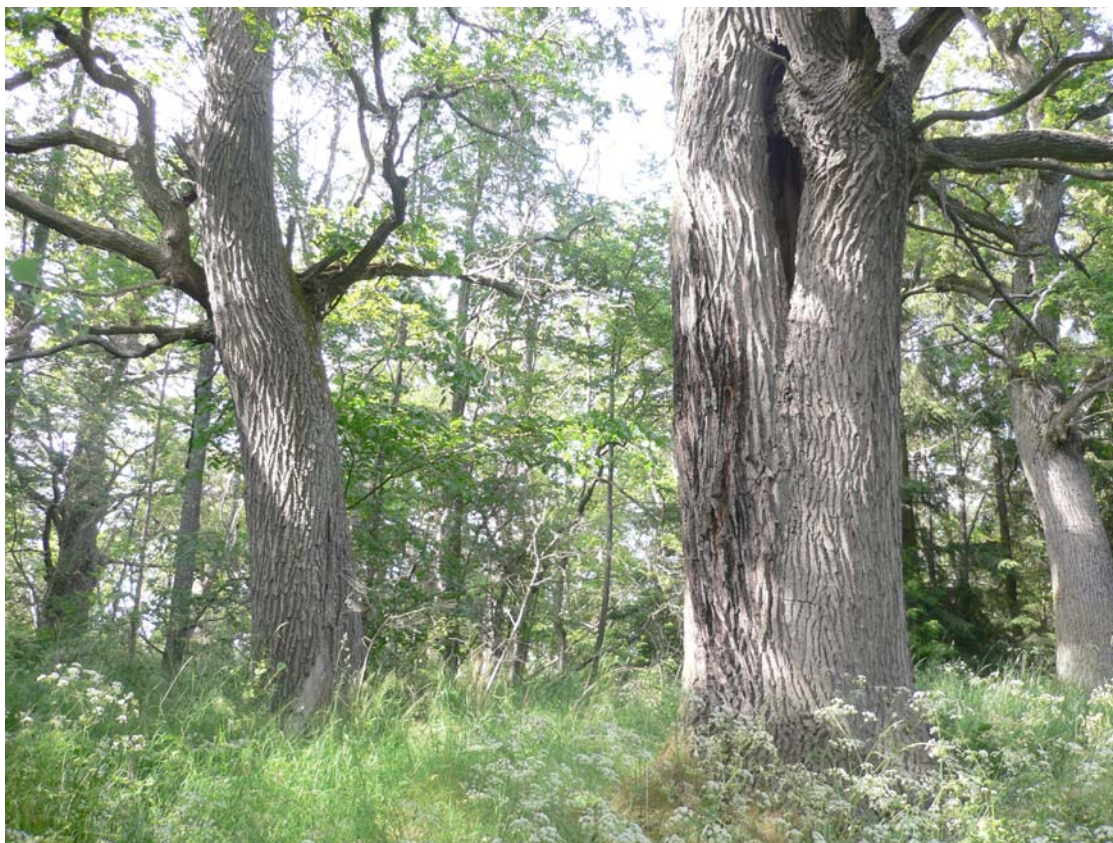
Åtgärder krävs för att bevara de mycket värdefulla ekhagarna på Elgarnsö.