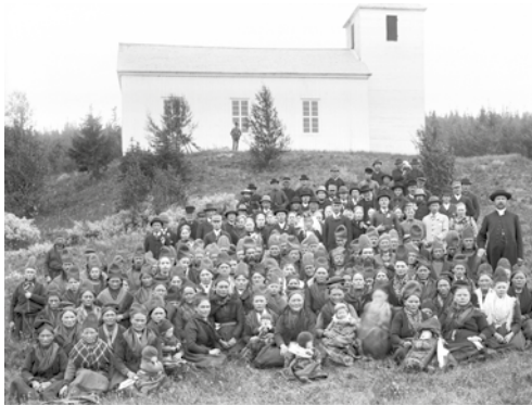
Vårhelg i Fatmomakke på 1890-talet.