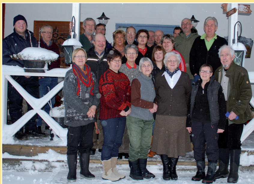
Representanter för nära hälften av alla kända aktörer samlade vid ett av flera möten.

Hur kan ett bra samverkansarbete organiseras? Finns metoder? I projektet Regionala landskapsstrategier och i Kult-projektet har en ny modell för samverkan tagits fram tillsammans med lokala aktörer verksamma i Kultsjödalen, Vilhelmina kommun, Västerbottens län.