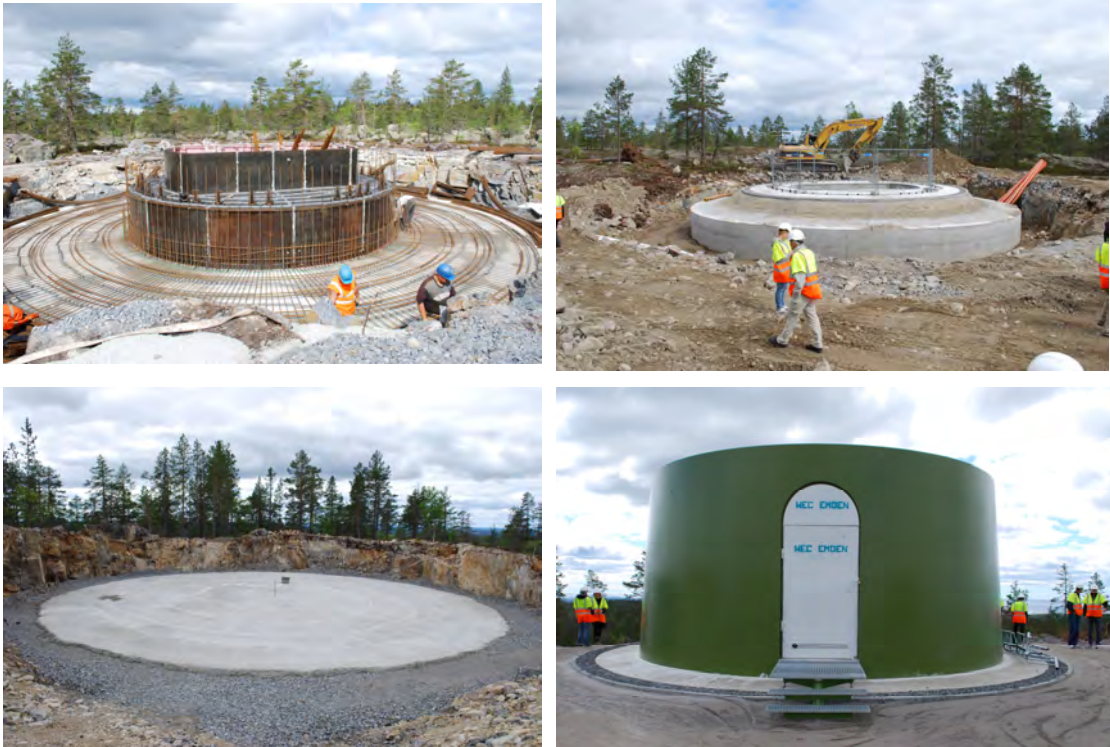
Fundament under uppbyggnad på Gabrielsberget, Nordmaling kommun. Förankringen av ett vindkraftverk är viktig av många olika skäl .