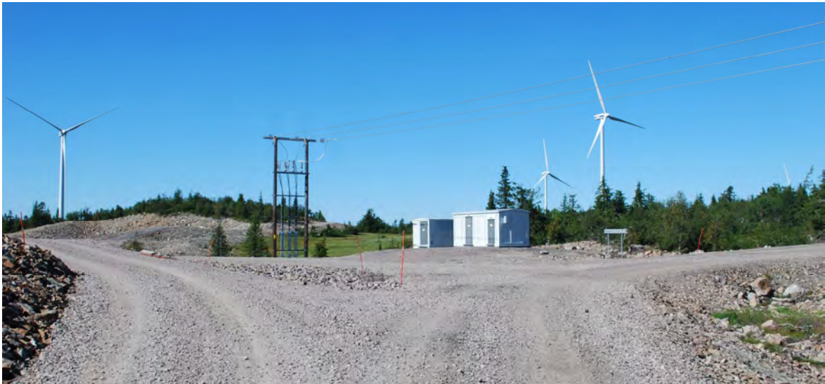
Delar av Bleikevare vindkraftspark, Dorotea kommun.

Innan en vindkraftsanläggning, oavsett storlek, kan etableras krävs ett omfattande och noggrant förarbete. Varje etablering föregås av ett planeringsarbete och en tillståndsprocess som berör en mängd aktörer som företräder skilda intressen till exempel verksamhetsutövare, myndigheter, markägare och en bred allmänhet. Komplicerade diskussioner, krav på kunskap och samarbete påvisar ett behov av väl genomtänkta insatser.