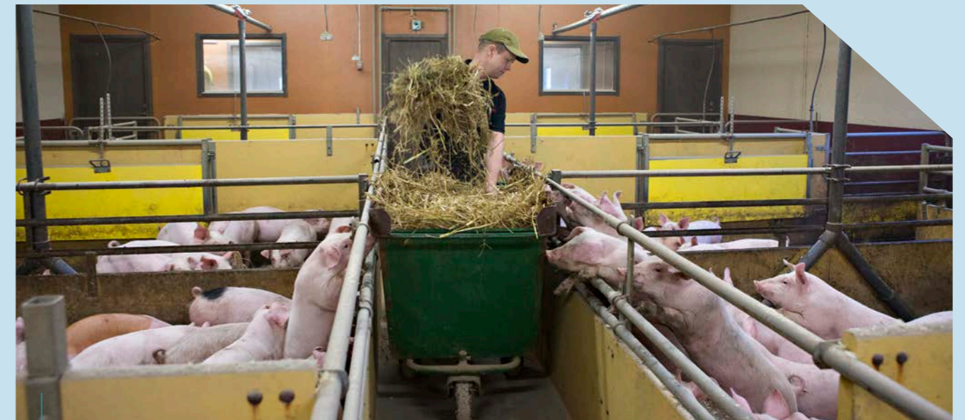
I Norrbotten har vi kvar fyra grisproducenter

Vid Sveriges anslutning till EU uppskattades vår självförsörjningsgrad till 80% men har sedan dess stadigt sjunkit till att man i dag talar om 50%. Norrbottens självförsörjningsgrad är ca 7% för grönsaker, 20% för kött och 66% för mjölk. Under framtagandet av Nära Mat var