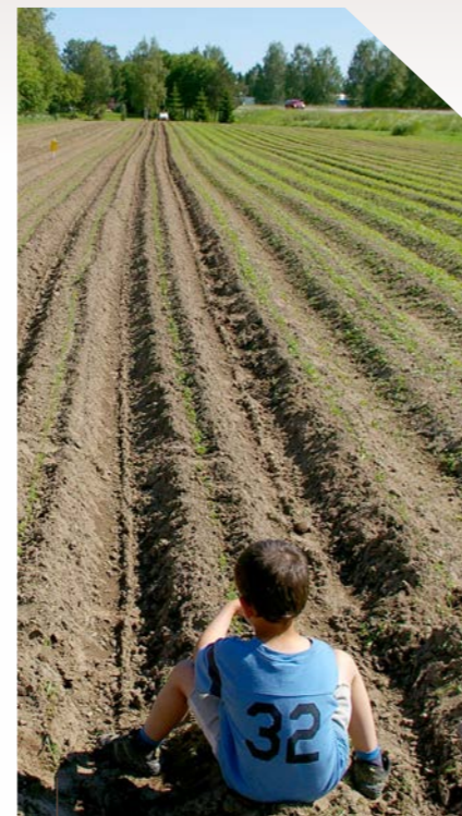
Var ska vi odla det vi ska äta?

Idag är det främst kommunerna som beslutar i frågor om exploatering. De lämnar bygglov och styr genom översikts- och detaljplaner hur markanvändning ska ske i den egna kommunen. Fram till 1983 skulle Länsstyrelsen godkänna kommunala planer, men så är det inte längre. År 2013 gjorde Jordbruksverket