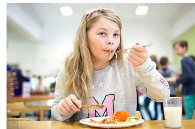
Om vi i fredstid har menyer som främjar regional producerad mat stärker vi samtidigt den civila beredskapen