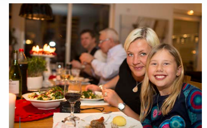
Mat är kittet när vi umgås – gärna nära mat!