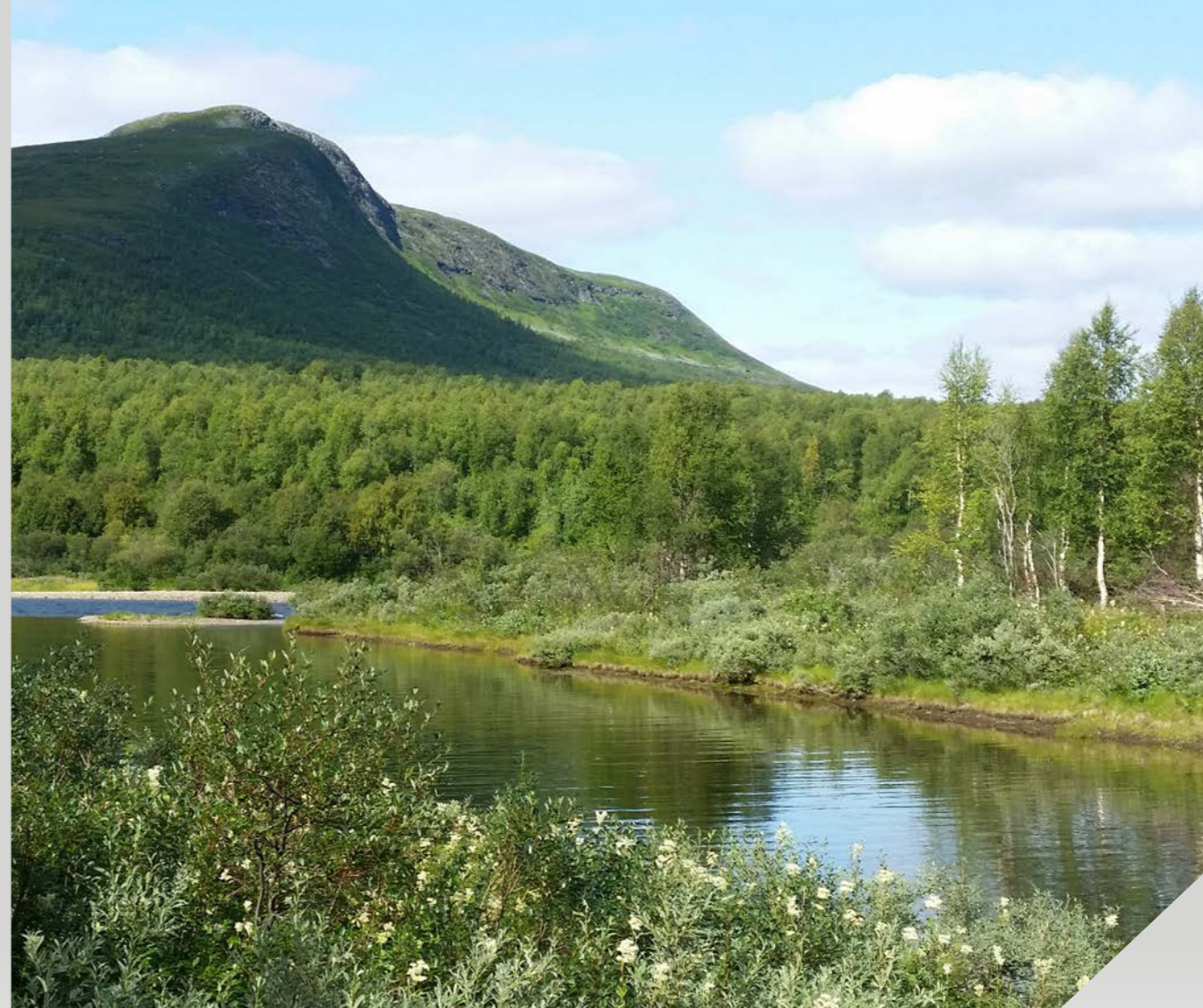
Vad är farligt i Sveriges natur? Foto: Margareta Holmgren

Text och foto: Eva Forssell, Länsstyrelsen i Västerbottens län