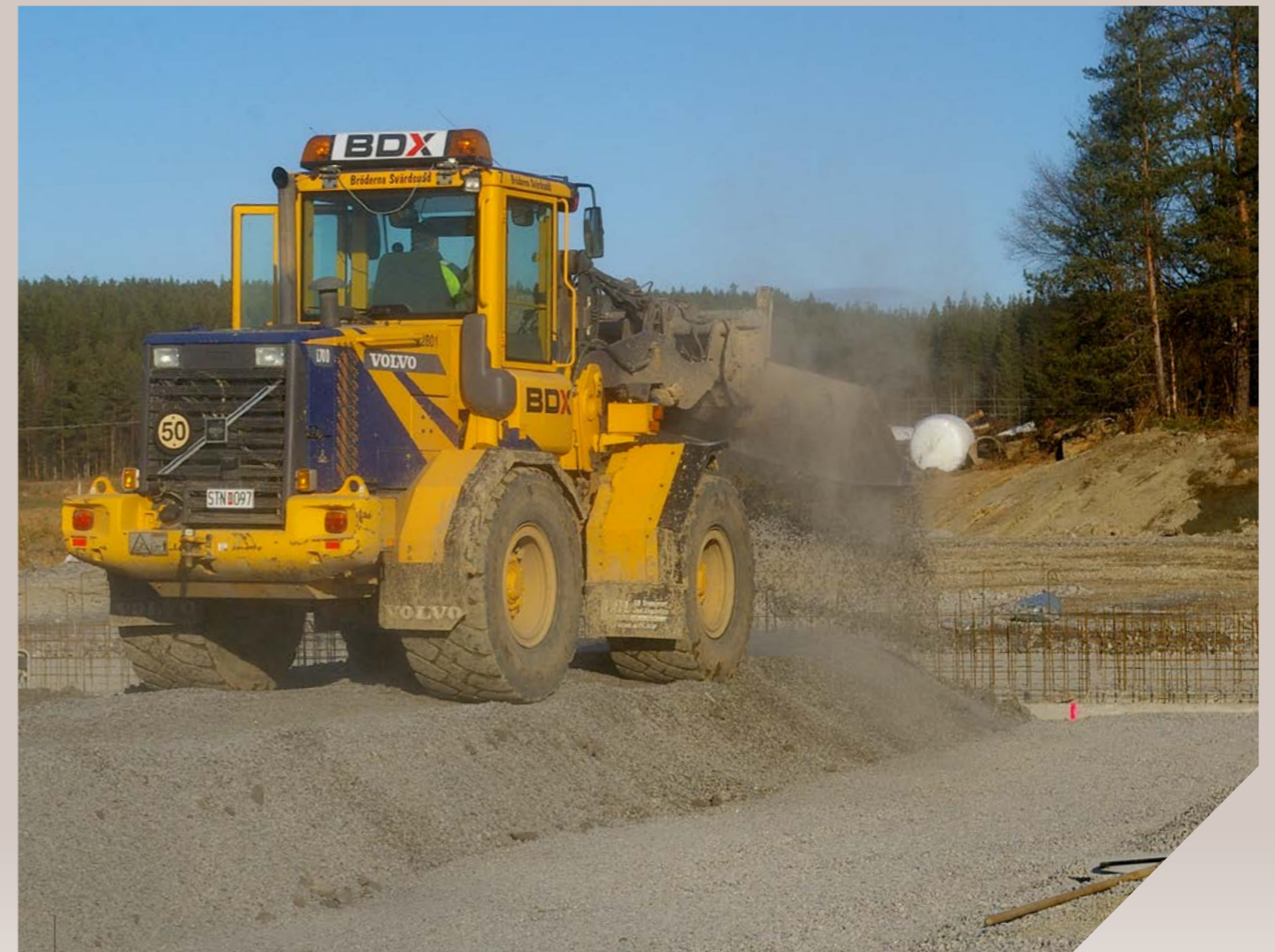
När jordbruksmark exploateras förstörs möjligheten att odla på den för all framtid.

en undersökning av hur kommunerna tillämpar hushållningsreglerna då det gäller jordbruksmark. Den visar tydligt att kommunerna i mycket stor utsträckning tillåter exploatering av jordbruksmark. Kommunerna hade en väldigt kortsiktig syn på markanvändningen. De har i stor utsträckning låtit efterfrågan på mark styra, trots att översiktsplanerna ofta anger att jordbruksmark ska värnas.