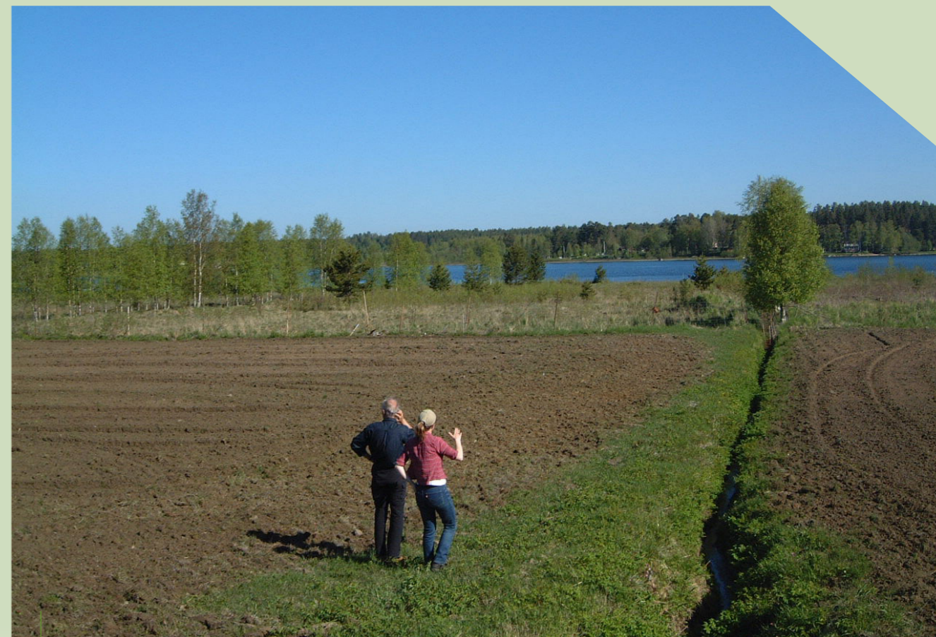
Om du ska överta en SAM-ansökan, kom ihåg att även anmäla djurhållning!

Om du har någon som hjälper dig med din ansökan, till exempel en konsult eller en släkting, då behöver du ge den personen en fullmakt. Du bestämmer själv hur länge fullmakten ska gälla. Du kan ge personen fullmakt genom Mina sidor på Jordbruksverkets webbplats eller med blanketten Fullmakt - E-tjänster som du hittar på Jordbruksverkets webbplats. Allra snabbast går det om du får eller ger fullmakten via Mina sidor . Fullmakten gäller då direkt och vi skickar inte ut något bekräftelsebrev.