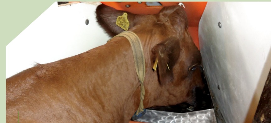
Ko i Greenfeed som används för att mäta metan.

Utnyttjande av grovfoder och hur det ska kombineras med olika typer av kraftfoder är centralt i institutionens forskning. Resultat från den forskningen ligger till grund för foderstater som ger ett bättre foderutnyttjande. Under senare år har