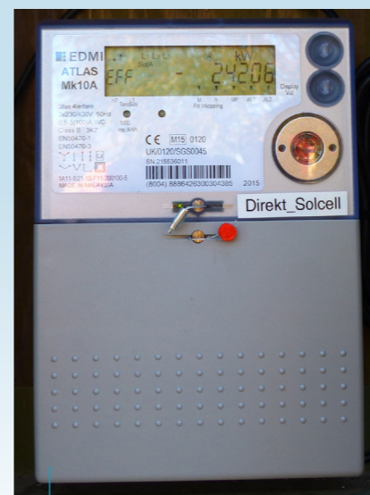
Här skickas ström till nätet!

Bland de mer ovanliga arrangemangen på gården finns "Opera i fårhuset", som i somras genomfördes för tredje året. När fåren är på sommarbete är deras hus ledigt för annat! Hälje gård är ett exempel på hur man utifrån jordbruksproduktionen utvecklat företaget till ett intressant besöksmål med många aktiviteter.