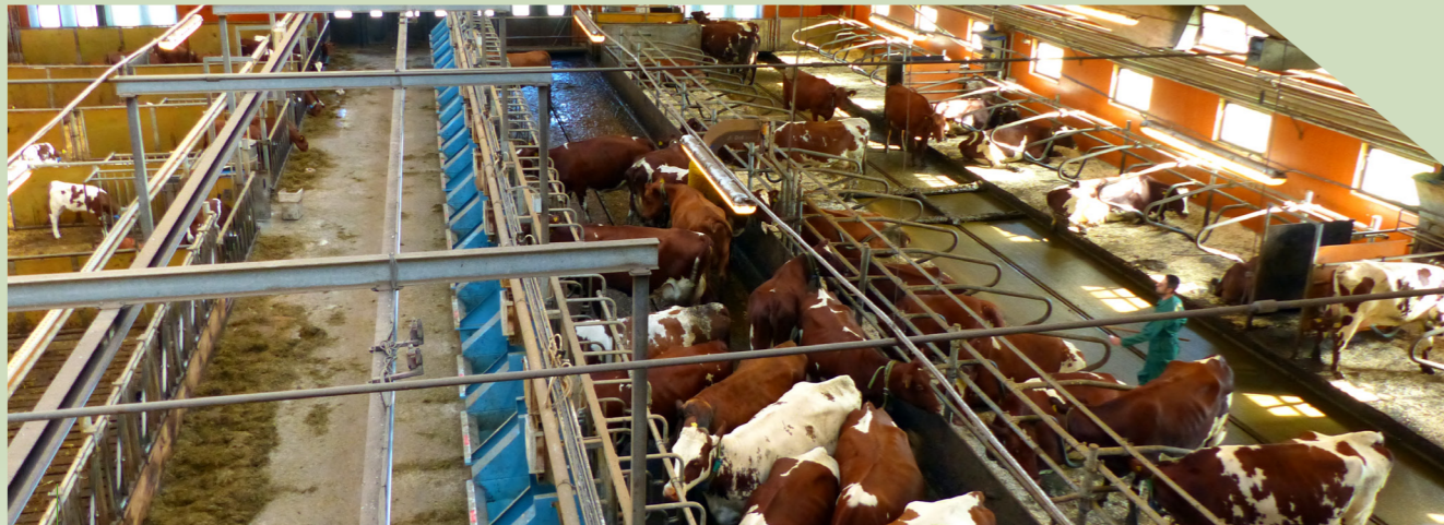
Forskningsladugården SLU Umeå. De blå foderkrubborna i den varma avdelningen möjliggör individuell kontroll på utfodringen av grovfoder för samtliga kor.

Text: Lars Ericson, Länsstyrelsen i Västerbotten