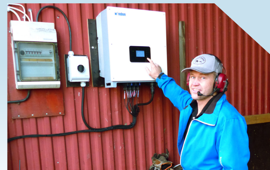
Nöjd solenergiproducent konstaterar att dagens produktion kommit igång.