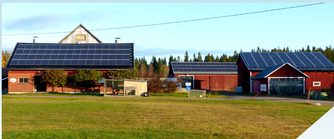
Solcellerna är placerade på tre av gårdens ekonomibyggnader. Samtliga tak vätter åt söder.