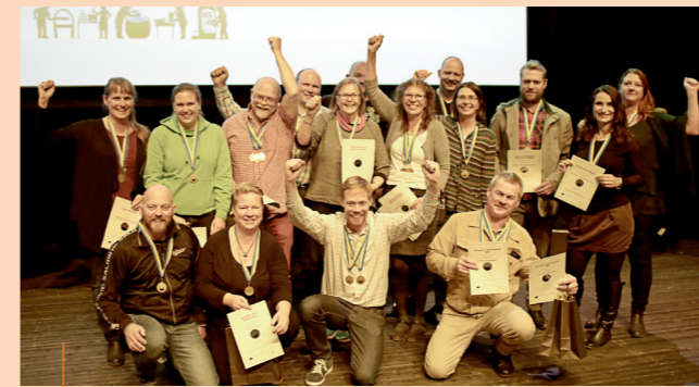
Glada vinnare vid SM i mathantverk 2016.

När det gäller antal medaljer så blev Västerbotten i år vinnare med 18 medaljer. Av dessa var 8 guld. Norums Fiskrökeri och Vilhelmina Gårdsbutik fick vardera 2 guld var och Vilhelmina Gårdsbutik tog också hem ett silver. En annan guldmedaljör var Edgården i Flarken som fick mycket starkt omdöme om sin leverpastej, som ansågs uppnå internationell klass. Övriga guldmedaljörer var Kulturbageriet, Svedjan Ost och Vilhelmina Gårdsbutik. Vilhelmina Gårdsbutik tog också hem ett silver. En annan guldmedaljör var Edgården i Flarken som fick mycket starkt omdöme om sin leverpastej, som ansågs uppnå internationell klass. Övriga guldmedaljörer var Kulturbageriet, Svedjan Ost och Vilhelmina Gårdsbutik.