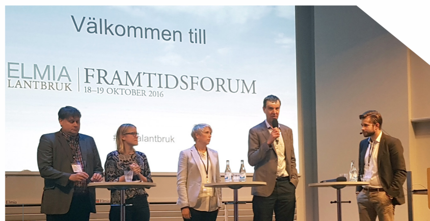
Paneldiskussion om den svenska livsmedelsstrategin, Elmia Lantbruk Framtidsforum 2016

Frustrationen hos alla som väntar på såväl strategin, som på de handlingsplaner som sedan ska följa på denna, är hög. Samtliga deltagare i paneldebatten kring den nationella livsmedelsstrategin var dock övertygade om att vi har en färdig och beslutad strategi före julafton. Det återstår att se om den kan visa vägen för en hållbar och lönsam livsmedelssektor eller om den likt skräddarens tyg bidde en tumme.