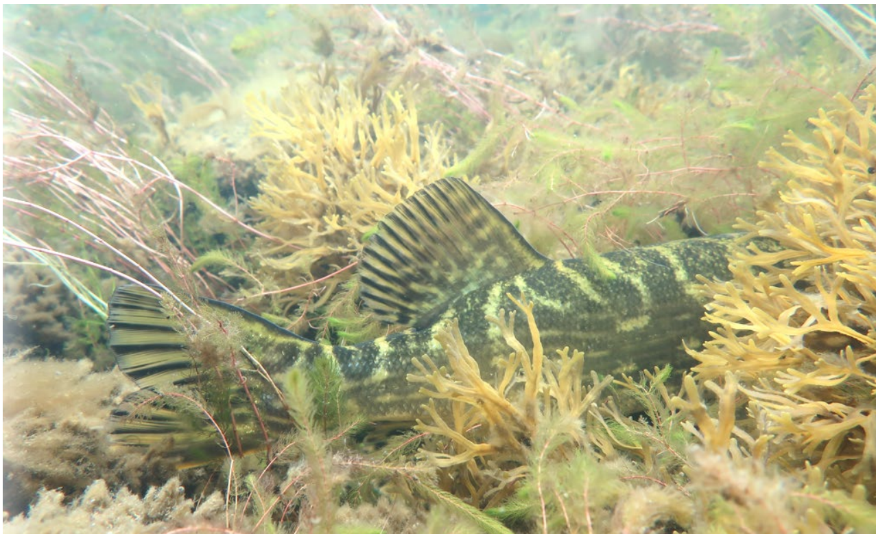
Bild: Fiskarter såsom gädda och abborre lever i havet och vandrar upp till kustnära sjöar och laguner för lek på våren.

Kust | Umeå kommun | Havsområdesnummer 25042