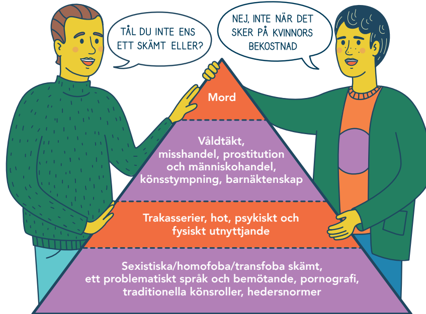
ILLUSTRATION: MATILDA HALL