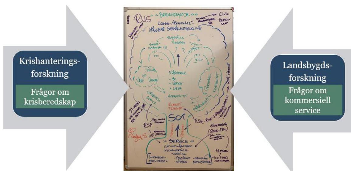
Figur 5, illustrerar de många inramningsmöjligheter som finns vad gäller SOT.

Som konstaterades inledningsvis i den här rapporten finns det en stark tendens inom forskning att krisforskare intresserar sig för frågor om olika påfrestande samhällsstörningar eller kriser och sällan anläggs ett explicit landsbygdsperspektiv. Forskare som skapar förståelse för villkoren i olika landsbygder och kartlägger spänningar mellan centrum – periferi gör det å andra sidan sällan med kriser eller krisberedskap i åtanke. Efter att följt arbetet med SOT, och talat med representanter från både den lokala och regionala nivån är det slående hur det något oklara förhållandet mellan dessa två perspektiv också är framträdande i såväl policydiskussioner som i det praktiska arbetet med SOT.