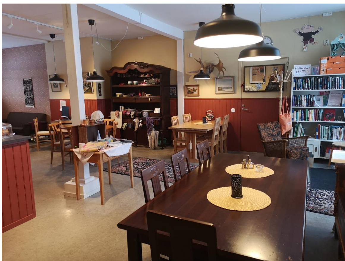
Bild 1 , En butik med tillhörande café kan utgöra ett socialt nav men också fungera som en given samlingsplats vid en större kris. Bilden är från Borgvattnet.

För en butiksägare som investerat i SOT-arbetet handlar det givetvis om en egen försäkran, att ha en container med ett reservkraftaggregat i anslutning till sin butik innebär en försäkran om att inte elen försvinner och butiken måste stängas ner och varor måste kastas. Utöver det tillkommer just det sociala ansvarstagandet, och som också manifesterades vid skogsbränderna. Följande citat kommer utifrån diskussionerna i Lillhärdal ” SOT är ju inte bara för min skull, utan det är ju för hela samhället ”. (Intervju, Lillhärdal)