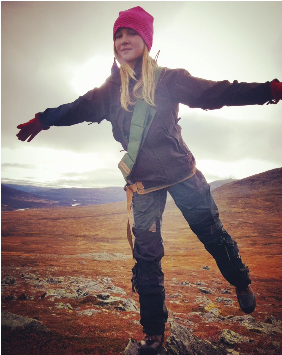
Projektet Fjällkunskap - en del av vårt natur och kulturarv ska sprida kunskap om villkoren i svensk-norska fjällen.

Inom insatsområde natur och kulturarv ska Fjällkunskap – en del av vårt natur och kulturarv sprida kunskap om framförallt Sylarna, som är ett svensk-norskt högfjällsområde med ökande tryck från besöksnäringen. Möjligheter och utmaningar med krav på en hållbar utveckling av turismen, vid sidan om en aktiv renskötsel i en känslig natur. Kunskapen om förhållandena kring våra känsliga fjäll är ofta bristfälliga och åtgärder för ett långsiktigt hållbart system bör till för att skapa förståelse och insikt i fjällfrågorna. Svensk och norsk projektägare är Naboer.