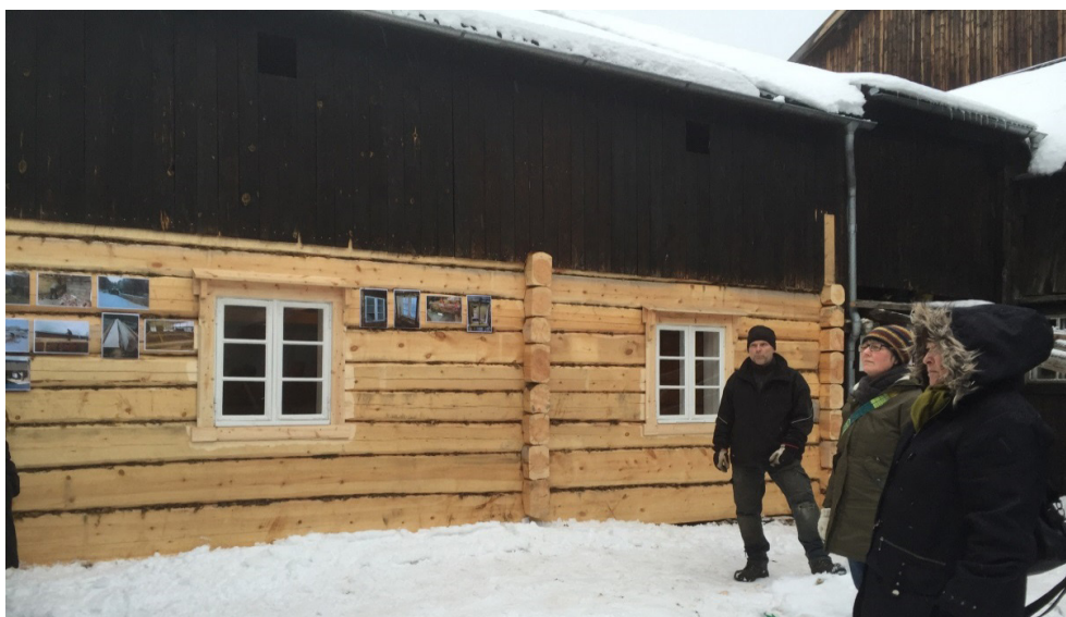
Tatt i forbindelse med et seminaret «Håndverksfagene og det framtidige kulturminnearbeidet» arrangert av Norsk Kulturminnefond, hvor flere av prosjektdeltagerne/samarbeidspartnerne deltok, og hvor prosjektdeltager og byantikvaren i Levanger kommune hadde innlegg.

Projektet arbetar också med att stärka marknaden genom informationsinsatser mot beställare och med att väcka intresse hos och stödja ungdomar till att utbilda sig och etablera sig som entreprenörer inom hantverk. Partners är ett stort antal kommuner, föreningar, institut, arkitekter och museer. Projektägare är Stiftelsen Jamtli och Trøndelag Forskning og Utvikling (TFoU).