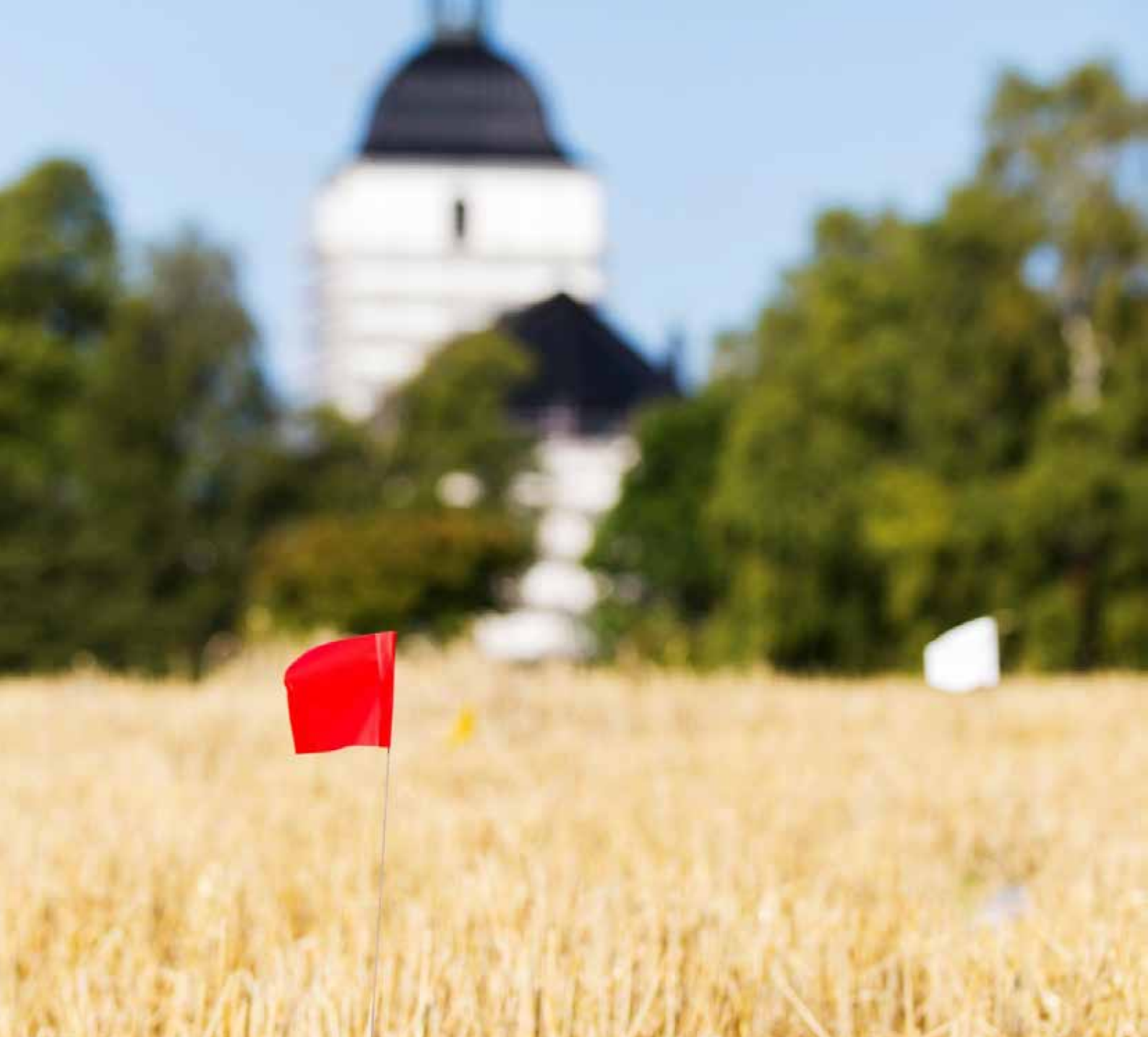
Utmarkering av fyndplatser med hjälp av vimplar. I bakgrunden syns Stora Mellösa kyrka i Närke.