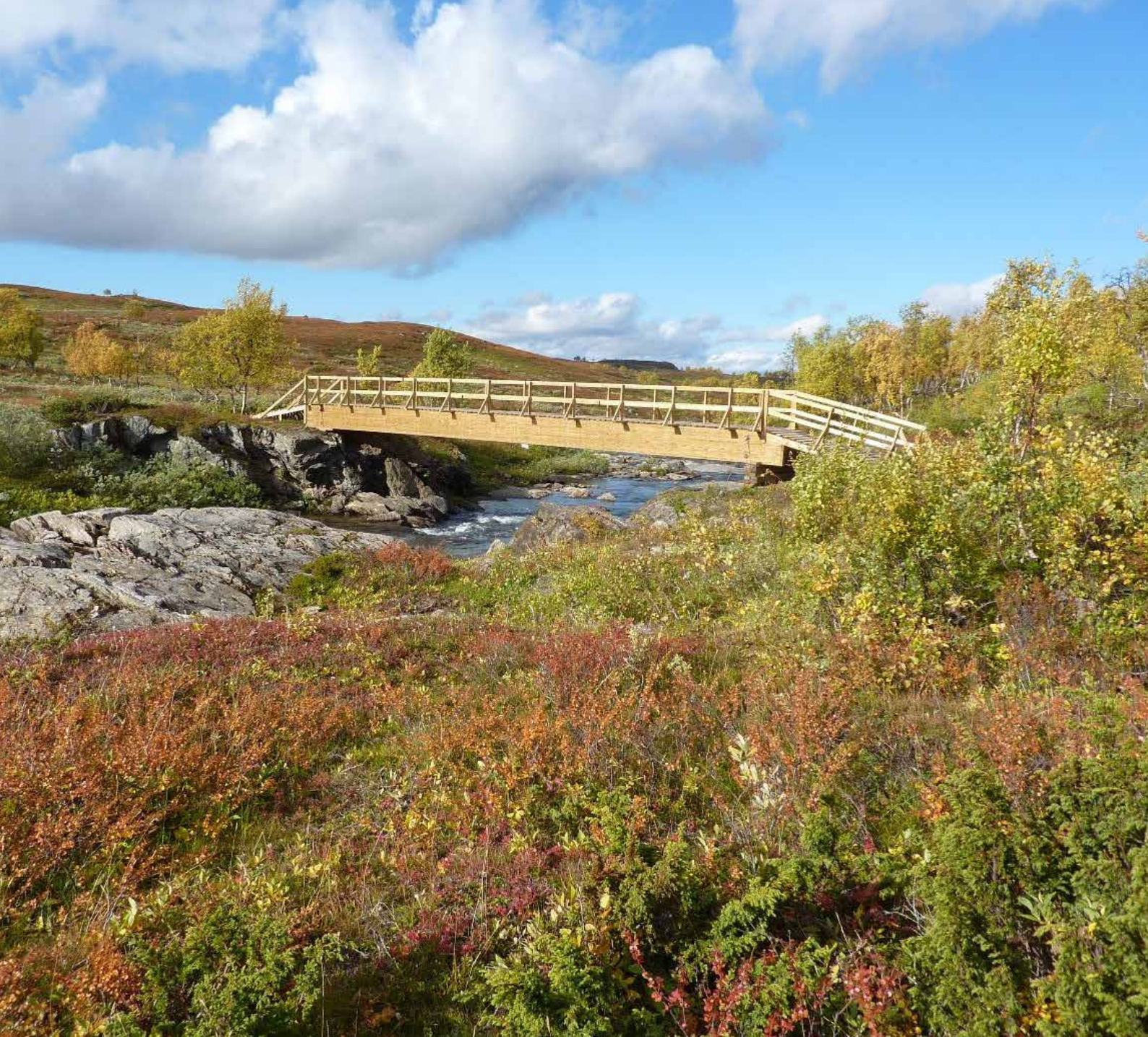
Atoklimpen i Storumans kommun.