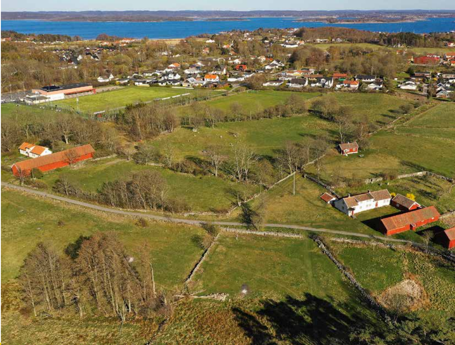
Mårtagården i Hallands län.