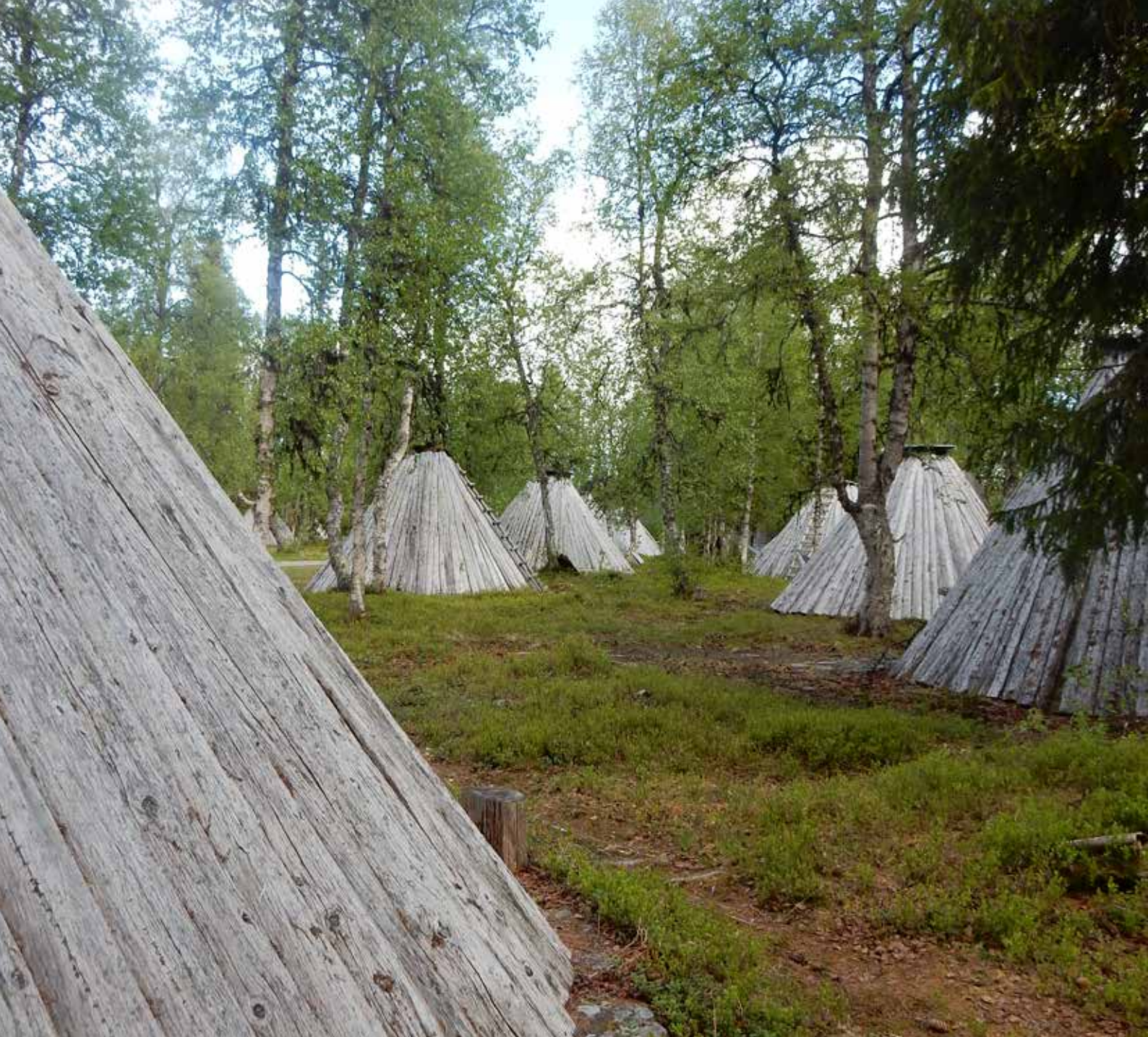
Kåtor i Ankarede kyrkstad, Strömsunds kommun.