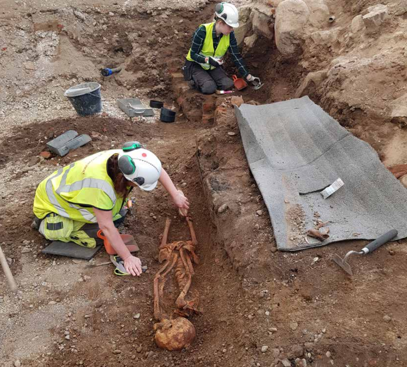
Arkeologisk undersökning.