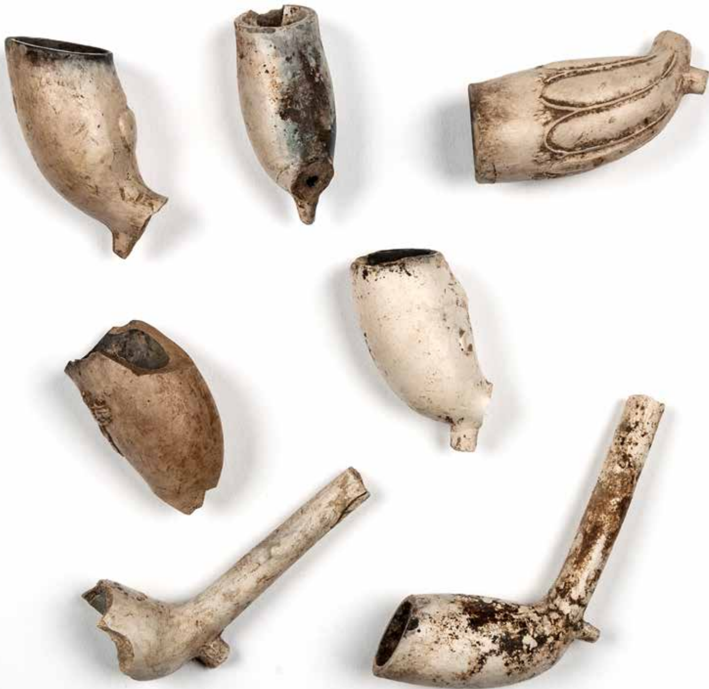
Fynd från utgrävningar: kritpipor.