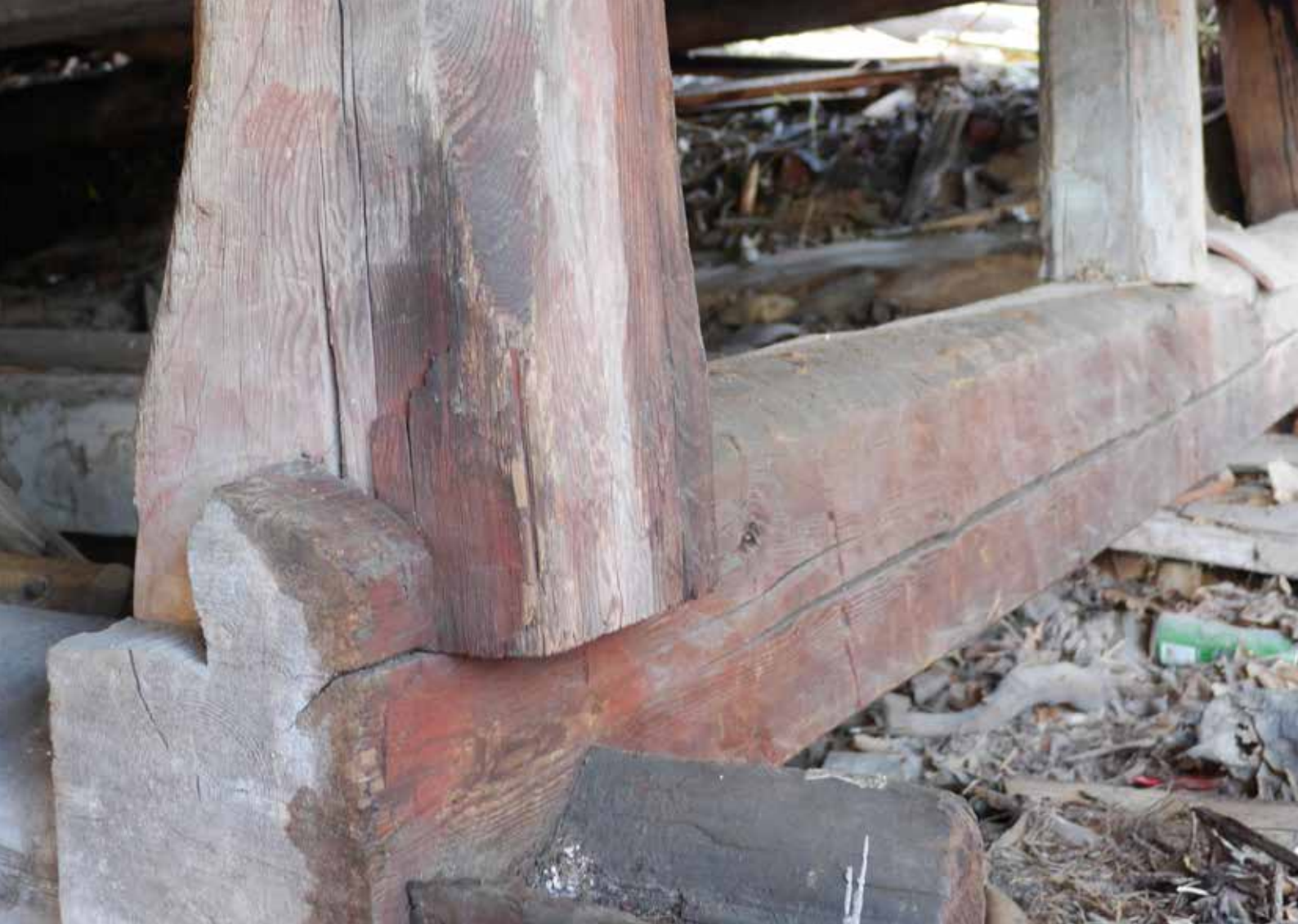
Närbild på stolpkonstruktionen.