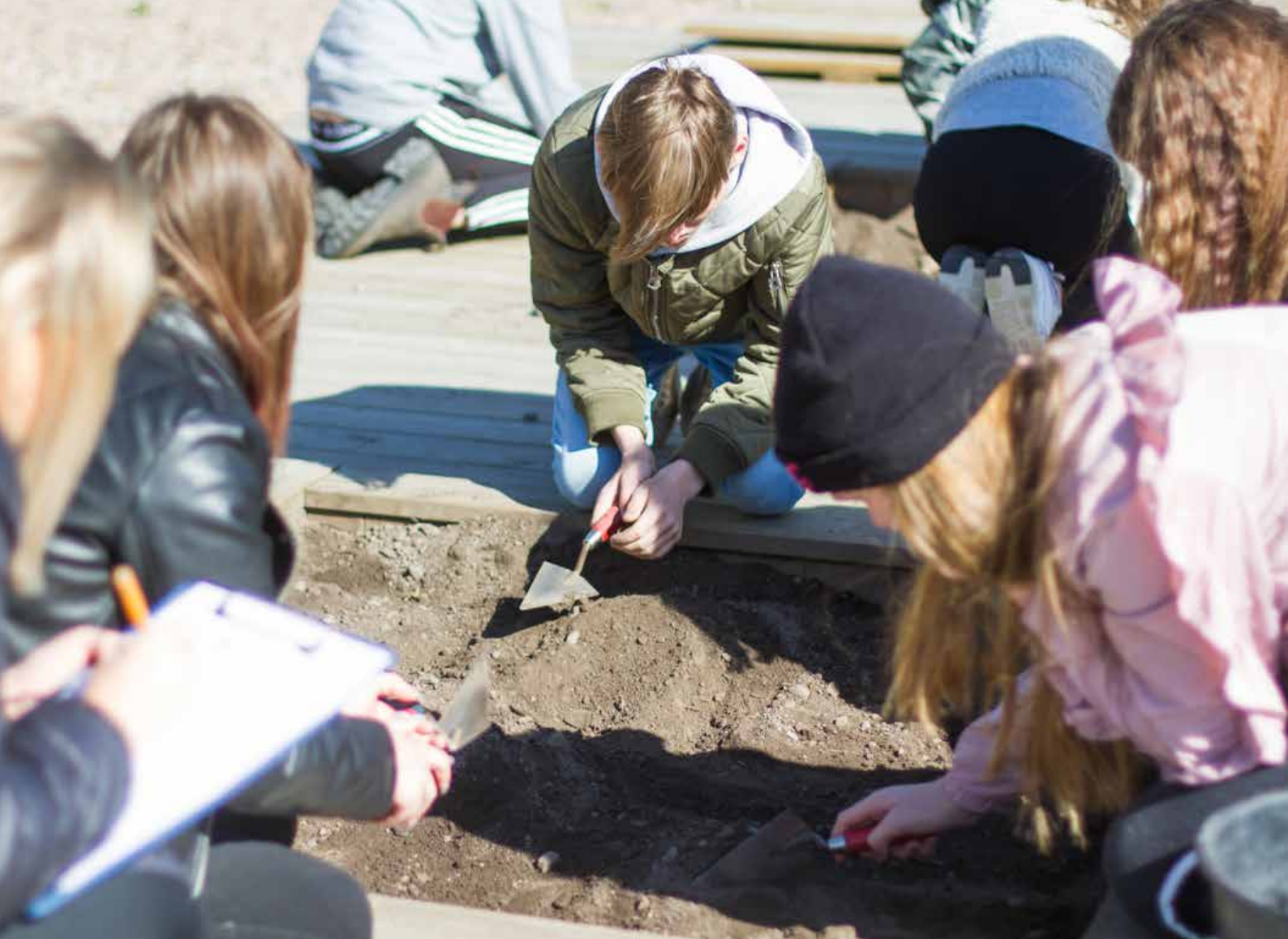
Skolelever deltar i arkeologiskola i Uppåkra.