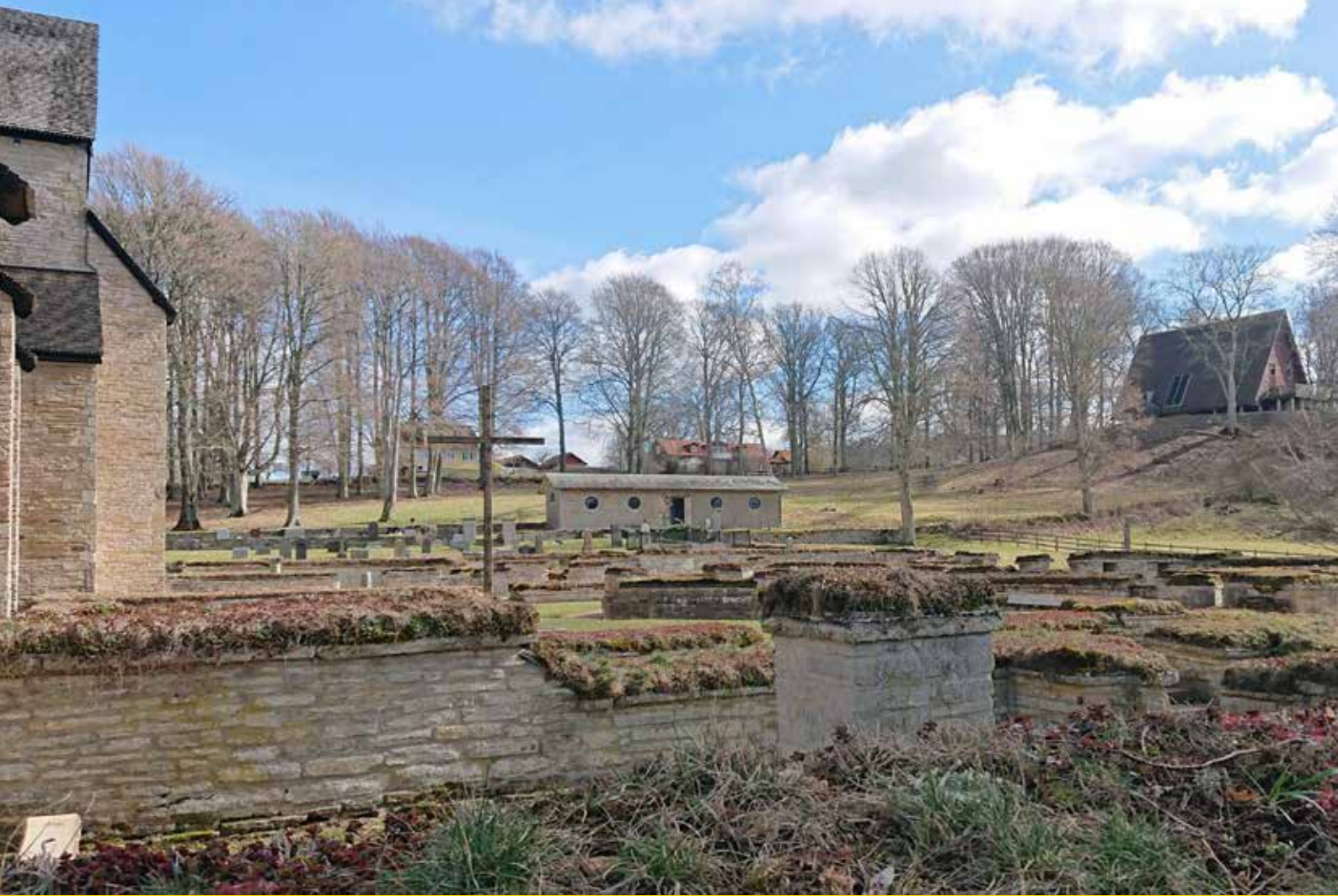
Klosterruinen vid Kata Gård.