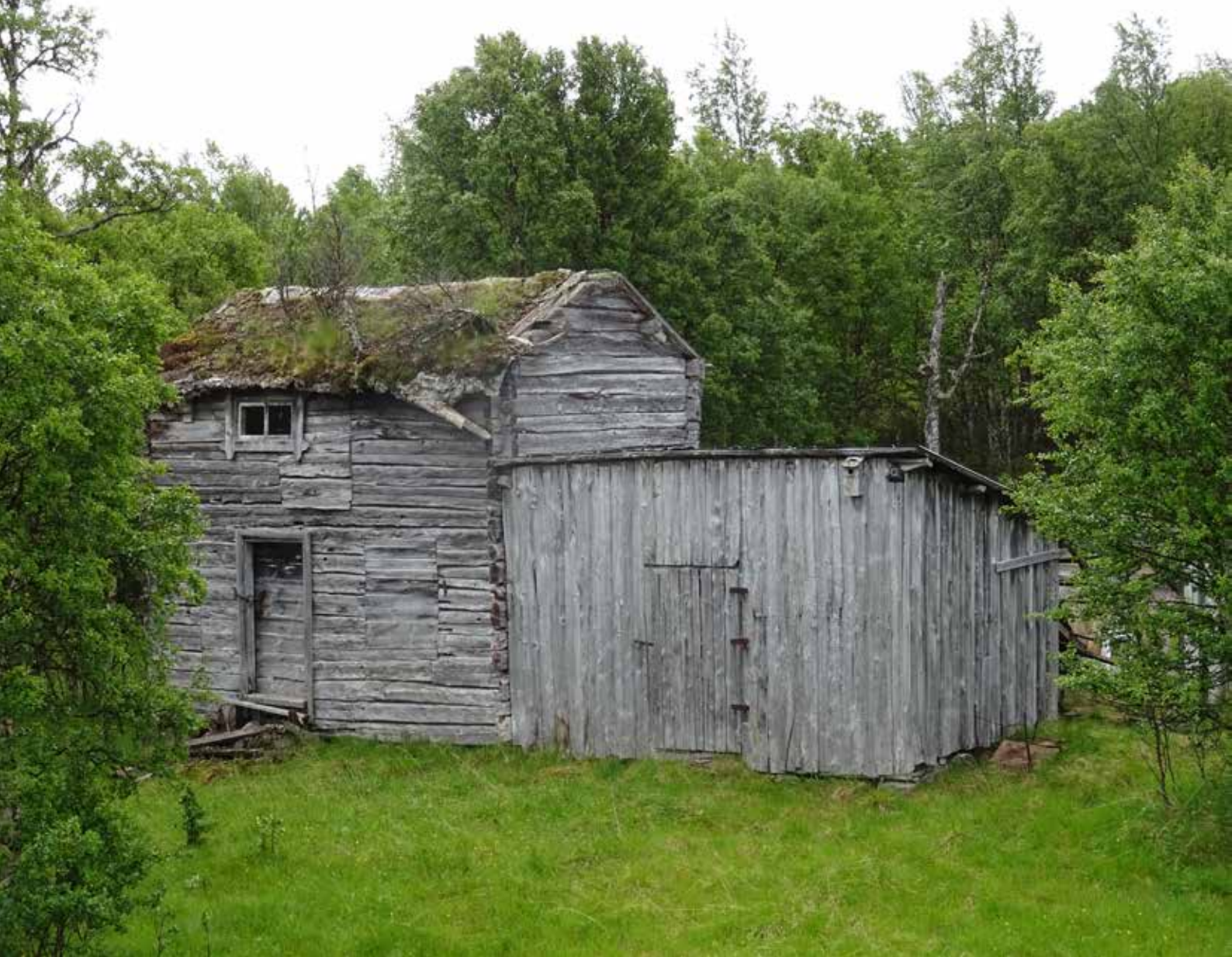
Förrådsbod i Mittådalen.