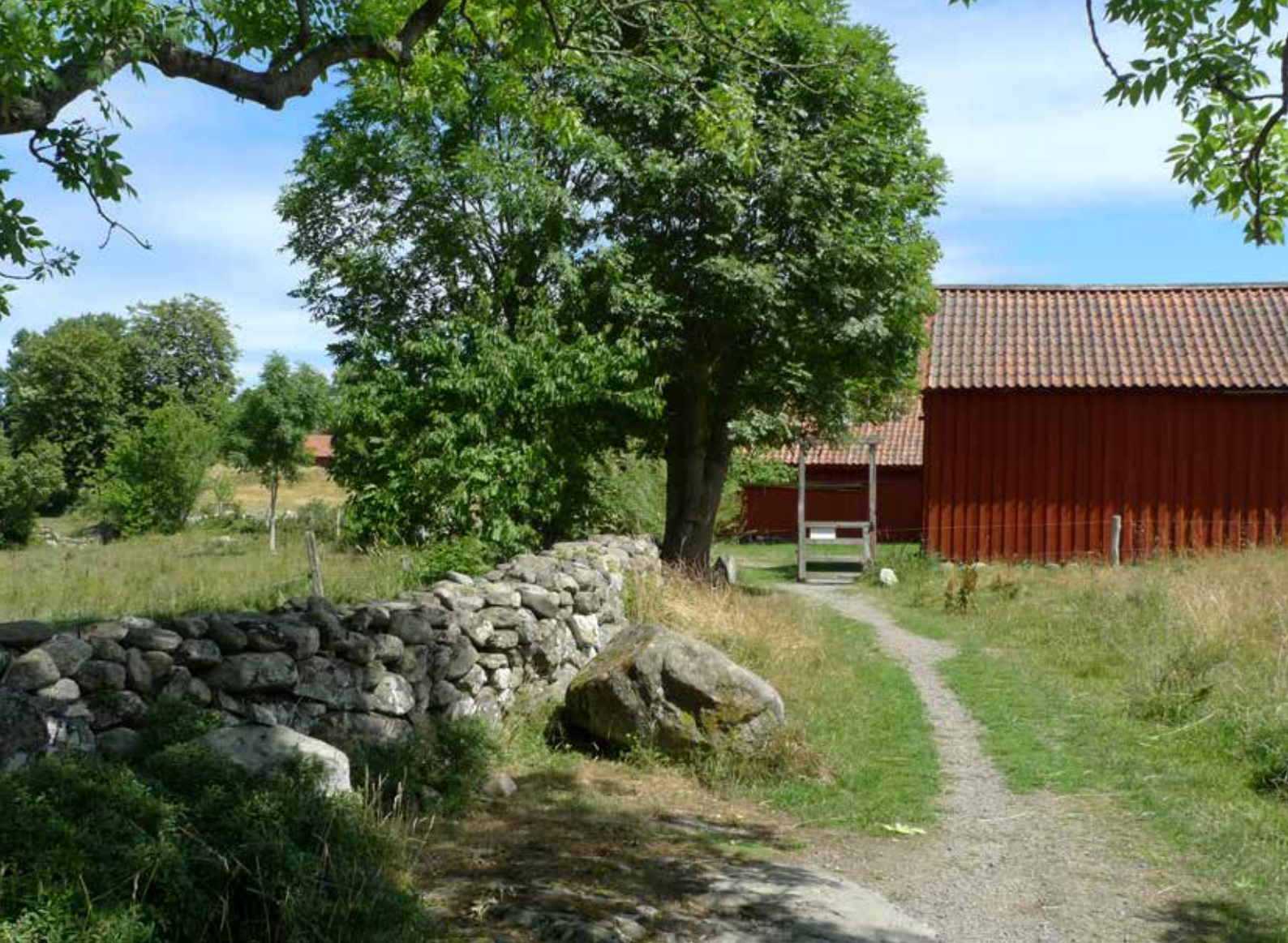
Fägata med hamlade lövträd och en av flera stengärdesgårdar.