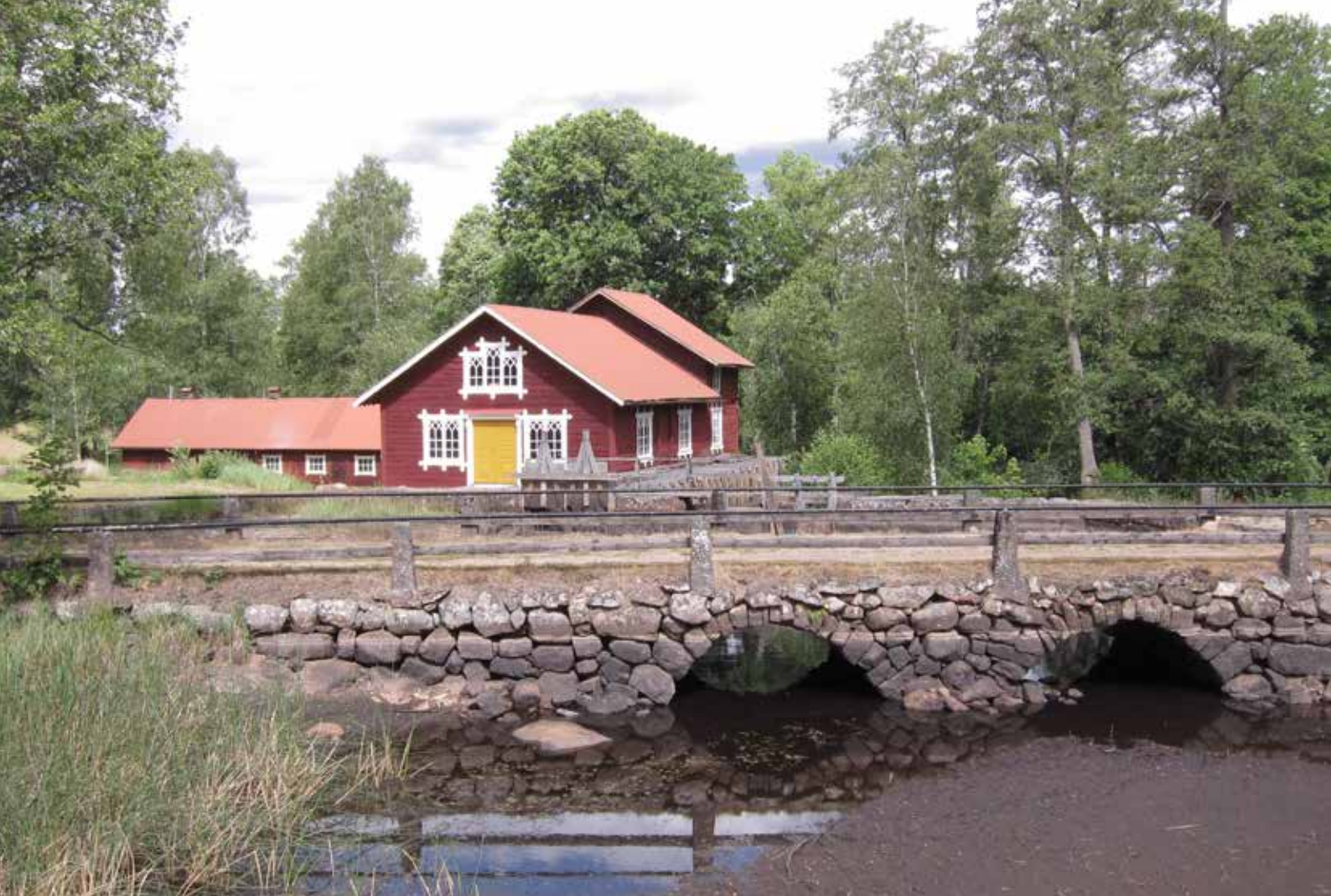
Haddarps kvarn i Hulfsfreds kommun.