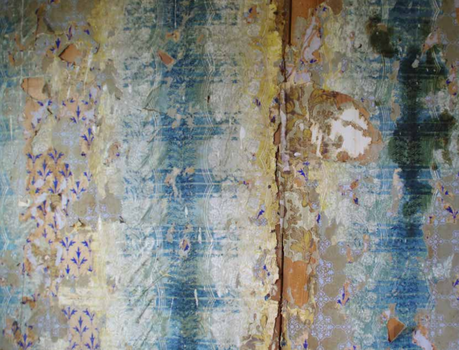
Äldre lager av tapet. Källa: Länsstyrelsen i Kronoberg