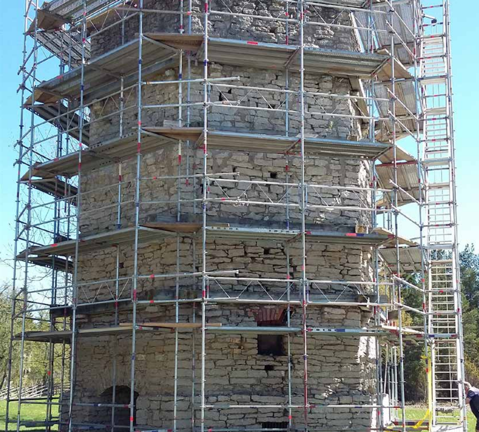
Södra kalkugnen.