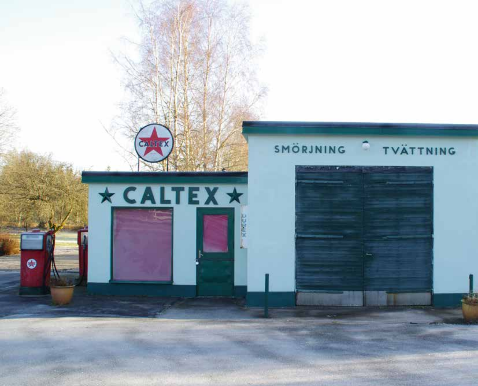
Caltex mack, Växjö kommun.