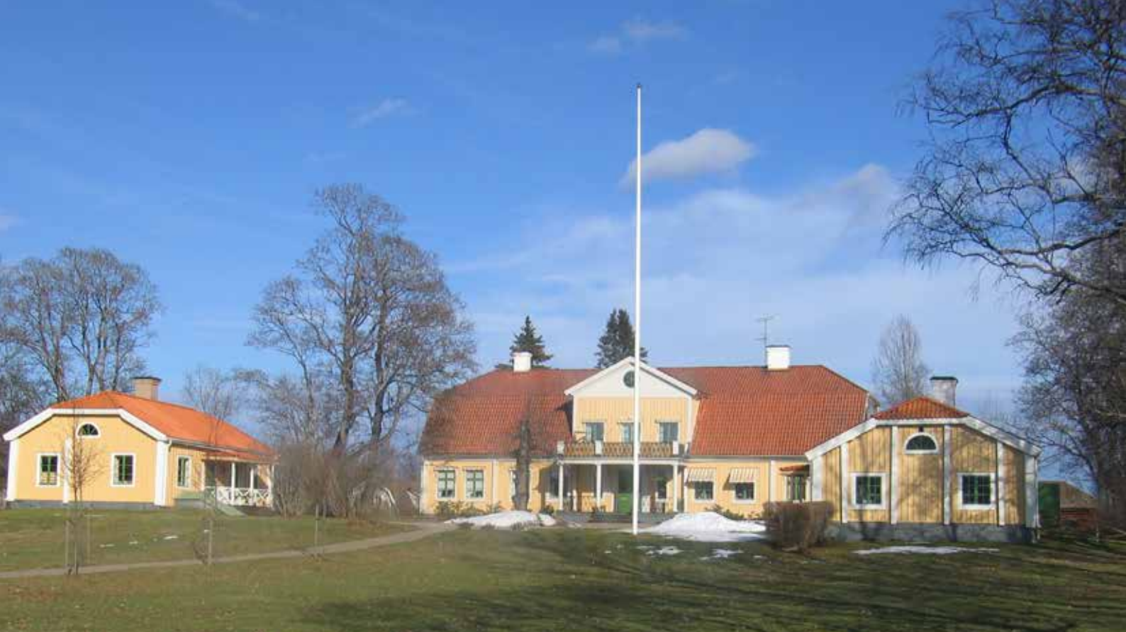
Prästgården i Grangärde