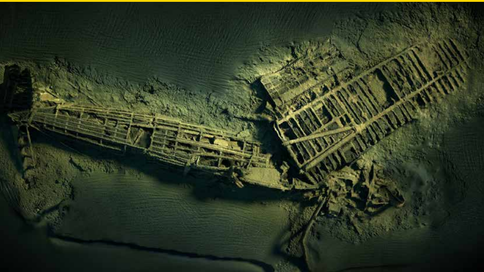
Flygplansvrak på havsbotten utanför Karlskrona.

Länsstyrelsen kan i vissa fall även fornlämningsförklara lämningar som har tillkommit 1850 eller senare.