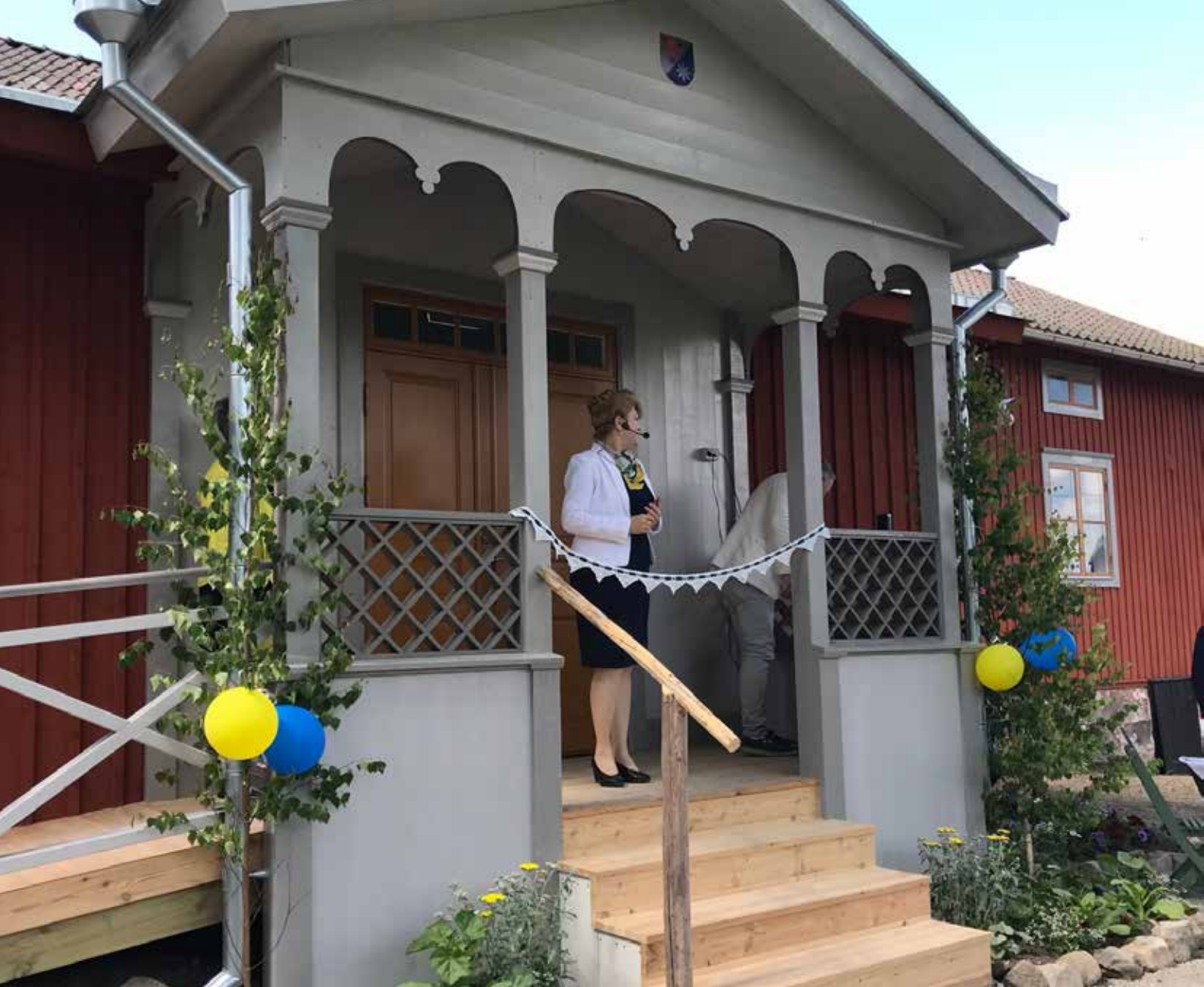
Landshövding Minoo Akhtarzand återinviger Tärna bygdegård, Sala kommun, efter ombyggnation och restaurering med bidrag från bl.a. kulturmiljöanslaget och landsbygdsprogrammet. Invigningen skedde i juni 2019.