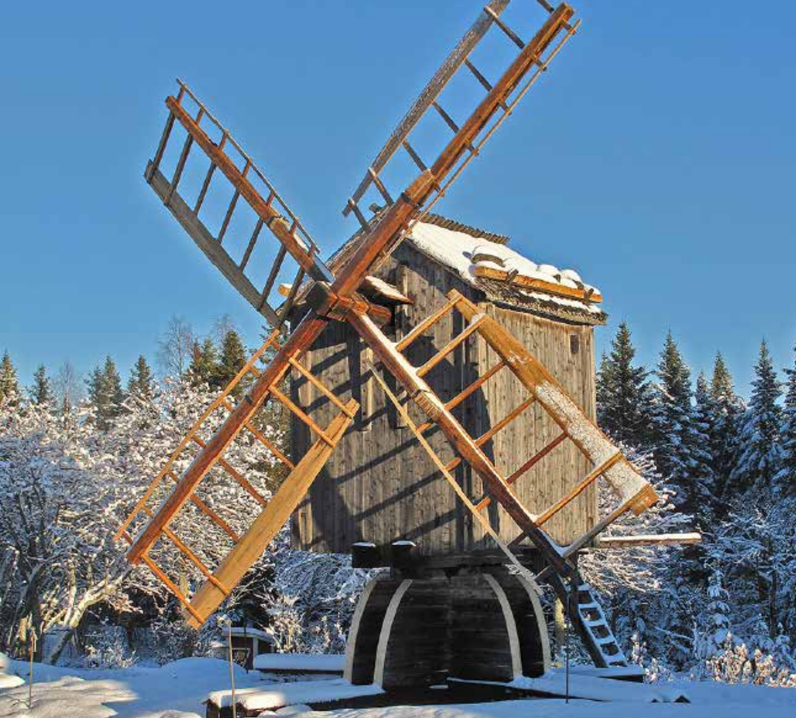
Holmön väderkvarn i vinterskrud.