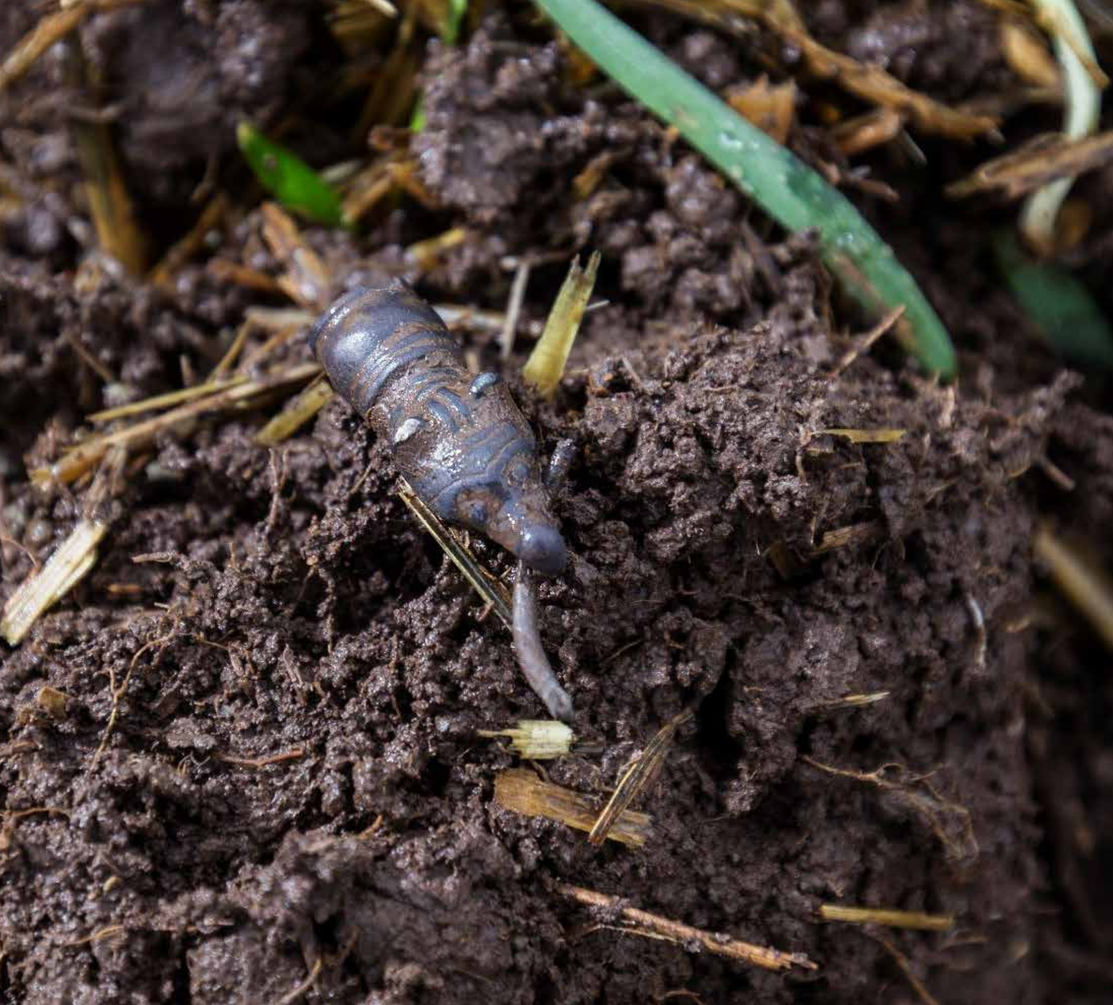
Fynd från undersökning: Ett silverbeslag i form av ett djurhuvud. Beslaget har sannolikt suttit i änden på en silverkedja.