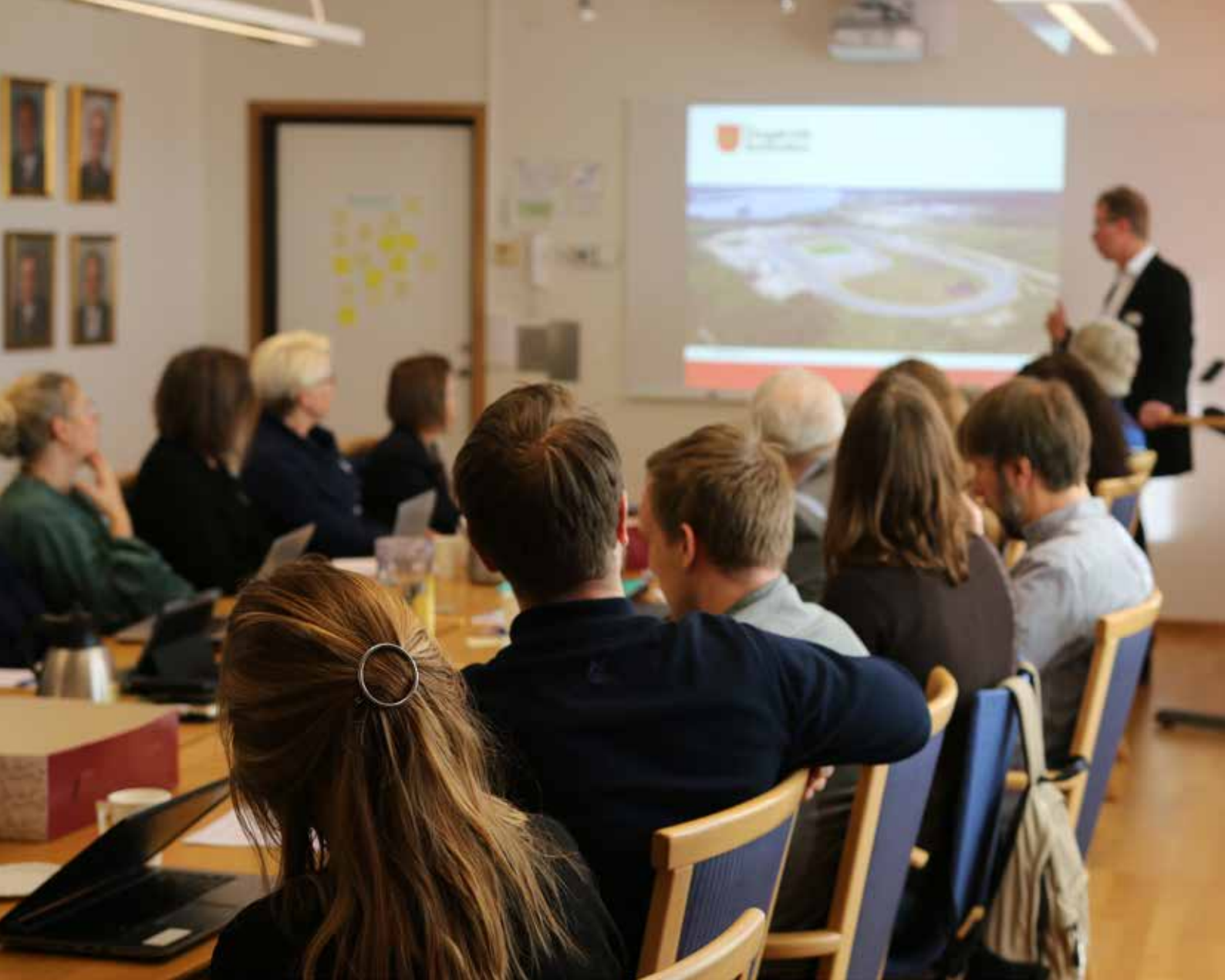
Dialogmöte i Tingsryds kommun.