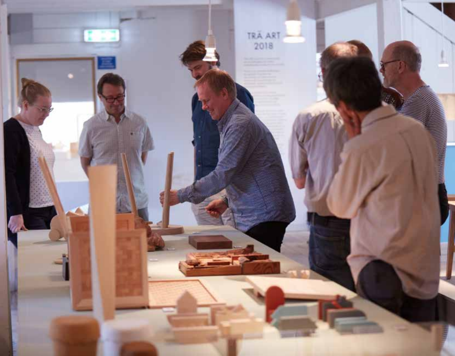
Visning av utställningen TRÄ ART, en av verksamheterna utmed Kulturgatan i Bodafors.