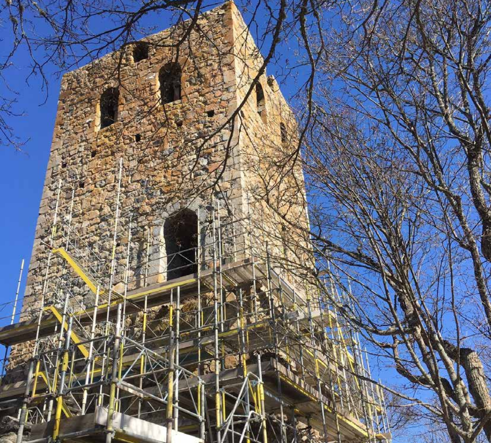
Kyrkoruin under restaurering.