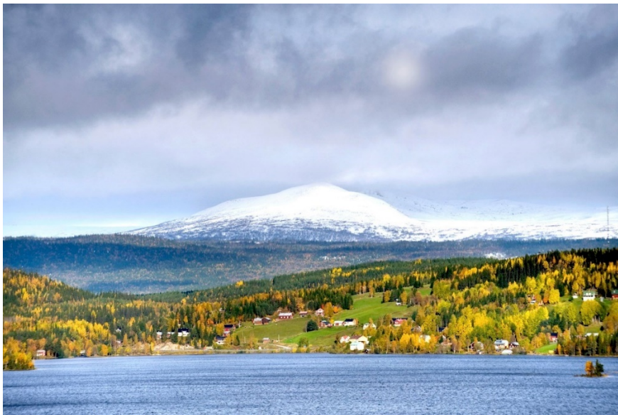
Bild 2 Bilden visar en vy över sjön Valsjön mot Valsjöbyn i förgrunden med ett snöbetäckt fjäll i bakgrunden. Byn ligger mellan sjö och fjäll i Jämtlands fjällvärld.

Ett konkret exempel är Valsjöbyn, samhället där initiativet till en robustare tillvaro för invånarna föddes. Byn ligger i nordvästra delen av Jämtlands fjällvärld, bara cirka fem kilometer från gränsen mot Norge. Här finns dagligvarubutiken Valsjöbua som är apoteks- och postombud och som har drivmedel i nära anslutning.