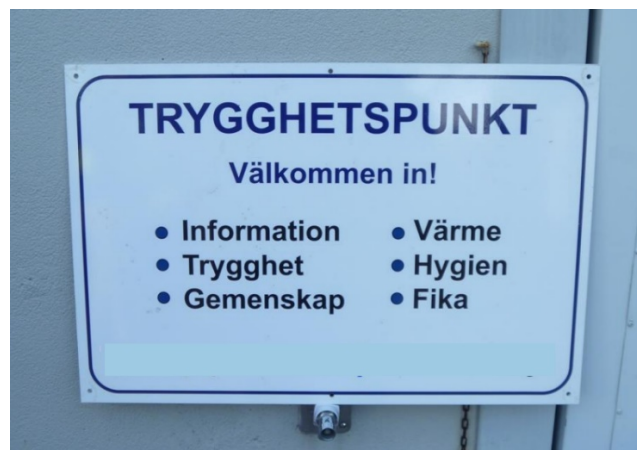
Bild 7. Bilden visar en skylt med skriften ”Trygghetspunkt” och dit du välkomnas in i värmen, tryggheten, fika med mera.

Begreppet trygghetspunkter kan även det beteckna olika saker. I ett inslag i SVT berättar en räddningsledare i en fjällkommun att man installerat nödtelefoner ”som ska vara trygghetspunkter i fjällområdena” . Medan begreppet på andra håll används bland annat inom sjukvården: ”Trygghetspunkten är till för patienter med behov av enklare åtgärder” .