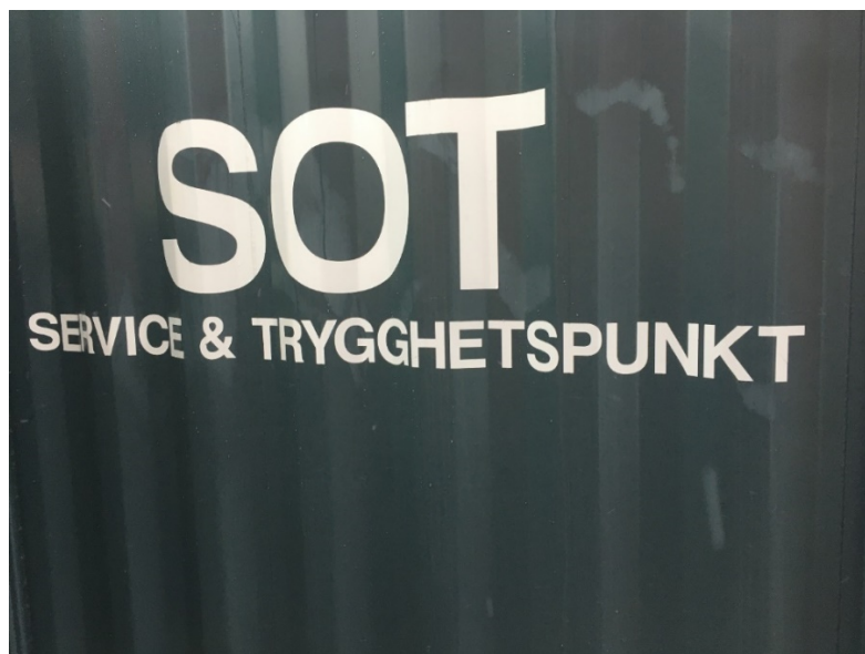
Bild 8. Bilden visar sidan av SOT-containern i Kall där texten SOT service- och trygghetspunkt framgår. Men hur tydligt ska det egentligen framgå i samhället att det utgör en SOT-punkt och varför?

SOT-punkter bör heller inte finnas redovisade i Tillväxtverkets databas PIPOS Serviceanalys som den är utformad idag. Detta med hänvisning till säkerhetsaspekten då SOT-punkten är en relevant komponent inom det civila försvaret. Detta görs än tydligare idag då vi övergått från ingenting via en pandemi till ett krig i Sveriges närområde. För den centrala frågan blir – varför ska den synas i databaser eller genom fysisk skyltning?