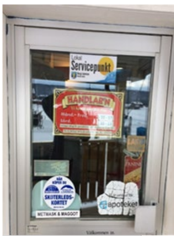
Bild 6. Bilden visar en entrédörr till en servicepunkt som också är en dagligvarubutik i Bergs kommun.

En kommun har inrättat en servicepunkt i biblioteksbusen och beskrivs som ”... en central samhällsinstitution på flera sätt” . Som har ”... stor betydelse för människorna i flera socio-ekonomiskt utsatta områden i kommunen.” I det här fallet kommer bussen till olika typer av knutpunkter där människor samlas som exempelvis en affär. I flera andra kommuner beskrivs servicepunkten främst som en träffpunkt där invånare kan ta del av information, fika och som ett forum för ”ideer och utvecklingstankar” .