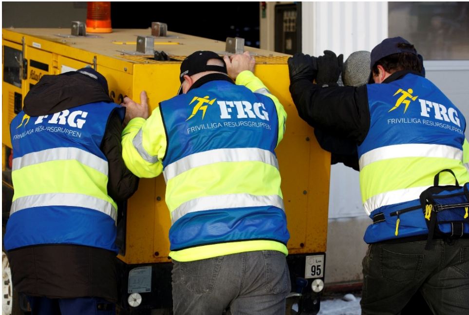
Bild 5 Bilden visar tre personer från en frivillig resursgrupp, FRG, som arbetar med att lasta gods. En frivillig resursgrupp kan utses av kommunen och blir dess "förlängda arm" vid en samhällsstörning.

samhällsskydd och beredskap, MSB. Vid en krissituation då gruppen aktiverats av kommunen innefattas de även av försäkringar via MSB. Under 2021 har en kommun gått vidare med upprättande av en FRG som kommer att driftsätta SOT-punkten i Valsjöbyn i händelse av kris.