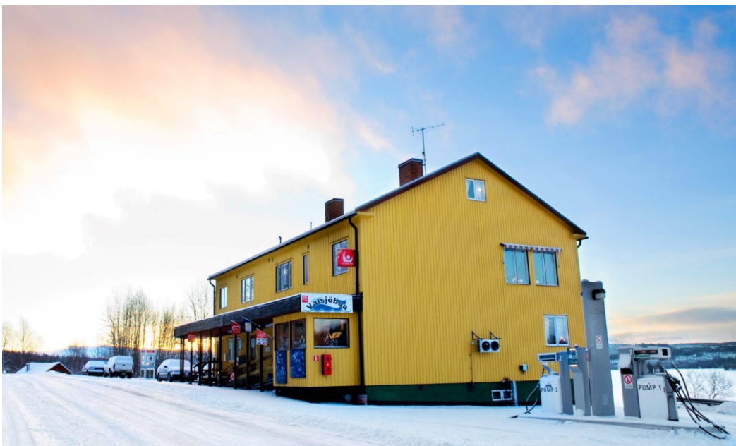
Bild 4. Bilden visar Valsjöbua, samt drivmedelsanläggningen i Valsjöbyn. Idag ansvarar butiker på landsbygden ofta för ett antal andra servicetjänster som post- och apoteksombud, turistinformation med flera.

En annan sårbarhet är att handlarna redan idag axlat en mångfald ombudstjänster som post, paket- och betaltjänster, utlämning av apoteks- och systembolagsvaror, spel med mera. I vissa fall även bibliotek. Butikerna är ibland även utpekade av sin kommun (i samråd med handlaren) att fungera som kommunala servicepunkter och utgör då exempelvis en mötesplats och en plats för informationsutbyte mellan kommunen, lokala föreningar och invånarna. Det är naturligt att ställa sig frågan om handlaren mäktar med ytterligare ett ansvarsområde.