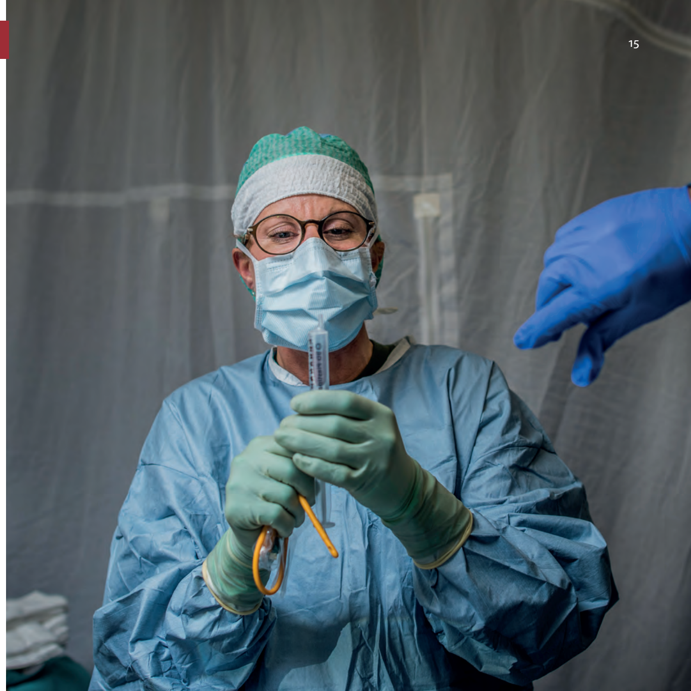
Utan fungerande sjukvård går det inte att försvara Sverige.

Samhället idag är komplext och sårbart. Om en enda samhällsviktig verksamhet faller bort kan det få långtgående effekter på andra viktiga verksamheter. Ett exempel är elförsörjning som hela samhället är beroende av. Bland annat kommer lamporna, uppvärmningen, spisen, kylskåpet, toaletten och bredbandet att sluta fungera. Dessutom kan det bli svårt att tanka bilen, betala med kort i butiker eller använda mobiltelefonen. Detta är ett scenario som tydligt visar på behovet av ett starkt civilt försvar. Aktörer som exempelvis levererar el måste kunna göra det även när de blir hårt ansatta, och de verksamheter som är beroende av el behöver ha tillgång till reservkraft. Det visar också på betydelsen av hemberedskap. Den enskildes eget ansvar är en viktig del i samhällets förmåga att stå emot och hantera allvarliga samhällsstörningar. Om invånarna klarar sig själva under den första tiden vid så väl kris som i krig så kan det offentligas resurser istället gå till dem som inte kan klara sig lika bra, t.ex. äldre och funktionshindrade.