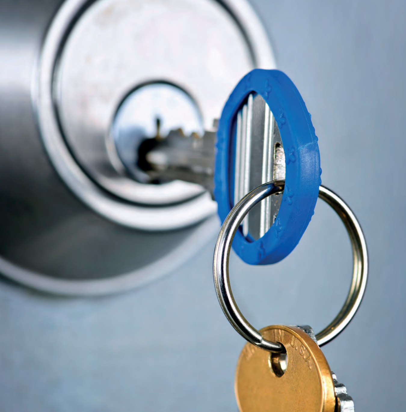
Säkerhetsskydd är ett prioriterat område i totalförvarsplaneringen.

avancerade behörighetssystemet till sitt kontor, men om medarbetarna släpper in personer som inte ska vara där blir systemet värdelöst. En viktig del är således att få medarbetarna att förstå att alla inte behöver ha tillgång till all information.