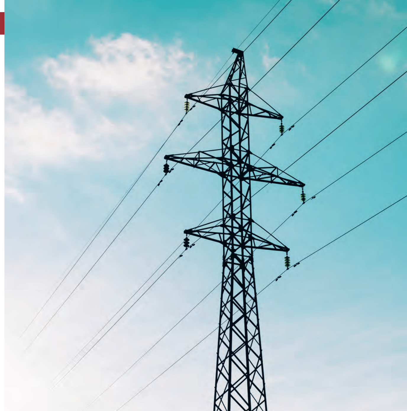
Elförsörjningen är avgörande för att samhället ska fungera vid krig.

Det förutsätter att Försvarsmakten har förmåga att möta ett väpnat angrepp mot Sverige. Men kanske ännu viktigare är att Försvarsmakten bygger upp en så trovärdig försvarsförmåga att andra länder inte tycker det är värt mödan att angripa oss. Då är försvaret inte bara ett skydd vid ett eventuellt angrepp, utan även konfliktförebyggande. Det är därmed ingen större skillnad på att det militära försvaret skyddar våra gränser och att du låser ytterdörren när du går och lägger dig. Båda handlar om skydd.