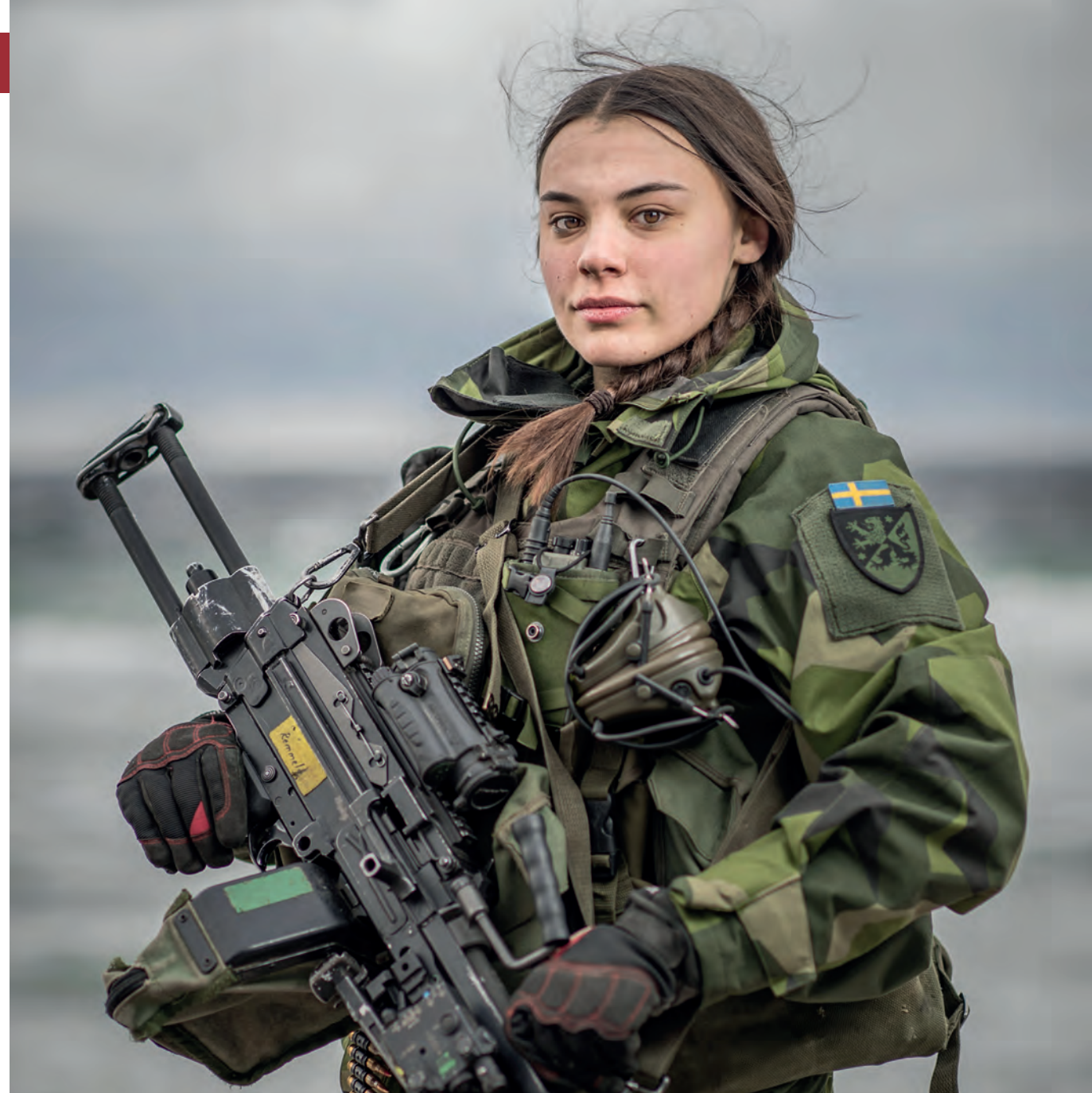
Värnplikten är ett sätt man kan tjänstgöra på vid krig. De andra är civilplikt och allmän tjänsteplikt.