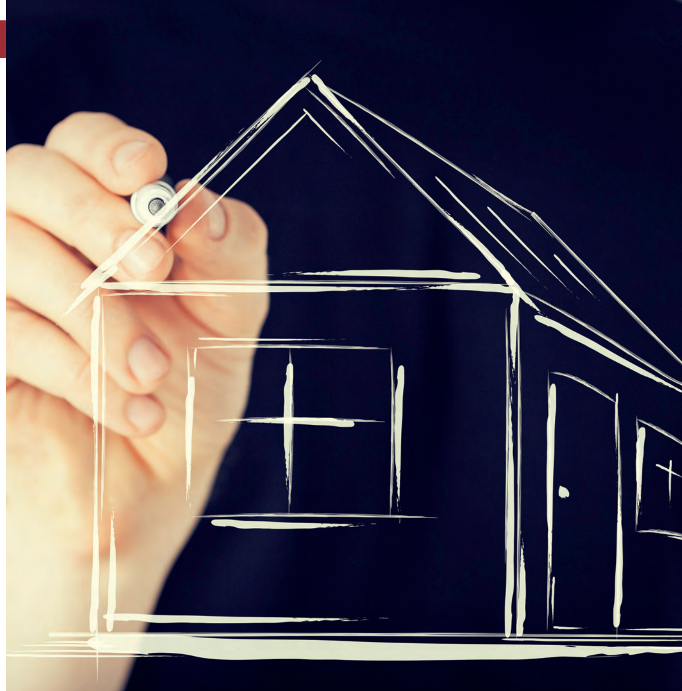
Det militära försvaret kan liknas vid ett hus som skyddar oss.