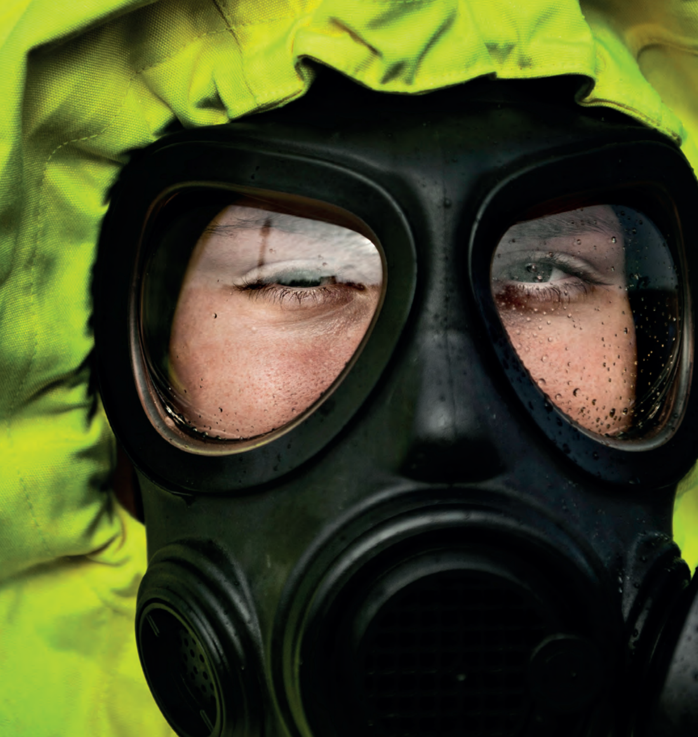
Samhällets krisberedskap är grunden som det civila försvaret ska byggas på.

Det militära försvaret är också beroende av ett starkt civilt försvar. Utan till exempel drivmedel, livsmedel och sjukvård går det inte att försvara Sverige. För att det civila försvaret ska kunna utföra sitt uppdrag behöver dock det militära försvaret skydda samhället och dess funktionalitet. Båda sidorna är alltså beroende av varandra och behövs i det totala försvaret av landet.