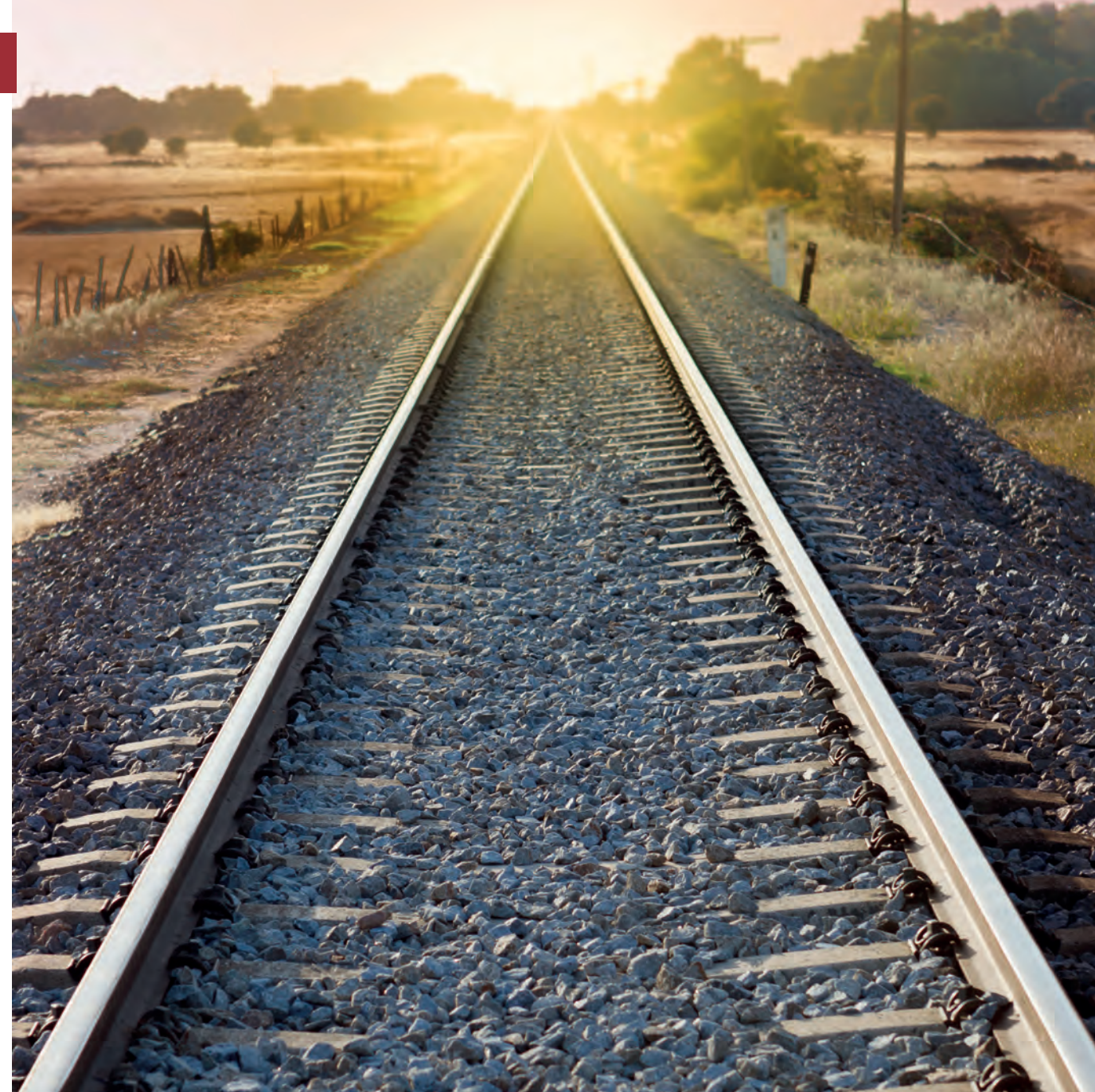
Vägen mot ett nytt totalförsvar börjar med att bygga en stabil grund att stå på.

När det är klarlagt vad organisationen ska klara av vid höjd beredskap behöver det utredas vad som krävs för att lösa uppdraget. Man behöver fundera över vilka verksamheter som måste