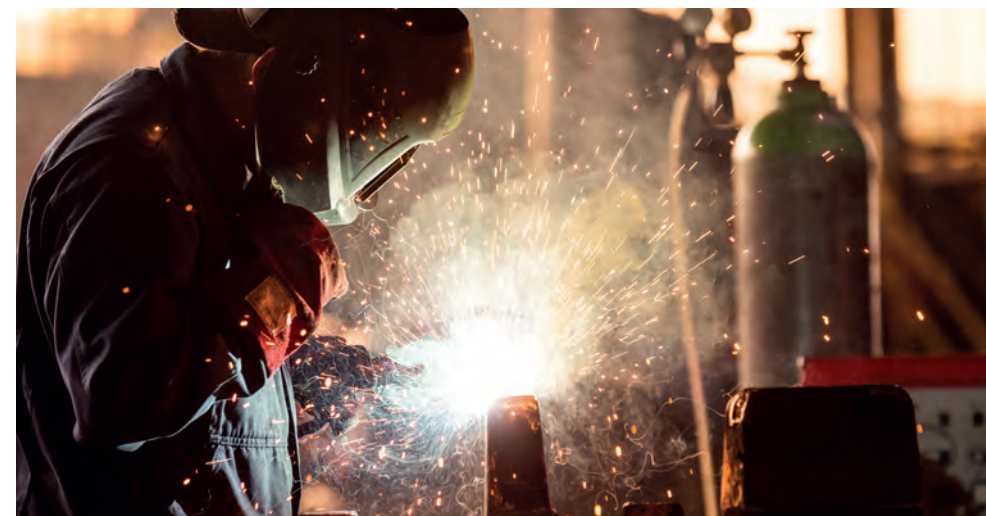
Förr var många så kallade krigsviktiga företag skyldiga att fortsätta sin verksamhet vid krig.

Med allt detta i åtanke krävdes ett enormt planeringsarbete. Militära och civila verksamheter samordnades över hela landet och alla viktiga aktörer – offentliga som privata – engagerades i totalförsvarets arbete.