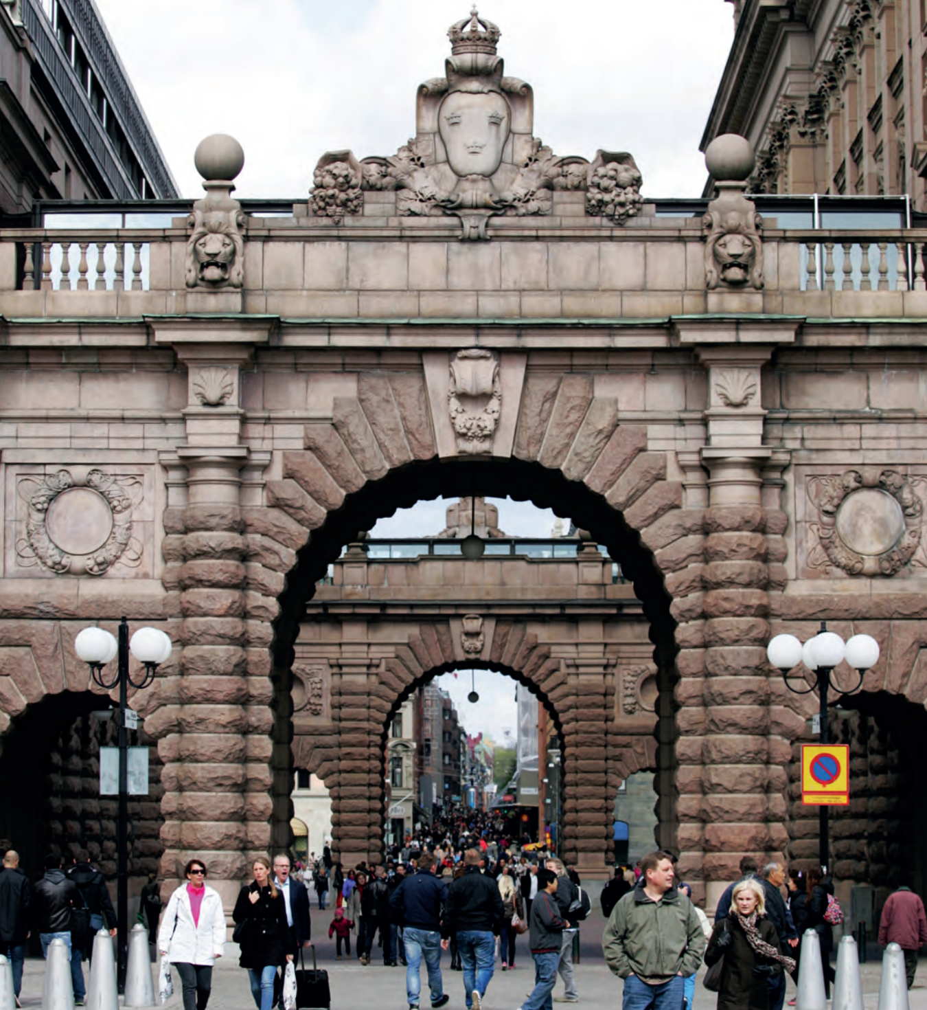
Totalförsvaret ska skydda vårt öppna och demokratiska samhälle.