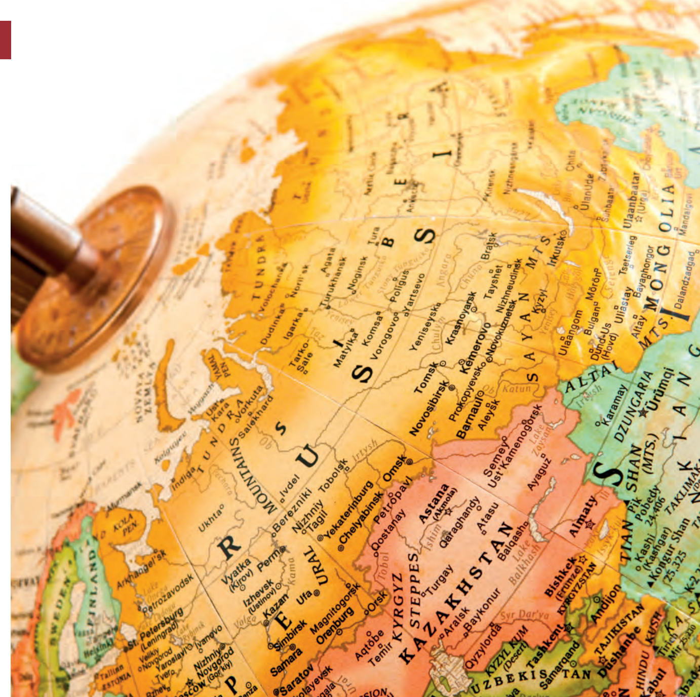
När Försvarsmakten och Säkerhetspolisen beskriver hotbilden mot Sverige talar man ofta om spänningen mellan Ryssland, Nato och EU.