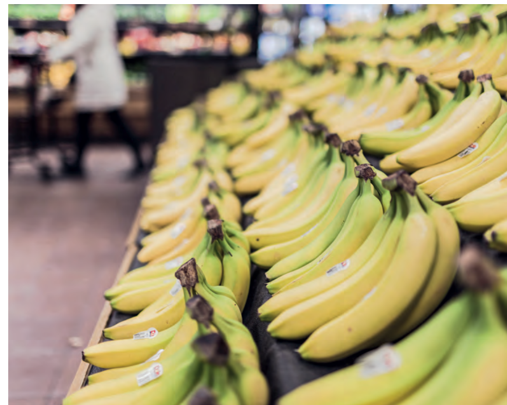
Om försörjningskedjan inte fungerar kommer maten i din lokala livsmedelsbutik att ta slut snabbt.

tryckningar. Det är även relativt enkelt att via sociala medier sprida vilseledande information till stora delar av en befolkning eftersom det har skett en tydlig förändring kring hur vi konsumerar nyheter. Förr var nyhetsutbudet begränsat till ett fåtal trovärdiga källor som Dagens Eko eller Rapport. Idag slåss istället en massa olika aktörer om uppmärksamheten i den digitala världen vilket gör det svårt att avgöra vem och vad man kan lita på. Det här kan en angripare utnyttja för att till exempel smutskasta vissa politiska kandidater eller på annat sätt minska befolkningens förtroende för samhället. Hotbilden vi behöver hantera är därmed mer komplex idag och det räcker inte längre att bara ha beredskap för att möta ett väpnat angrepp.