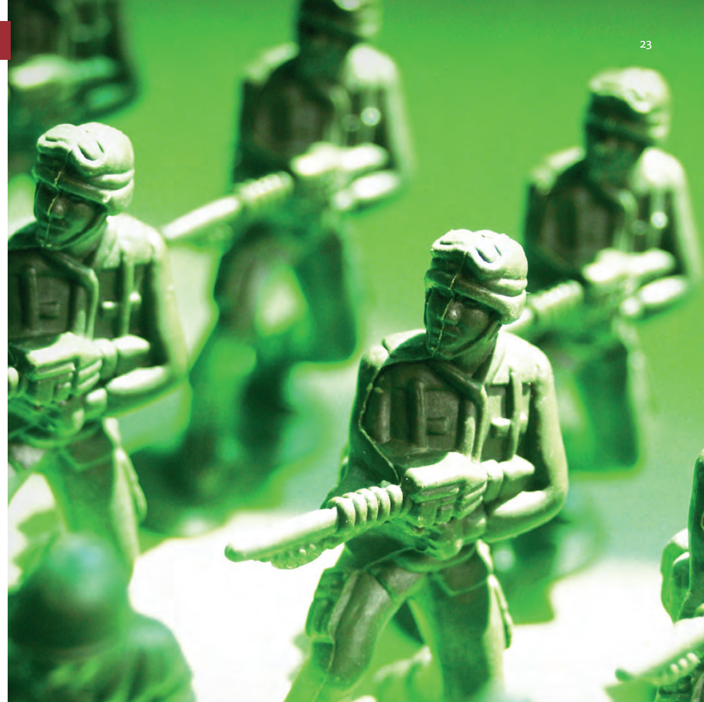
Ryssland använde så kallade gröna män som en del av sin krigföring i Ukraina.

Genom icke-linjär krigföring kan man med relativt små medel uppnå stor effekt. Om de icke-militära metoderna är tillräckligt effektiva behöver man inte ens genomföra ett militärt angrepp. I andra fall kan icke-militära aktiviteter användas för att bana väg för ett väpnat angrepp. Man kan exempelvis tänka sig ett scenario där en angripare gör det svårt för svenska myndigheter att kommunicera med varandra samtidigt som man bryter elförsörjningen i stora områden och sprider propaganda till den svenska befolkningen. Då skulle man kraftigt försämra Sveriges försvarsförmåga inför ett angrepp.