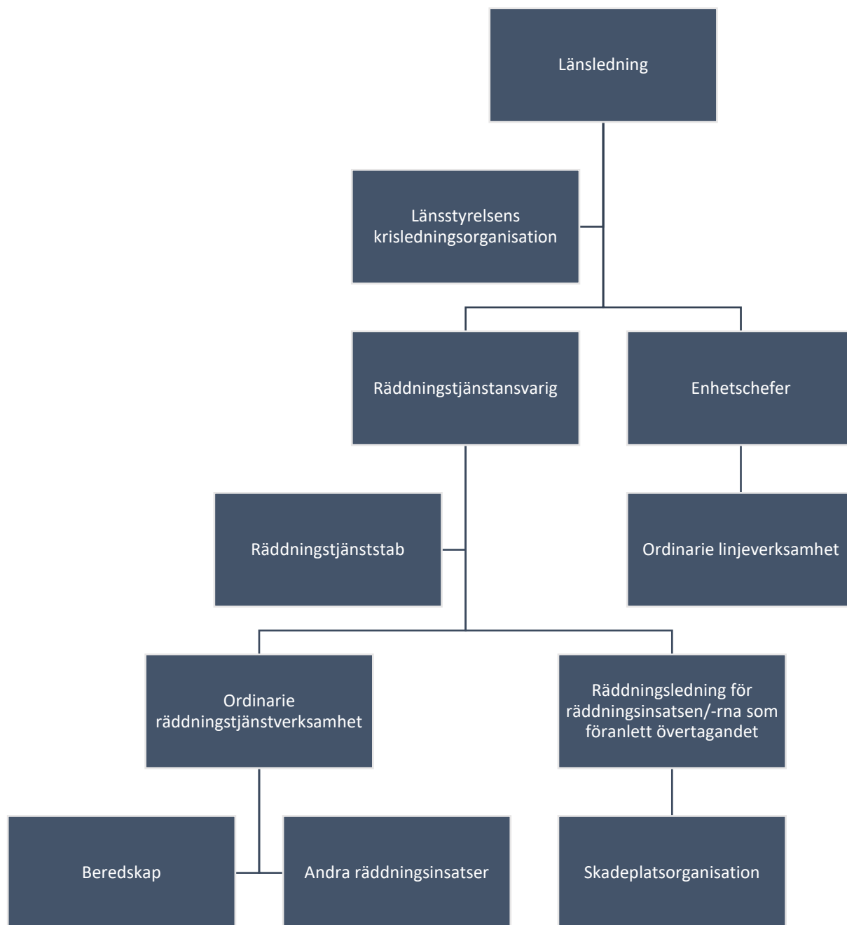
Figur 3 Ledningsstruktur vid övertagande av kommunal räddningstjänst.