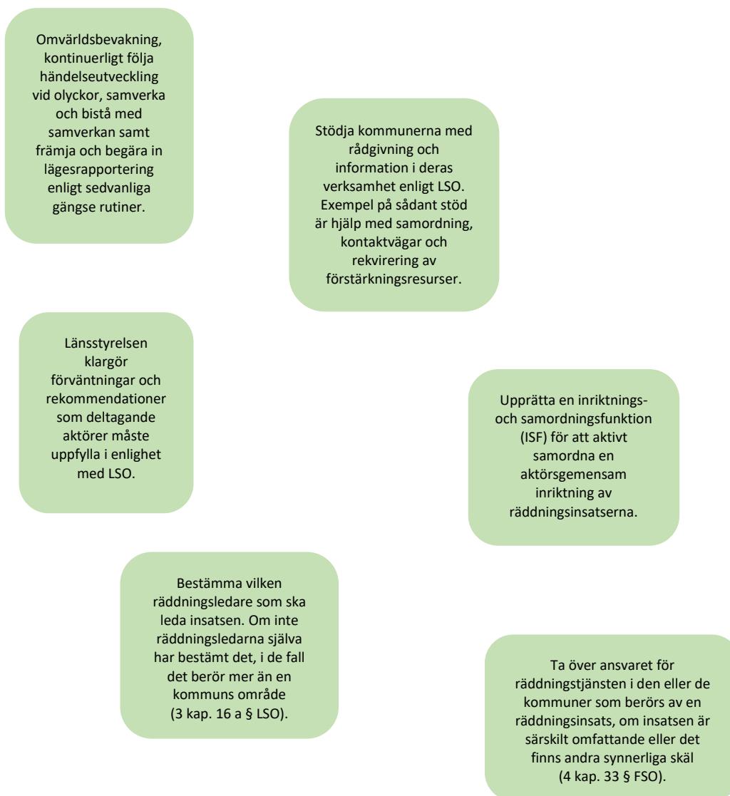
Figur 2 Stöd i analysprocessen inför ett eventuellt övertagande

Utvärdering av övertagandet bör påbörjas redan då ett övertagande initieras. Syftet med detta är dels att utvärdera räddningsinsatserna och dessas genomförande, dels att kontinuerligt utvärdera och förbättra ledningsprocessen under pågående räddningsinsats.