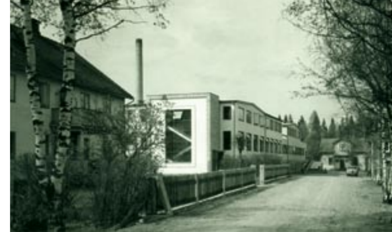
Skrufs glasbruk 1950-tal.

Sedan 1979 är det förbjudet, av hälsoskäl, att blanda egen mängd på glasbruken. Detta sker idag