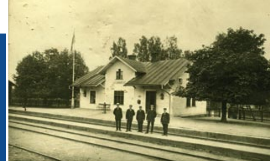
Järnvägsstationen tidigt 1900-tal.

Exempel på disponentvillor finns i Boda, Björks-hult, Johansfors, Kosta, Orrefors och Åfors. De är idag privata och inte öppna för visning.