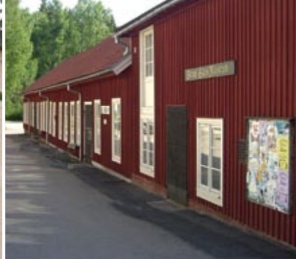
Tv: Ångmaskinhuset idag. Th: Glasmuseet fd sliperi.

extra kulturhistoriskt värdefullt eftersom detta är unikt i Glasriket idag. De höga fönstren och ångmaskinen byggdes för att elen ännu inte hade kommit till Skruf; Elen som både kom att ge ljus och kraft. Sliperibyggnaden klarade sig vid branden 1946 och är därför brukets äldsta byggnad. Den har exteriört genomgått en varsam kulturhistorisk renovering och ommålning 2002.