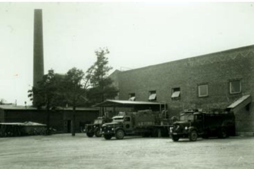
Bryggeriet i början av 1900-talet.