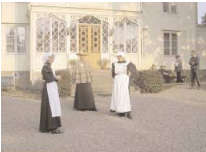
Kyrkeby gård och bränneri är ett levande kulturminne som också har blivit ett allt populärare utflyktsmål.