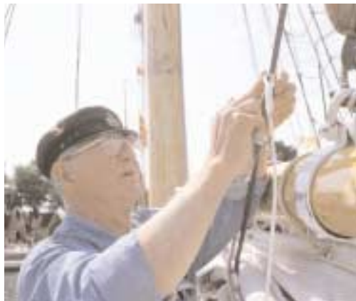
Entusiaster håller kulturarvet levande genom att vårda och berätta om det. Bilden togs under segel-sjöfartens dag i Kalmar 1997.

” Samhällets syn på kulturarv förändras ständigt. Som proffs måste man ha en övergripande, objektiv syn på historien och 'vaska fram kvaliteter' där man inte trodde att de fanns.