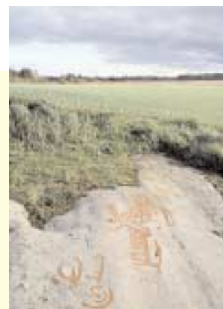
En hälsning från bronsåldern. Skepp och skålgropar, inhuggna i en berghäll i Lofta i norra delen av Västerviks kommun.