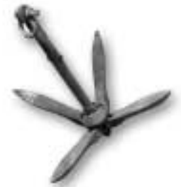
Dragg i gjutjärn, 1970-talet

” Kulturarvet står för humanismen i samhället. Det handlar om livskvalitet på olika plan, de värden som har betydelse för 'det goda livet'. Det är kulturarvet som utvecklar rötterna, föder förståelse och ger tryggheten i tillvaron.