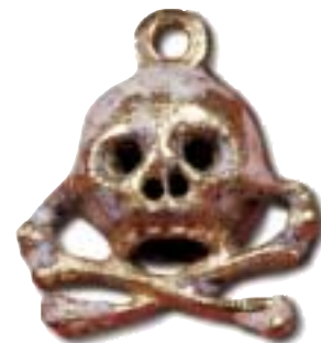
Berlock från regalskeppet Kronan, 1600-talet