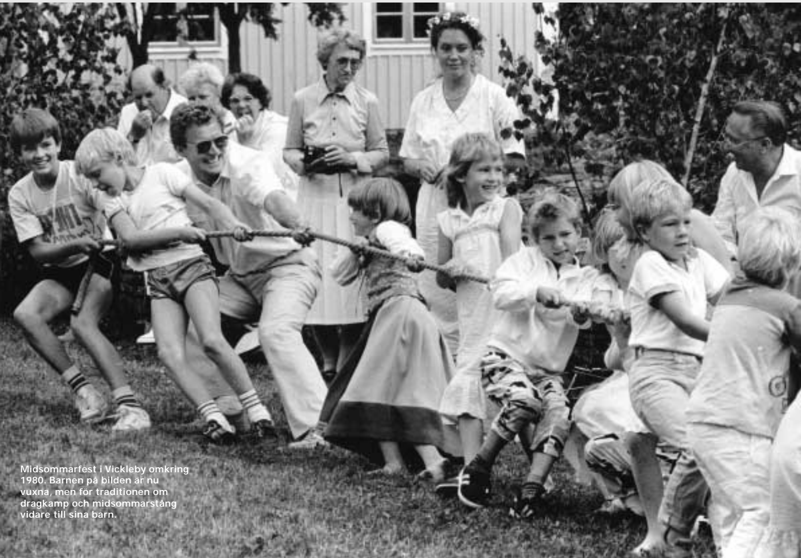
Midsommarfest i Vickleby omkring 1980. Barnen på bilden är nu vuxna, men för traditionen om dragkamp och midsommarstång vidare till sina barn.