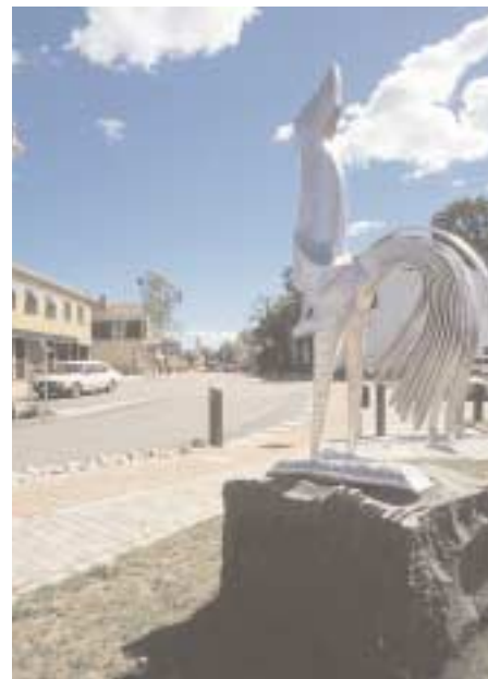
Vid Allfargatan i Torsås paraderar Slöjdriketets egen symbol – Torsåstuppen.