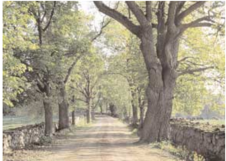
Den murkantade allévägen mellan Strömsrum och Timmernabben tillhör länets klenoder när det gäller det gamla vägnätet.

Kontaktperson: Liselotte Byström, tel. 0499-170 00.