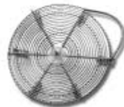
Underlägg för kaffekokare, 1910-talet