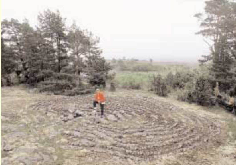
På Kyrkogångsskär vid Kråkelund ligger en av ostkustens mytomspunna labyrinter. Ännu funderar vi över dess innebörd.