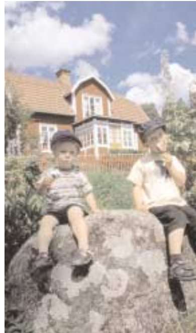
Astrid Lindgrens värld är ett av länets kraftfullaste exempel på K-märkt tillväxt. Till Katthult kommer små Emilar från hela världen för "å köpe sig e mysse".