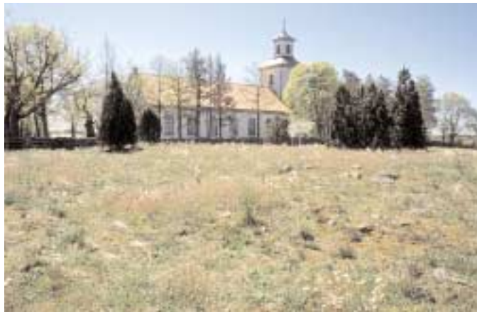
Sockenkyrkans läge är alltid valt med omsorg. Vid ett gravfält från järnåldern står Långemålas tempel förankrat i historien och väl synligt i landskapet.

I Växjö stift utbildas ledare för studiecirkel på temat sockenkyrkans historia. De flesta kyrkor och kyrkogårdar har en lång historia och genom åren har de förändrats för att anpassas till församlingens behov och tidens mode. Många förändringar har dokumenterats, men inte alla. En förutsättning för att kunna förvalta och vårda kyrka, inventarier och kyrkogård, nu och i framtiden, är att den samlade kunskapen är god. Studiecirkeln vänder sig i första hand till anställda och förtroendevalda inom församlingen och genomförs som arkivstudier, intervjuer och samtal. Resultaten kommer bl.a. användas i församlingarnas planer för vård och underhåll.