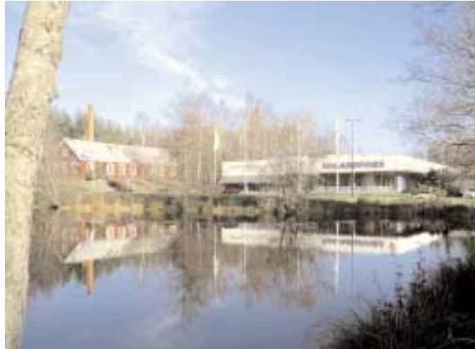
Länets vattendrag har utnyttjats i århundraden av människan. Johansfors är ett av flera glasbruk vid Lyckebyån.