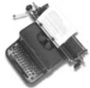
Skrivmaskin från Halda, 1940-talet