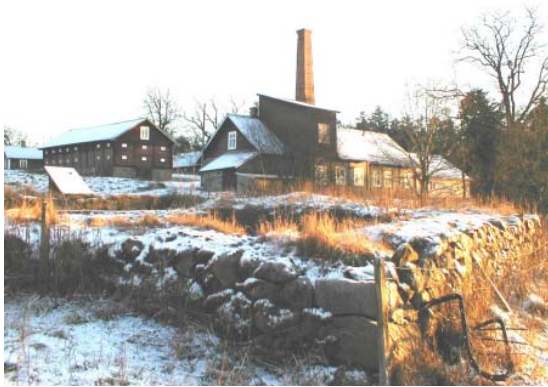
Kyrkeby brännvinsbränneri i Vissefjärda, Emmaboda kommun Utnämnt till årets industriminne 2002