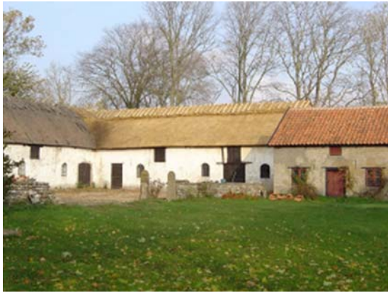
Omläggning av vasstak på f d Näsby prästgård. Beläget inom Världsarvsområdet Södra Ölands odlingslandskap