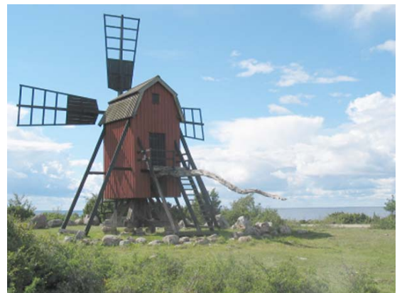
Öländsk våderkvarn, Eskilsund, Källa, Borgholms kommun

På Kalmar läns museums hemsida (se sista sidan) finns listor på hantverkare som deltagit i renoveringar med kulturhistorisk inriktning. Adresser till andra hantverkare nås på vanligt sätt via t ex gula sidorna i telefonkatalogen. På hemsidan finns också faktablad om olika delar av ditt hus. Du kan också få information på länsstyrelsens hemsida.