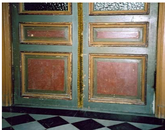
Inre port innan oljning