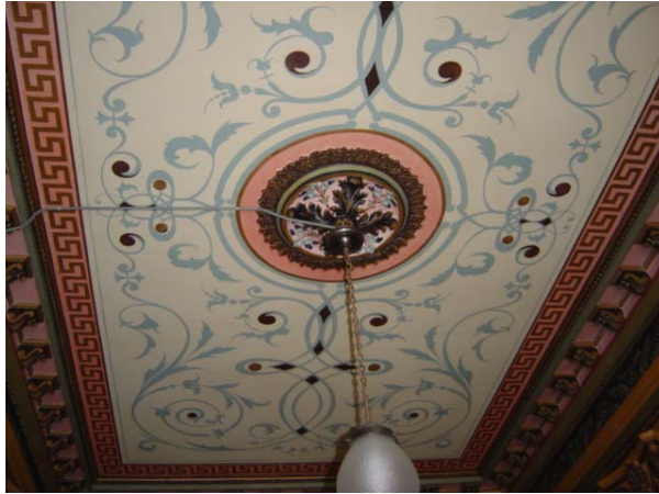
Tak i husets entré efter rengöring