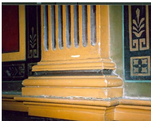
Pilaster i husets entréhall före retuschering

Väggar och tak i husets entré är skavda och nedsmutsade. Färgen i det bakre trapphusets trappuppgång flagnar. Sjöfartsmuseets entrétak är nedsmutsat.