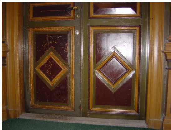
ytterdörr efter oljning