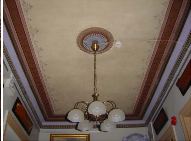
Tak i Sjöfartsmuseets entré efter rengöring