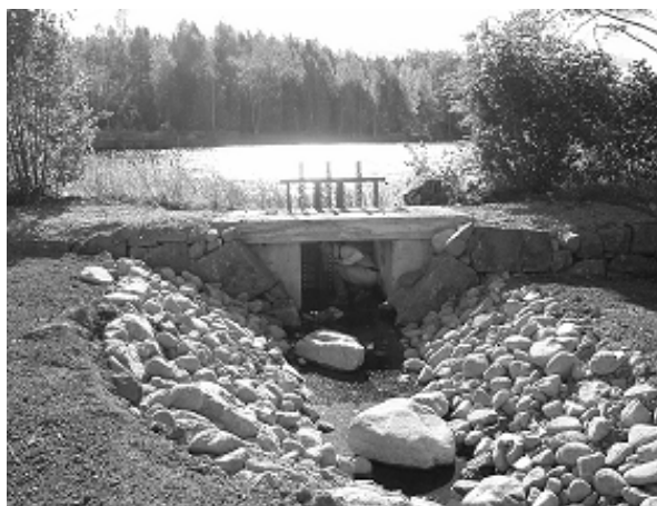
Omlöp i Nötån vid Bruksdammen i Fågelfors september 2006

EU: s miljöfond LIFE Nature har beviljat medfinansiering till ett WWF-projekt där målet är att säkra goda förhållanden för flodpärlmusslan i ett 20-tal vattendrag fördelade över landet. Som partners i projektet deltar länsstyrelserna i Västmanland, Örebro, Västra Götaland och Kalmar län, skogsstyrelserna i samma områden samt Karlstad universitet och Göteborgs stad. Projektet påbörjades november 2004 och ska vara avslutat november 2009. Vattendrag i Kalmar län som ingår i projektet är Nötån, Sällevadsån, Pauliströmsån - alla inom Emåns vattensystem i trakten av Fågelfors/Järnforsen. Under 2006 har det byggts tre omlöp i Nötån, vid Ljusholms kvarn, Bruksdammen i Fågelfors och Kronobo kvarn.