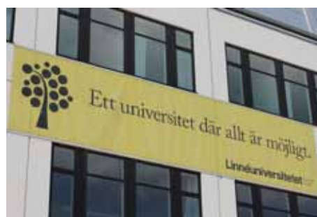
Forskning och utveckling är en viktig del av Kalmarregionens näringsliv.

Linnéuniversitetet är en stor arbetsgivare som också medför att människor med högre utbildning söker sig till länet. Detta kan innebära att företag som har koppling till forskning har större benägenhet att etablera sig inom länet. Universitetet kan även bidra till att andelen statliga jobb i länet ökar. Det ger också större möjligheter för ungdomarna att stanna kvar i närområdet. Järnvägen blir ett allt viktigare kommunikationsmedel i och med att Linnéuniversitetet, Kalmar-Växjö har bildats. Detta kräver snabba och täta pendlingsmöjligheter för både studenter och lärare, med god service på tågen och i anslutning till stationerna.