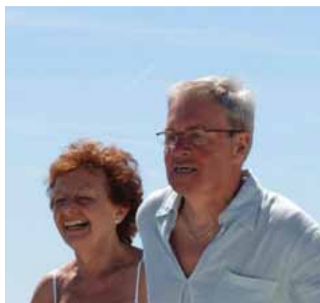
Att bygga flexibla planlösningar som kan förändras över tiden är en viktig förutsättning för god resurshushållning.

Årets enkät visar att endast sex kommuner lever upp till kraven i lagen om bostadsförsörjning, det vill säga har antagna riktlinjer för bostadsförsörjningen. Genom att Emmaboda och Nybro antog riktlinjer för bostadsförsörjning under 2013, ökade antalet kommuner med bostadsförsörjningsprogram ändå jämfört med 2012. De sex kommuner som saknar riktlinjer är de befolkningsmässigt mindre kommunerna i länet. Flera av dem uppger inte heller att de inte ser något större behov av att ta fram riktlinjer.