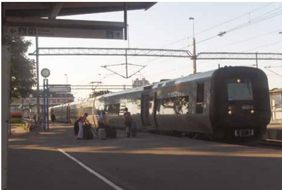
God kollektivtrafik är en förutsättning för en långsiktigt hållbar region.

Att pendla till ett arbete inom Kalmar län fungerar bra om man bor och arbetar i företag som ligger i kommuner längs med E22, liksom mellan Borgholm och Kalmar samt Mörbylånga och Kalmar. Även kust till kustbanan möjliggör goda pendlingsmöjligheter mellan Kalmar, Nybro, Emmaboda och vidare till Kronobergs län.