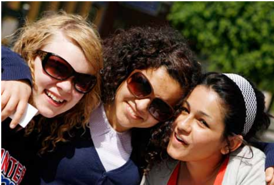
God grannskapsplanering är en viktig källa till gemenskap

Det framgår av andra undersökningar att yngre personer inte bara flyttar för studier utan också efter avslutade studier, detta till ett arbete som motsvarar den utbildning man har skaffat sig. Sammanläggningen av Högskolan i Kalmar och Universitetet i Växjö i januari 2010 till det gemensamma Linnéuniversitetet innebär förhoppningsvis att fler ungdomar söker sig till högre utbildning inom regionen. Utvecklingen av Linnéuniversitetet är en faktor av stor betydelse för in- och utflyttningen av 20-24-åringar. För att kunna behålla dessa efter avslutad utbildning är det viktigt att företag och myndigheter som efterfrågar högskolekompetens ges möjlighet att etablera sig i länet. Med krympande ungdomskullar kommer den nationella konkurrensen om denna åldersgrupp att öka och matchningen mellan arbetsmarknad och universitet blir därmed allt viktigare.