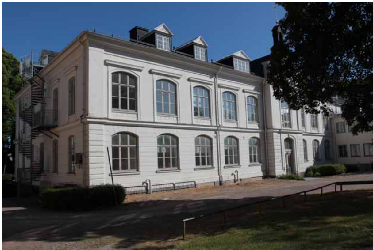
Kv Valnötsträdet, Kalmar centrum. Ombyggnad av sjukhus/skola till hyreslägenheter. Ett positivt exempel på hur historiska byggnader kan tillvaratas till nya användningssätt.

Sett över tid de senaste åren är trenden att ungefär hälften av de bostäder som kommunerna själva uppger ska byggas faktiskt också byggs. Kommunerna själva anger att flera projekt fördröjts av långa överklagandeprocesser. Antalet påbörjade småhus ökade mot 2012, men länet har fortsatt många byggklara villatomter som väntar på nybyggare.