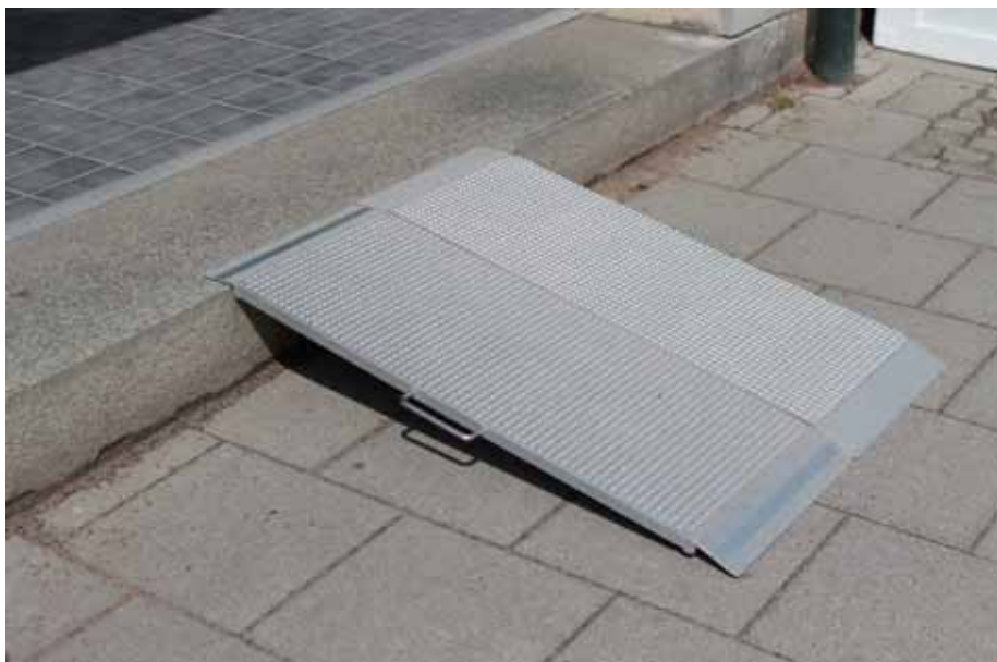
Små hjälpmedel i vardagen har stor betydelse för framkomligheten.

Kalmar län har en stor andel fritidshus och i flera av länets kommuner omvandlas fritidshus till permanentbostäder i betydande omfattning. Eftersom fritidshus inte omfattas av samma krav på tillgänglighet som permanentbostäder kan dessa hus på sikt behöva bostadsanpassningsåtgärder.