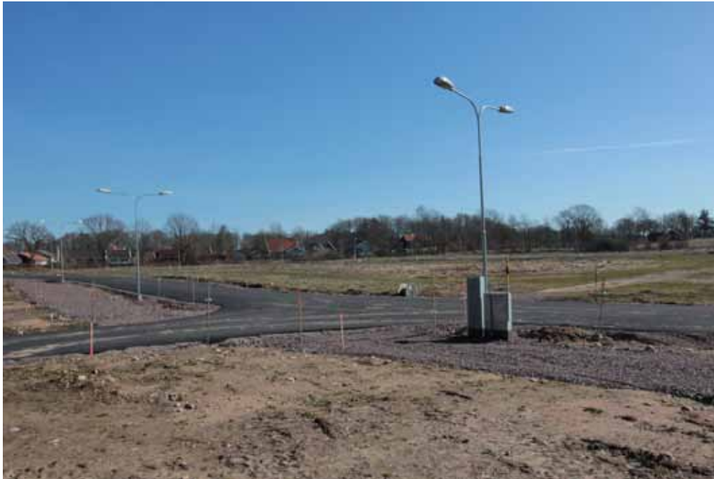
Bygglara tomter på åkermark utanför Läckeby.