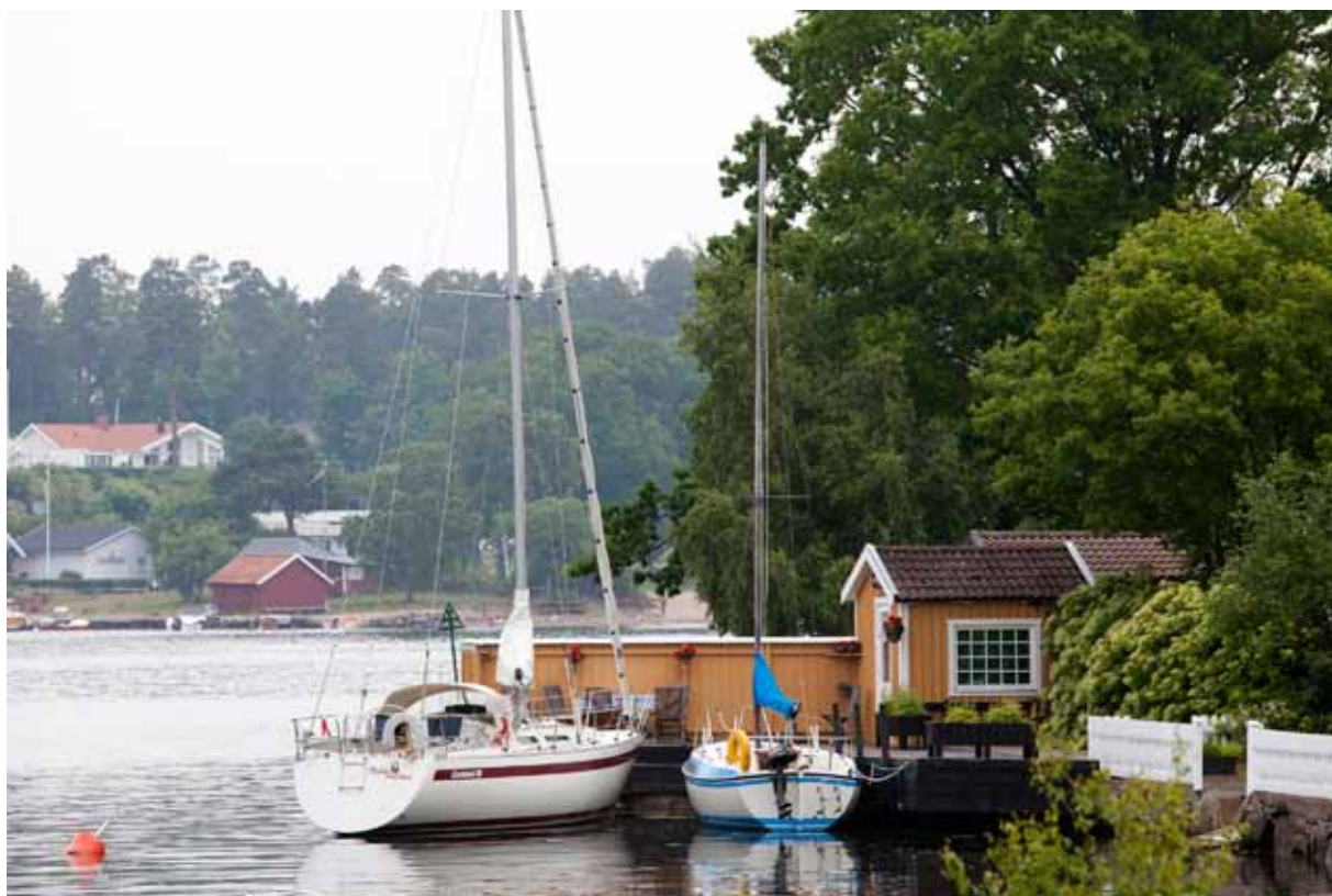
Kalmar län erbjuder goda livsmiljöer nära hav och skog.