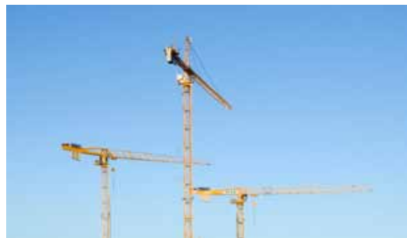
Under år 2014 planeras nybyggnation av 671 bostäder i Kalmar län.

Enligt en undersökning av Regionförbundet i Kalmar län (Lokal uppföljning av ungdomspolitikerna om ungas flyttmönster hösten 2012) är de som flyttar ut från länet unga personer. Endast Kalmar kommun kan uppvisa ett positivt flyttningsnetto för ungdomar, 18-24 år.