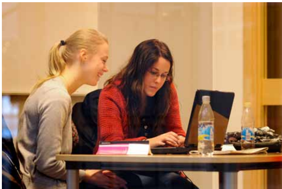
Efterfrågan på studentbostäder är stor i regionen.

Obalansen mellan överskott och brist förklaras inte enbart av att lägenheterna ligger på fel plats. Andra orsaker är exempelvis att de lediga lägenheterna inte motsvarar efterfrågan beträffande storlek och standardkrav. Storleken på de bostäder som efterfrågas för att behålla en balanserad bostadsmarknad hänger samman med upplåtelseformen. För hyresrätter efterfrågas främst ett till tre, för bostadsrätter främst två till fyra och för äganderätt fyra till fem eller större.