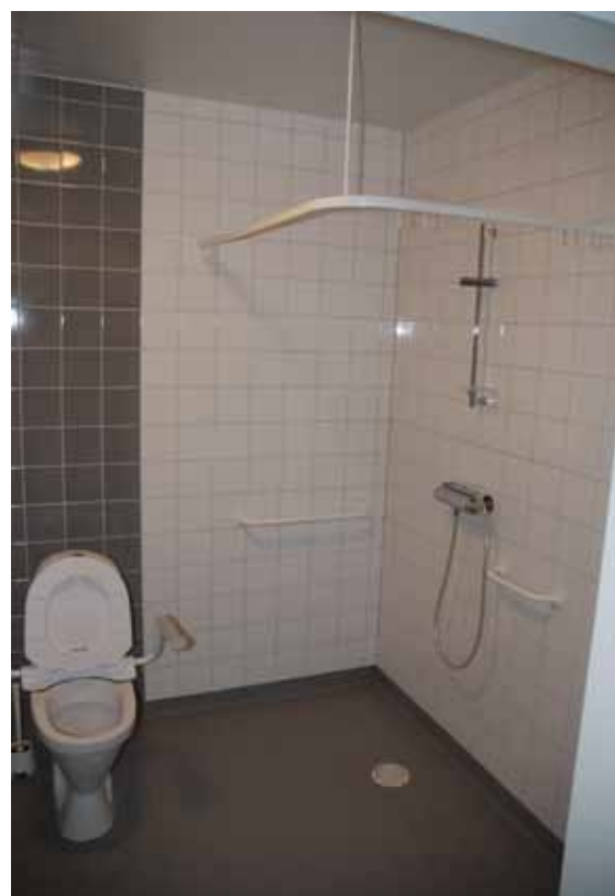
Hygienutrymme anpassat för personer med funktionsnedsättning kan göra det möjligt för flera att bo kvar i hemmet.

I ett län med en åldrande befolkning och ett lågt bostadsbyggande fyller bostadsanpassningsbidraget en mycket viktig funktion. Det är dock inte den äldsta åldersgruppen som beviljas de mest kostnadskrävande åtgärderna. Länets bostadsbidragshandläggare vittnar om att de allra äldsta inte ställer lika höga krav som personer i de yngre åldersgrupperna. I de mindre kommu-