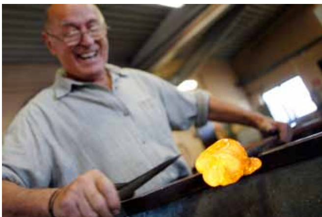
Glasbrukstraditionen utgör en del av Kalmar läns kulturarv.

I Kalmar län finns en lång och stark tradition av såväl små- som storföretagande. Jord- och skogsnäringen samt turismen är näringar av stor betydelse i länet. 2013 var enligt Regionförbundet ett starkt år för besöksnäringen i länet med cirka 9,6 miljoner övernattningar. Omsättningen låg på cirka 3,9 miljarder kronor, inklusive korta dagresor, vilket motsvarar drygt 3400 helårsanställda på helårsbasis. Siffrorna är överlag något lägre än 2012, men då ska betänkas att 2012 var ett rekordår för nästan alla branscher som påverkas av turism.