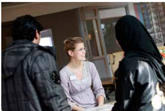
Integration är en viktig fråga att ta hänsyn till i samhällsplaneringens många skeden.

Innan uppehållstillstånd beviljas bor asylsökande på Migrationsverkets anläggningsboende alternativt hos släkt och vänner. Flera turistanläggningar i länet öppnar upp eller har visat intresse för att öppna upp sina anläggningar för asylboende under lågsäsong. Idag (26 maj 2014) finns det 2151 asylsökande personer i länet, varav 1963 bor i anläggningsboende. 638 individer i länet har beviljats uppehållstillstånd men tvingas bo kvar på Migrationsverkets anläggningsboende i väntan på en kommunplacering. En stor del av dem som bor på anläggningsboende behöver också hjälp med bostad efter att uppehållstillstånd har beviljats. Migrationsverket bedömer att allt fler kommer att bo på anläggningsboende under asyltiden, vilket innebär ytterligare ökat behov av anvisningsbara platser i kommunerna.