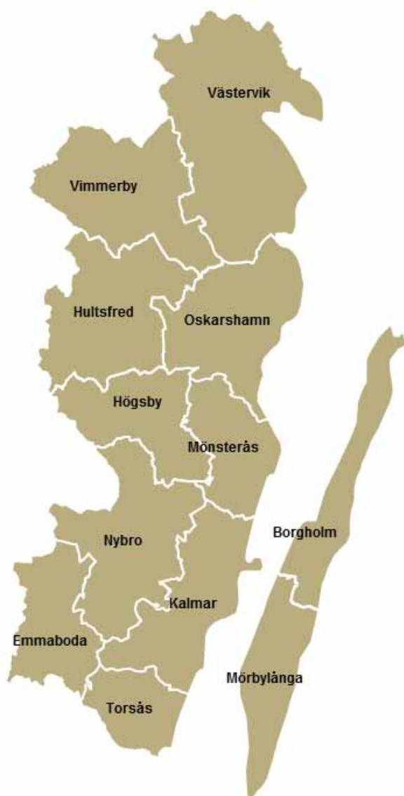
Kalmar län, kommunindelning

Kalmar län ökade under 2013 sin befolkning till 233 874 personer (SCB), vilket är en ökning med 326 personer från 2012. Under 2013 flyttade 2553 personer hit från utlandet. Utan de inflyttade från utlandet skulle länets befolkning minska.