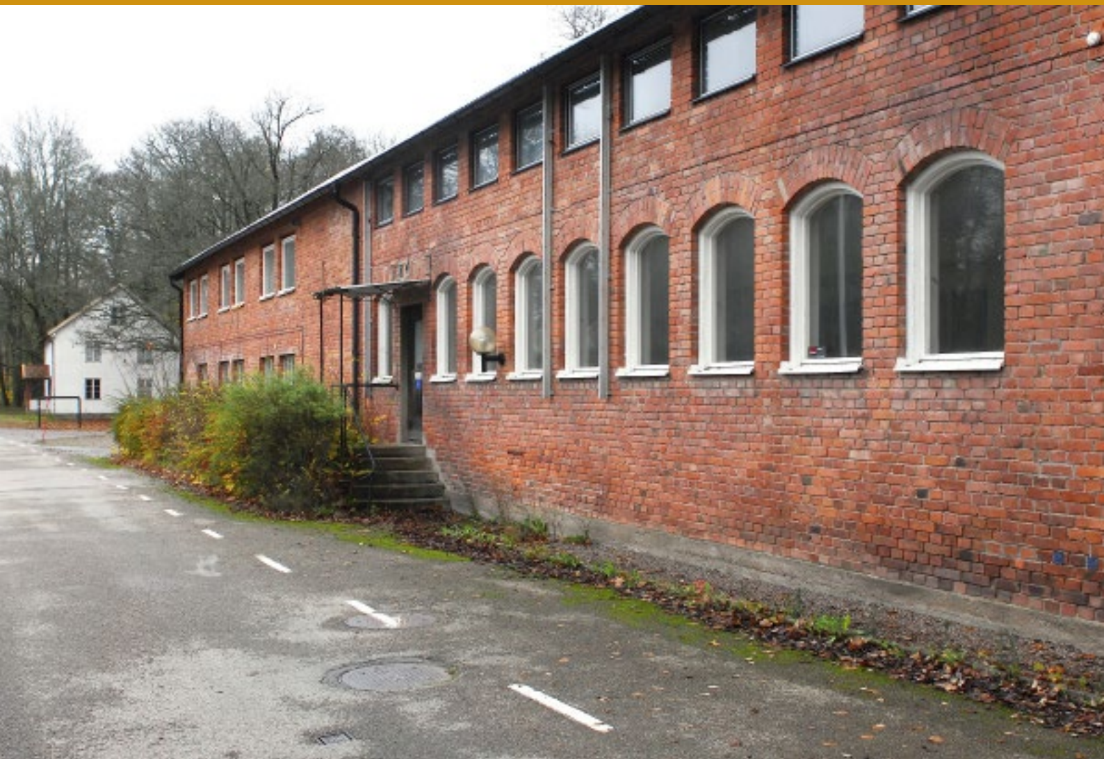
Hyttan ligger längs med Glasbruksvägen.