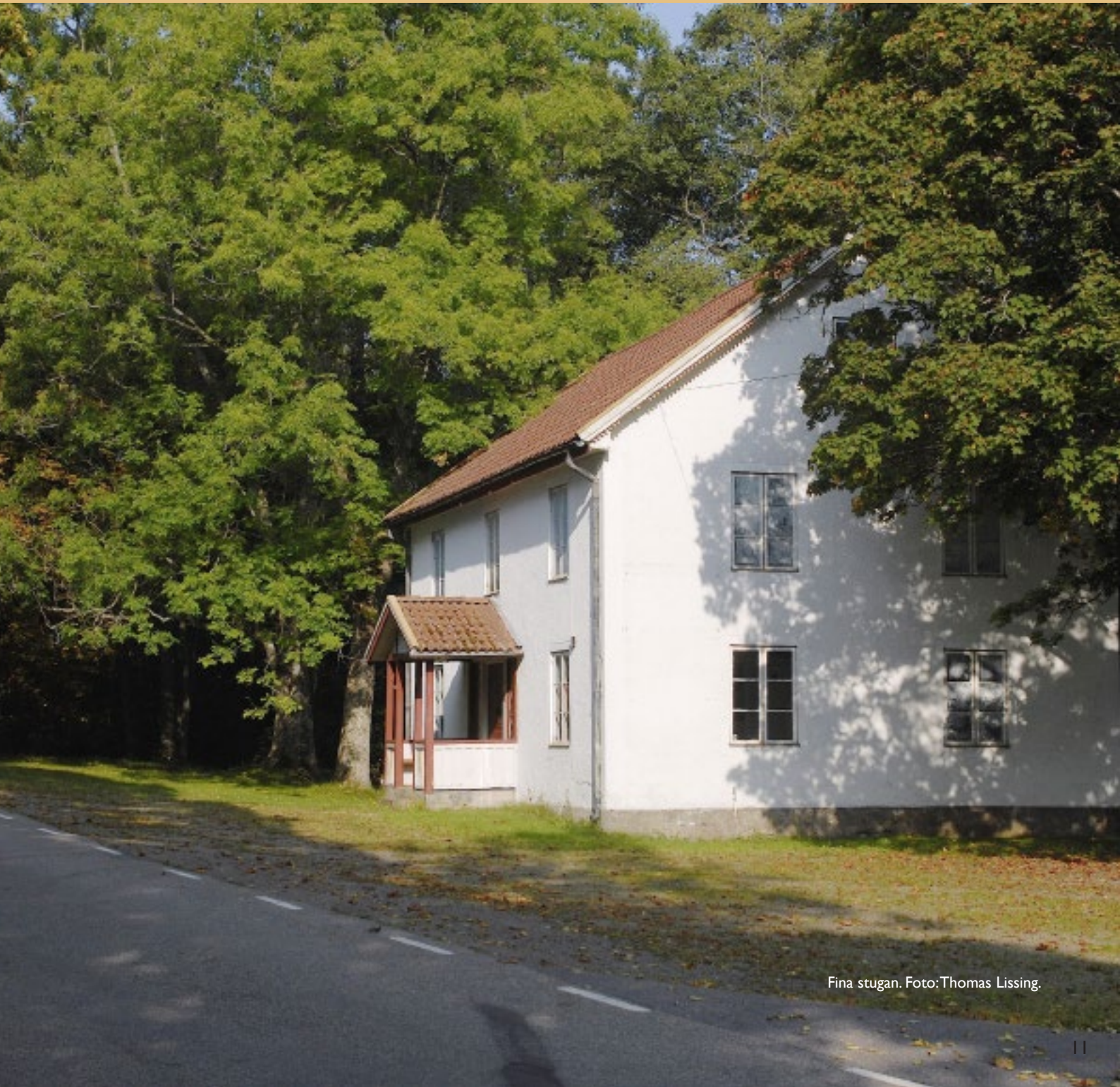
Fina stugan.