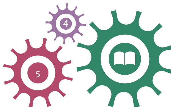
Delmål 3 har tydliga kopplingar till delmål 4 och 5.

Kvinnor och män, flickor och pojkar, ska ha samma möjligheter och villkor när det gäller utbildning, studieval och personlig utveckling.