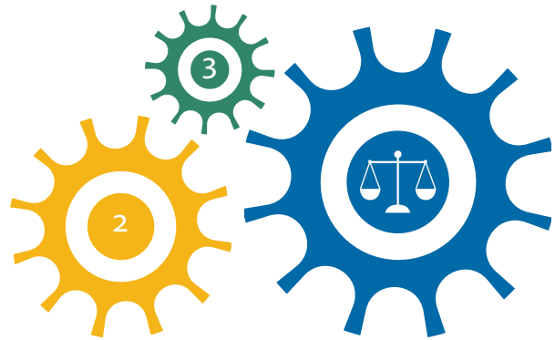
Delmål 1 har tydliga kopplingar till delmål 2 och 3.

Kvinnor och män ska ha samma rätt och möjlighet att vara aktiva medborgare och att forma villkoren för beslutsfattande.