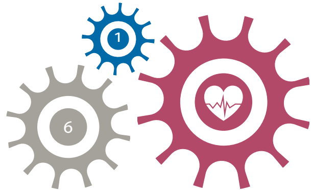
Delmål 5 har tydliga kopplingar till delmål 1 och 6.

Kvinnor och män, flickor och pojkar ska ha samma förutsättningar för en god hälsa samt erbjudas vård och omsorg på lika villkor.