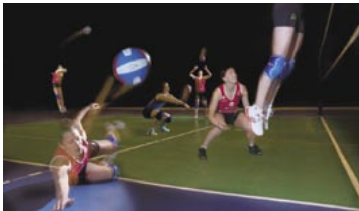
Örebro Volley ur almanackan Elit & Energi.

Kontakta Ingela Pihl om du vill beställa almanackor till ditt företag. Tfn: 019-19 35 47 eller e-post: ingela.pihl@t.lst.se