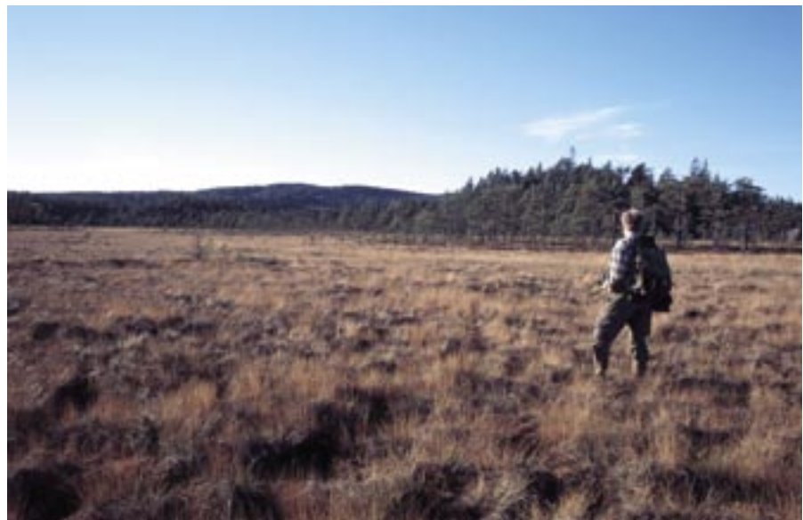
Vy över Komoramossen.