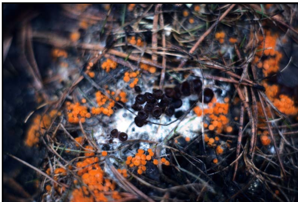
Orange älglegeskal Byssonectria terrestris och mörk älglegeskal Nannfeldtiella guldeniae vid Finnafallsmossen i Viby socken.

Byssonectria terrestris (Alb. & Schwein.: Fr.) Pfister, orange legeskål. Bo Kårtorpa floar 342/784 ungtallskog, på älgspilling 20.IV.1979 conf. SR. Glanshammar Skumparberget 843/757 barrskog, älgspilling 17.IV.1982 conf. SR. Hammar Bernströmstorpet 293/559 barrskog, älgspilling 1.V.1980 conf. SR. Lerbäck Hylletorp 398/557 tallskog, älgspilling 2.V.1980 conf. SR. Åsbrohammar 407/563 barrskog, älgspilling 13.V.1979 conf. SR. Ödeskärr 392/548 limstensbrott, älgspilling 3.V.1980 conf. SR. Ödeskärr 389/550 barrskog, älgspilling 3.V.1980 conf. SR. Ramundeboda Gillersmossen 436/273 ungtallskog, älgspilling 19.IV.1979 YS $ conf. SR. Trollåsmossen 414/272 ungtallskog, älgspilling 19.IV.1979 YS $ conf. SR. Rinkaby Kilbergsmossen 811/717 barrskog, älgspilling 17.IV.1982 conf. SR. Viby Finnafallsmossen 404/390 ungtallskog, älgspilling 21.IV.1979 conf. SR.