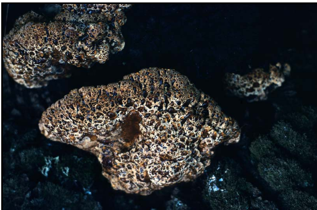
Tårticka Inonotus dryadeus vid Bystad i Askers socken.

H. salmonicolor (Berk. & M.A.Curtis) Pouzar, laxticka. "VU" 10/9 Askersund Tasstorp 517/513 hällmark, tallstam 6.VIII.1998. Axberg Arrud 879/694 tallskog, tallåga 8.IX.1991 LC $ conf. DO. Hallsberg Stenkulla 467/596 hygge, murken tallåga 16.I.1992. Lerbäck Ångermanland 353/538 bergbrant, tallåga 12.V.1994. Åsbrohammar 408/562 hällmark, tallstock 6.X.1985 det. LR. Lillkyrka Lillkyrka 785/810 blandskog, tallåga 25.III.1996. Knista Villingsberg, 1968 HC (Carlstedt 1985: 6). Rinkaby Myrö 749/714 gammal hagmark, på grov murken asplåga 28.IX.1996 det. LR (O). Sköllersta Folkasbo 500/743 hygge, murken tallstock 6.X.1986 conf. LR (O). Svennevad Mamsellbergen 422/798 barrskog, murken tallåga 26.IX.1994. Heterobasidion annosum (Fr.) Bref., rotticka. 158/20 Hallsberg Kårstahult 500/586 granskog, gran 8.I.1981 conf. SR. Ulvsätter 499/575 blandskog, gran 25.X.1979 conf. SR. Hammar Dalmark 104/526 barrskog, gran 2.IX.1979 conf. SR. Lerbäck Håkantorp 262/616 gammalt gruvområde, på sälglåga 8.VI.1987 conf. TS. Inonotus dryadeus (Fr.) Murr., tårticka. "EN" 1/1 Asker Bystad 478/823 ädellövskog, vid bas stor ek 30.VII.1979 conf. SS (GB), även 14.IX.1995 TA, OG & $.