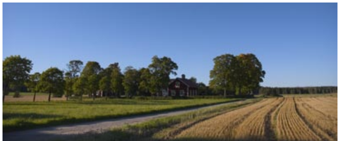
Foto: Ulla-Carin Ekblom (föreläsning), Carina Remröd (taxi, landsbygd) och Mats Grimfoot (fisktärnor).