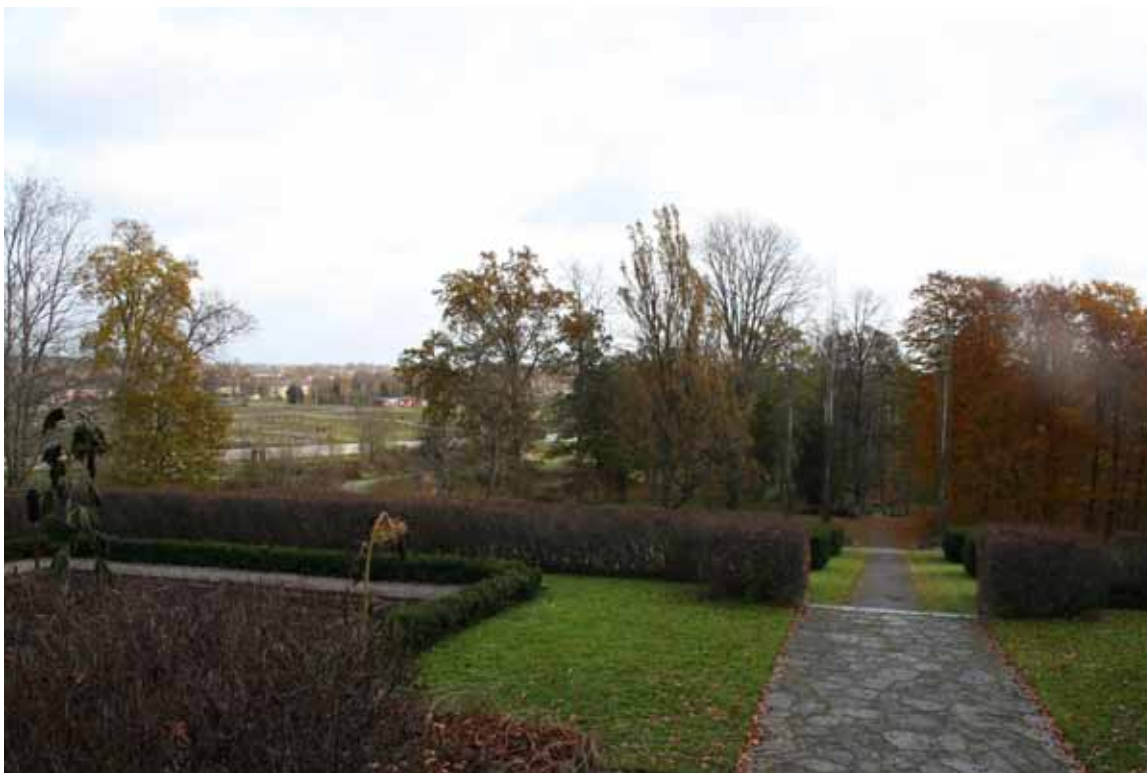
Karlslunds herrgårdslandskap är en viktig del av Örebros grönsstruktur. Parker och trädgårdar fungerar som mötesplatser för folklivet.

De äldsta trädgårdsodlingarna går tillbaka till Karlslunds tid som kungsladugård. Trädgårdarna producerade då nyttoväxter som bidrog till att försörja Örebro slott med livsmedel. De tidiga trädgårdarna hade geometriskt formade odlingskvarter och raka gångar.