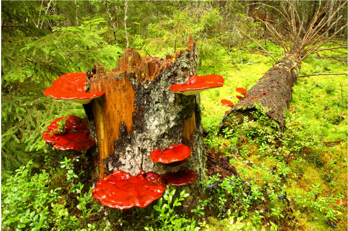
Ganoderma lucidum , lackticka. Askersund, Dohnafors. 22 september 2008.