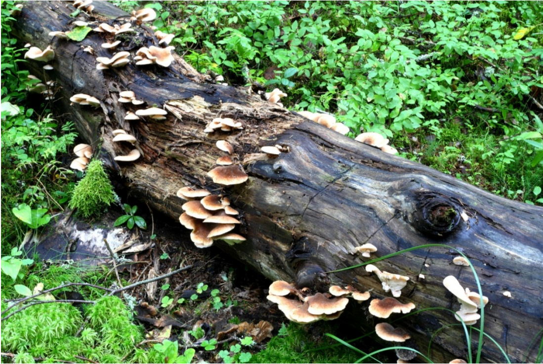
Lentinellus castoreus , bävermussling. Hammar Orkarebäcken. 30 augusti 2010.