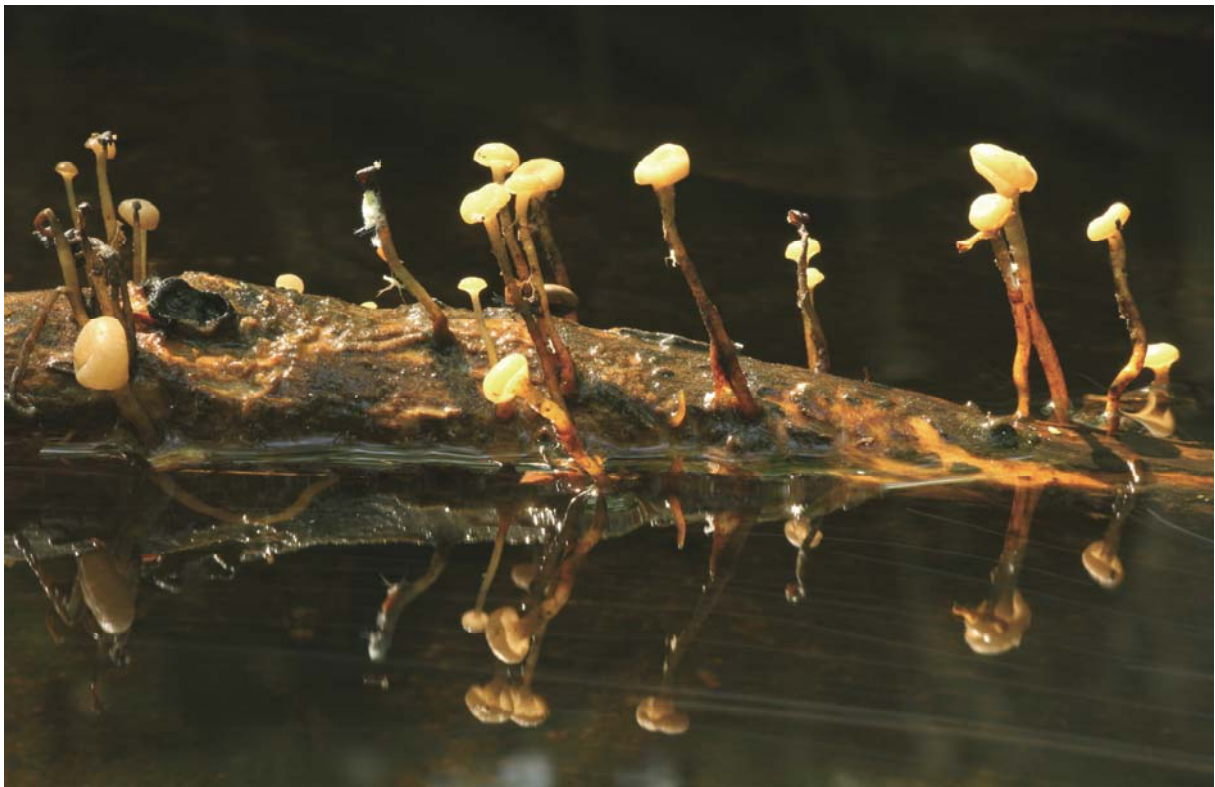
Cudoniella clavus , bäckspik. Lerbäck, Svaldre. 7 juni 2008.