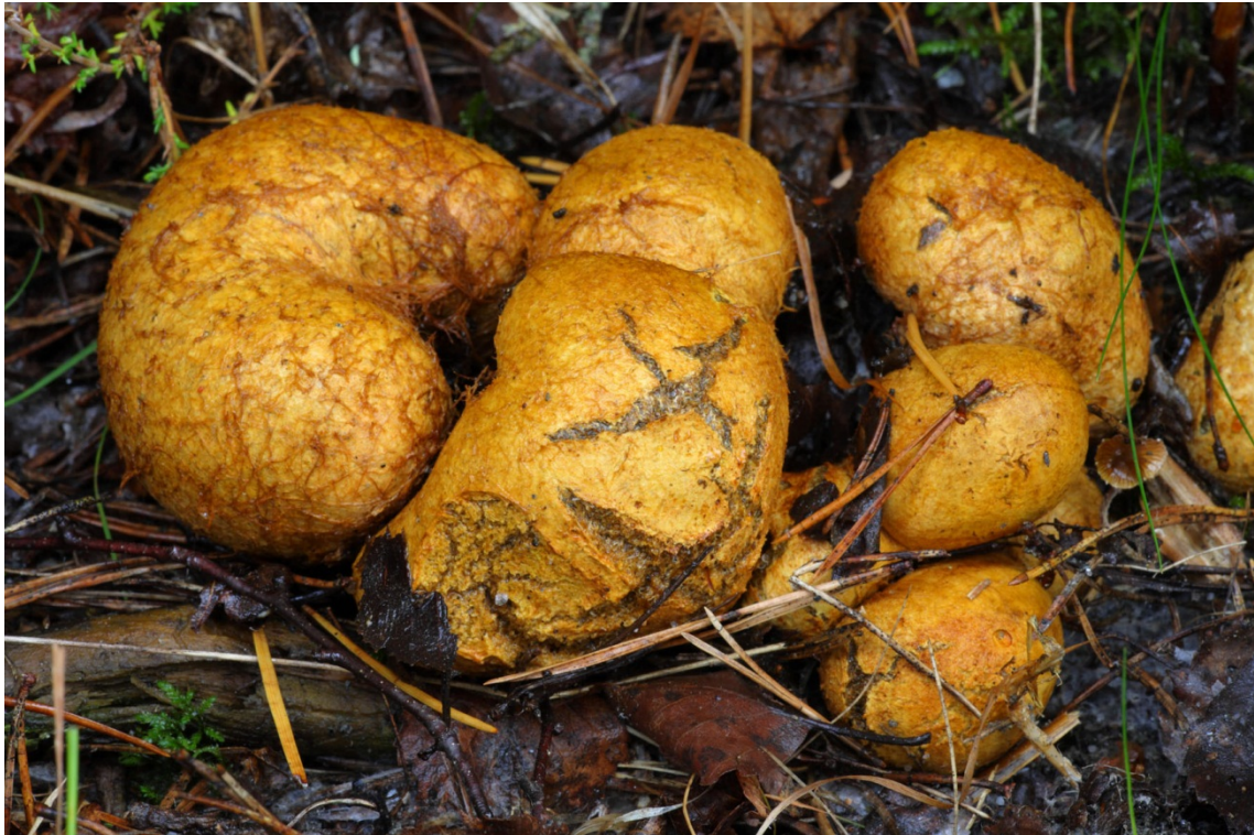
Rhizopogon luteolus , gulbrun hartryffel. Askersund, Fagertärn. 18 september 2010.