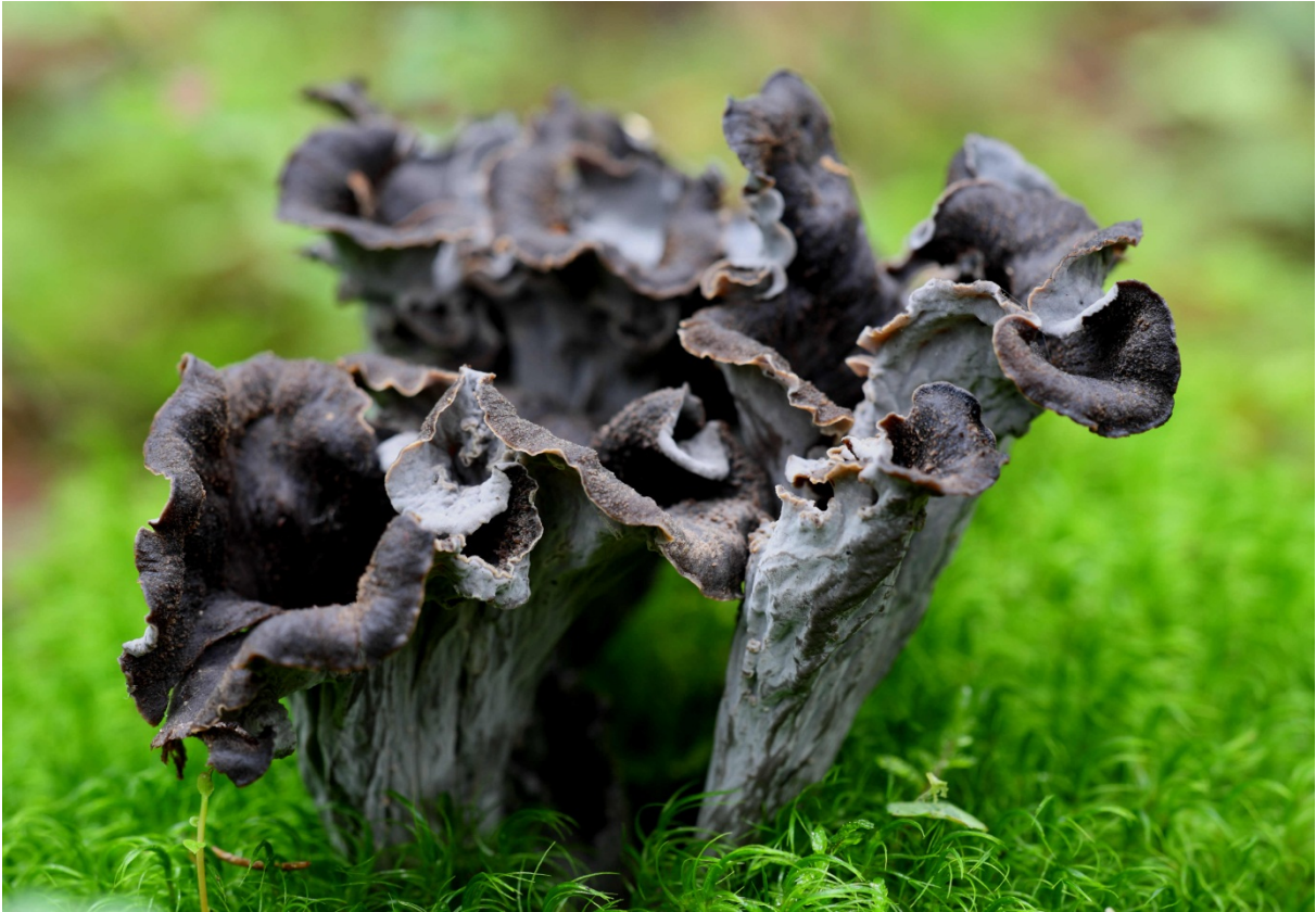
Craterellus cornucopioides , svart trumpetsvamp. Askersund, Dohnafors. 22 september 2008.