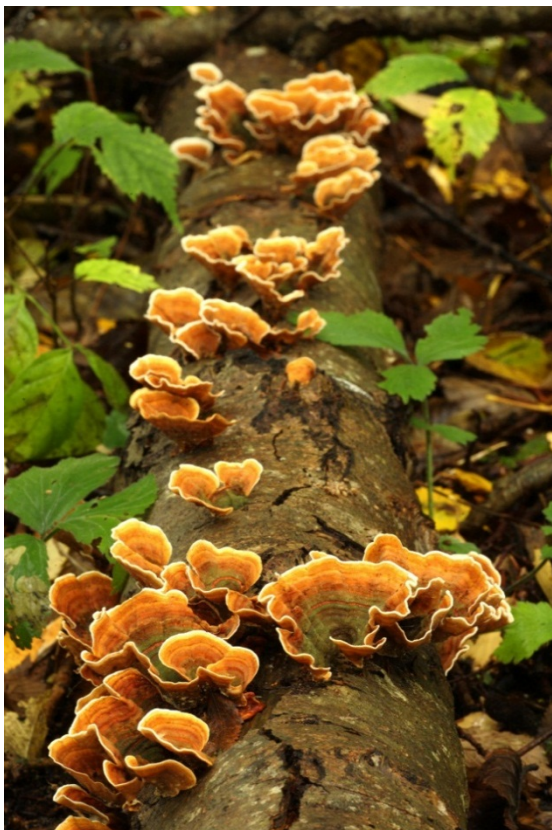
Stereum subtomentosum , sammetskinn. Askersund, Dohnafors. 22 september 2008.