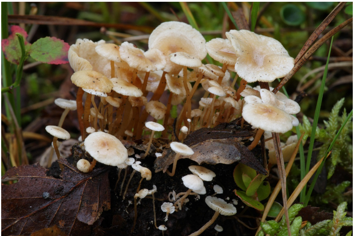
Collybia cookei , gulknölig nagelskivling. Askersund, Fagertärn. 18 oktober 2010.