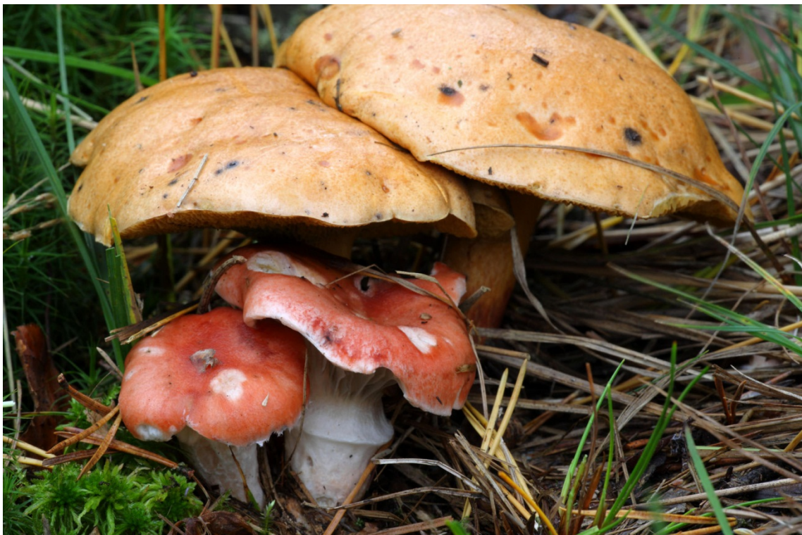
Gomphidius roseus , rosenslemskivling, tillsammans med Suillus bovinus , örsopp. Askersund, Fagertärn. 18 september 2010.