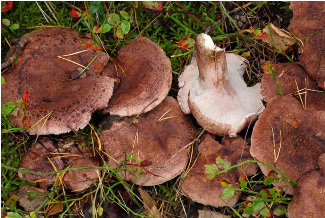
Sarcodon fennicus , bitter taggsvamp. Askersund, Fagertärn. 18 september 2010.