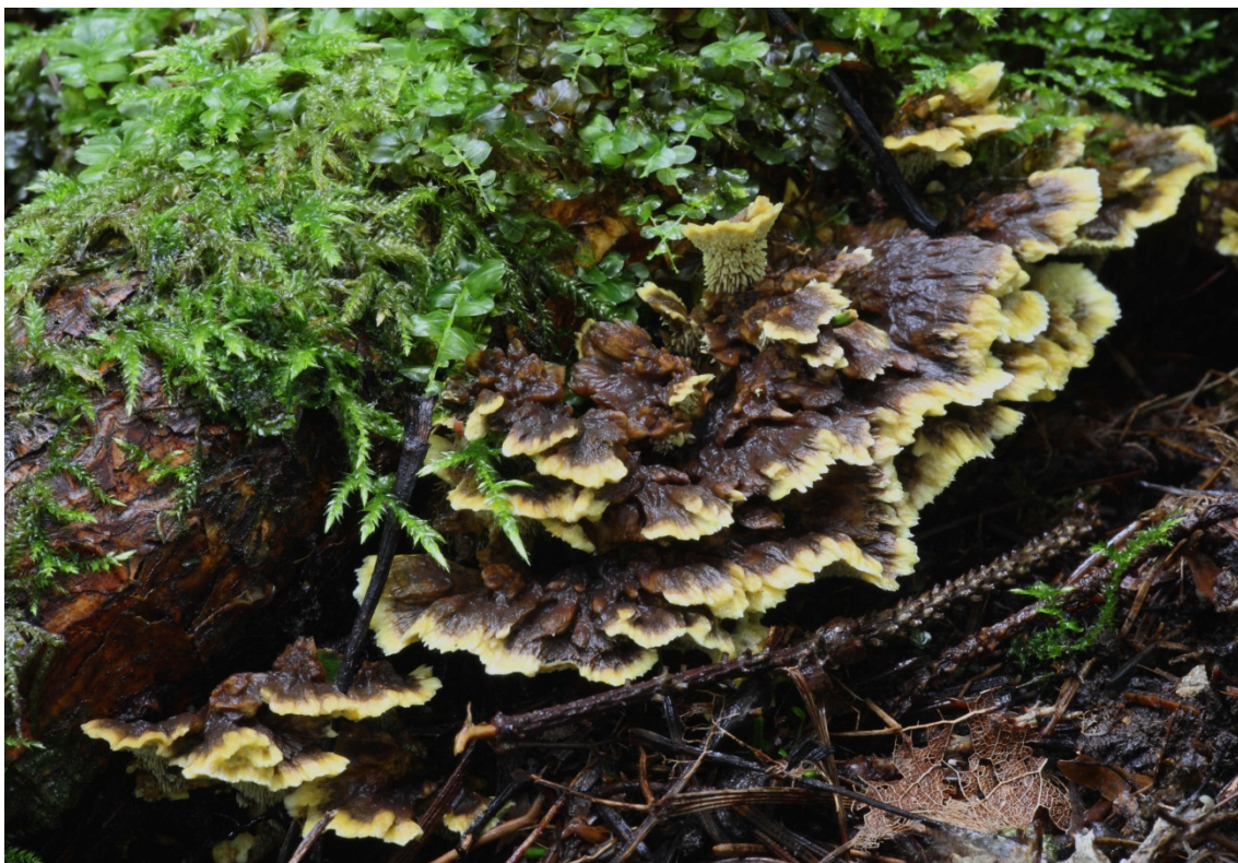
Hydnellum geogenium , gul taggsvamp. Lerbäck, Orkarebäcken. 30 augusti 2010.