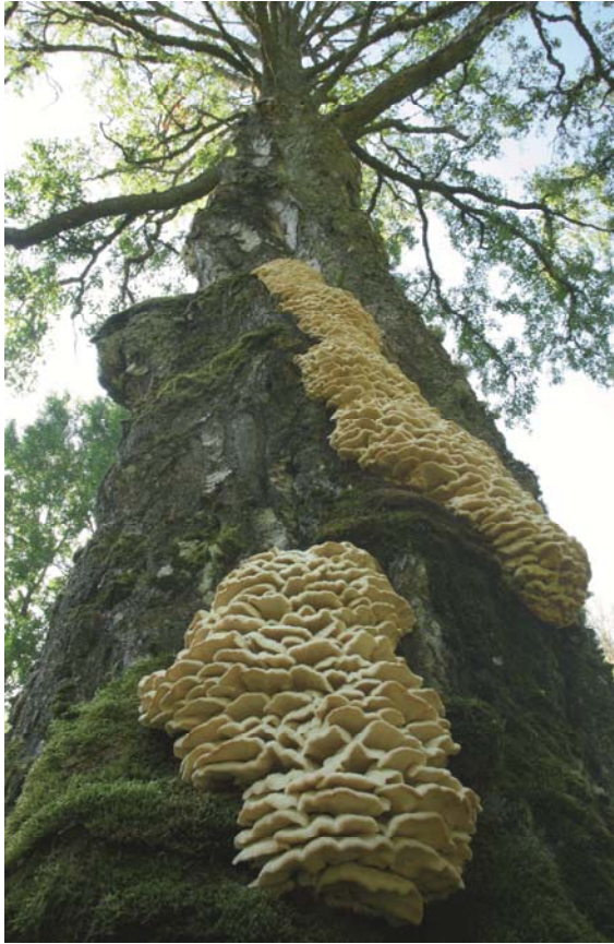
Climacodon septentrionalis , grentaggsvamp. Asker, Sofielund. 31 oktober 2009.