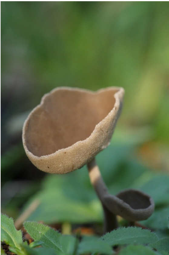
Helvella bulbosa , luden skålmurkla. Lerbäck, Stora Joxtorp. 7 september 2007.