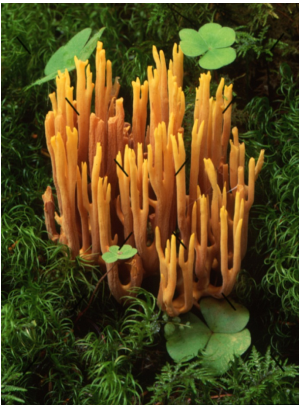
Ramaria testaceoflava , gultoppig fingersvamp. Lerbäck, Orkarebäcken. 30 augusti 2010.