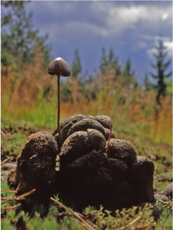
Panaeolus alcis , älgbroking. Hammar, Svarthytteskogen. 21 september 1991.