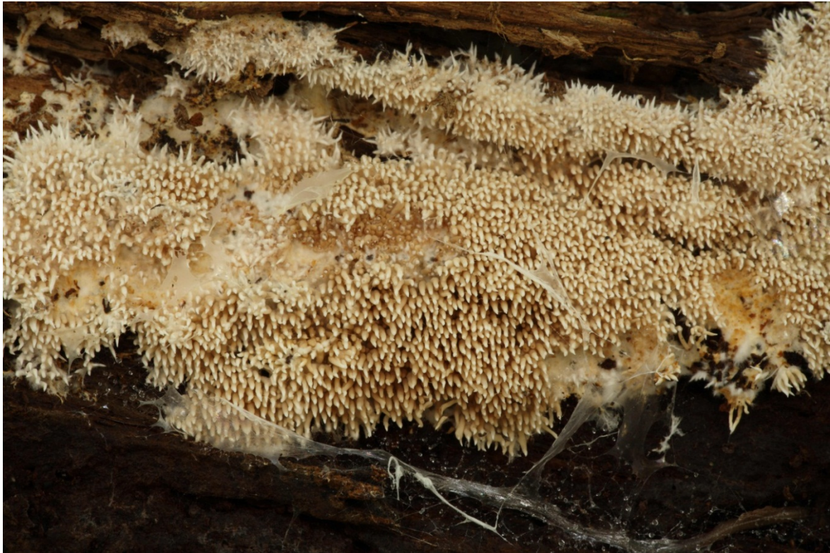
Hydnocristella himantia , narrtaggig. Götlunda, Södra Hammaren. 28 september 2007.