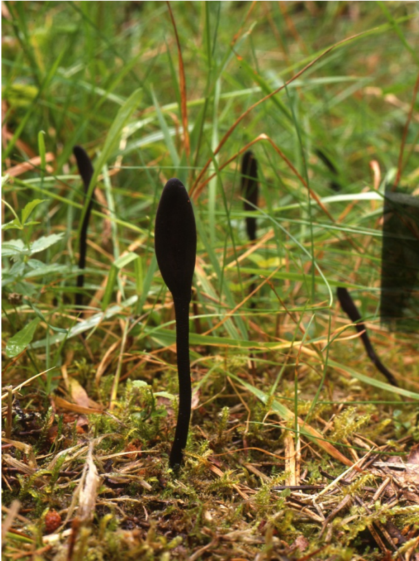
Trichoglossum hirsutum , hårig jordtunga. Hammar, Svarthytteskogen. 21 september 1991.