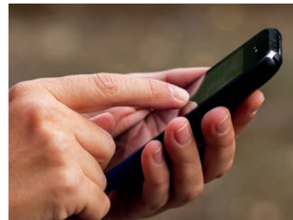
Ring 010-224 86 40 vid angrepp.

Om besiktningen visar att skadan orsakats av rovdjur kan djurägaren få ersättning för skadade eller döda djur. Besiktningen kostar inte djurägaren någonting.