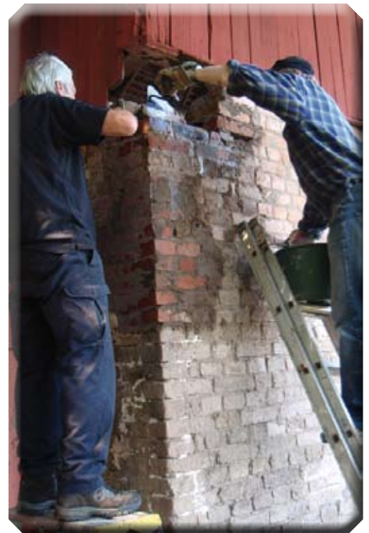
4. Det är svårt att komma åt längst upp – de allra sista stenarna får läggas på plats inifrån loftet.