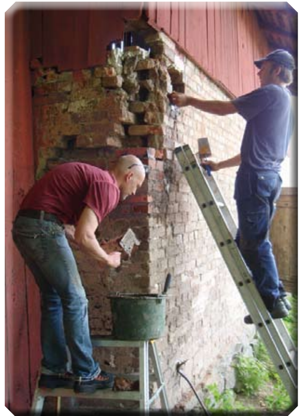
3. Hörnet börjar ta form.