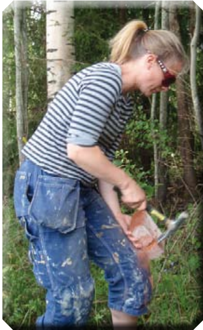
2. Tegelstenarna huggs till lämplig storlek.