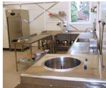
Här görs glassen.