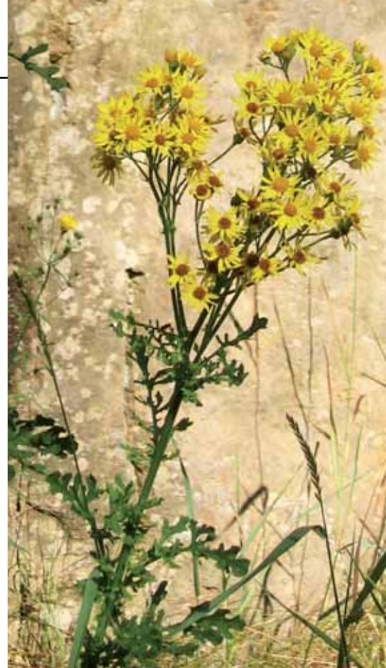
Blomman hos stånds är betydligt större än hos korsörterna. Bladen har precis som korsört flikiga blad, till skillnad från slättergubbe och gullris.

Stånds hör till familjen korgblommiga växter och trivs på sandig, grusig gräsmark, i vägkanter, skogsbryn och torrbackar, ofta på kulturmark. Den blommar i juli-augusti med gula, täta, kvastliknande blomsamlingar i stjälktoppen. De mörkgröna bladen är upprepat parflikiga med korta trubbiga flikar.