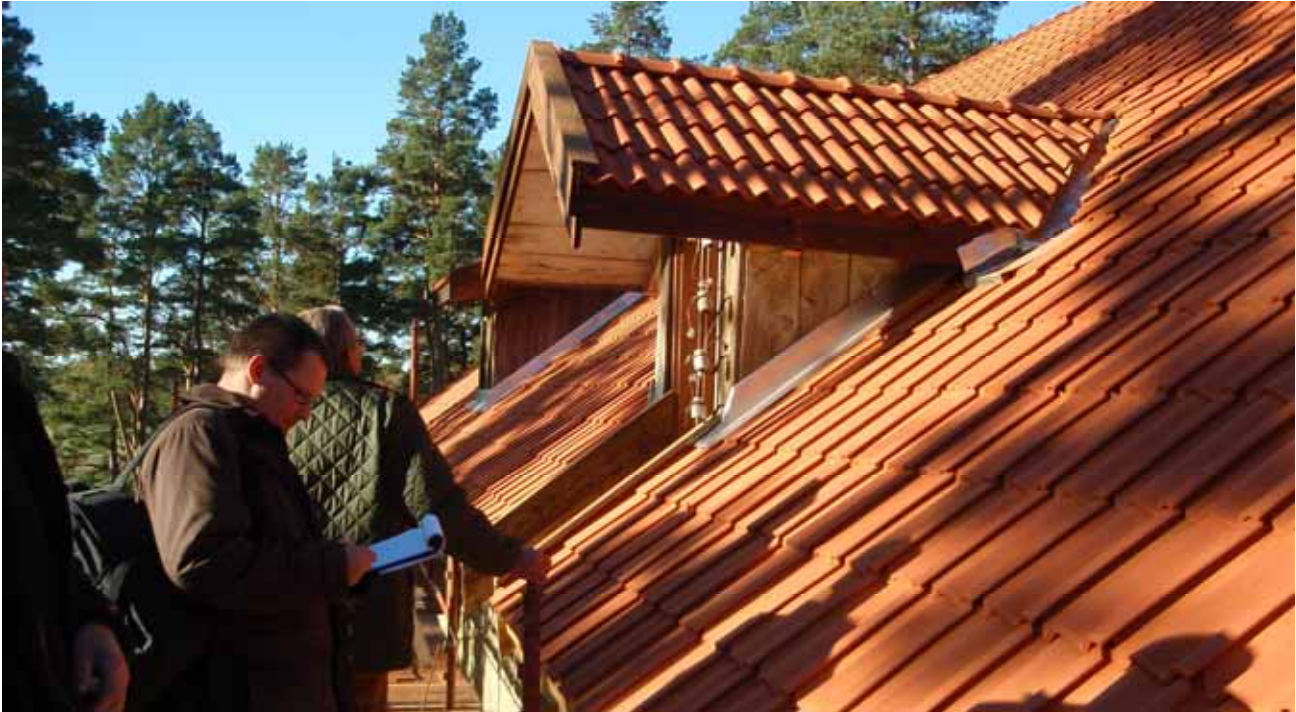
Nylagt tak på rian (sådestorcken) vid Värmlands Säby, Visnum.