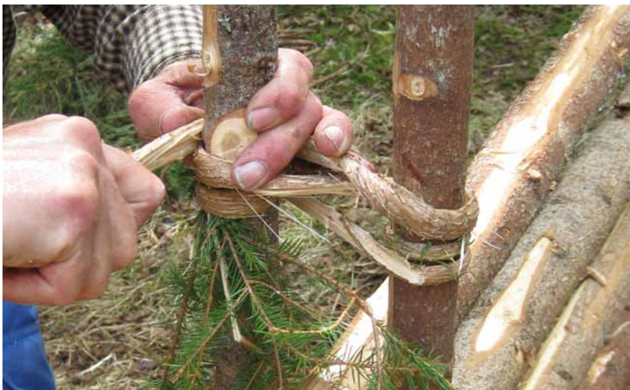
Intresset för insatsen återuppbyggnad av trögärdesgård är fortsatt förhållandevis stort.

Ett av projekten är en andra etapp av ett arbete som påbörjades 2009.