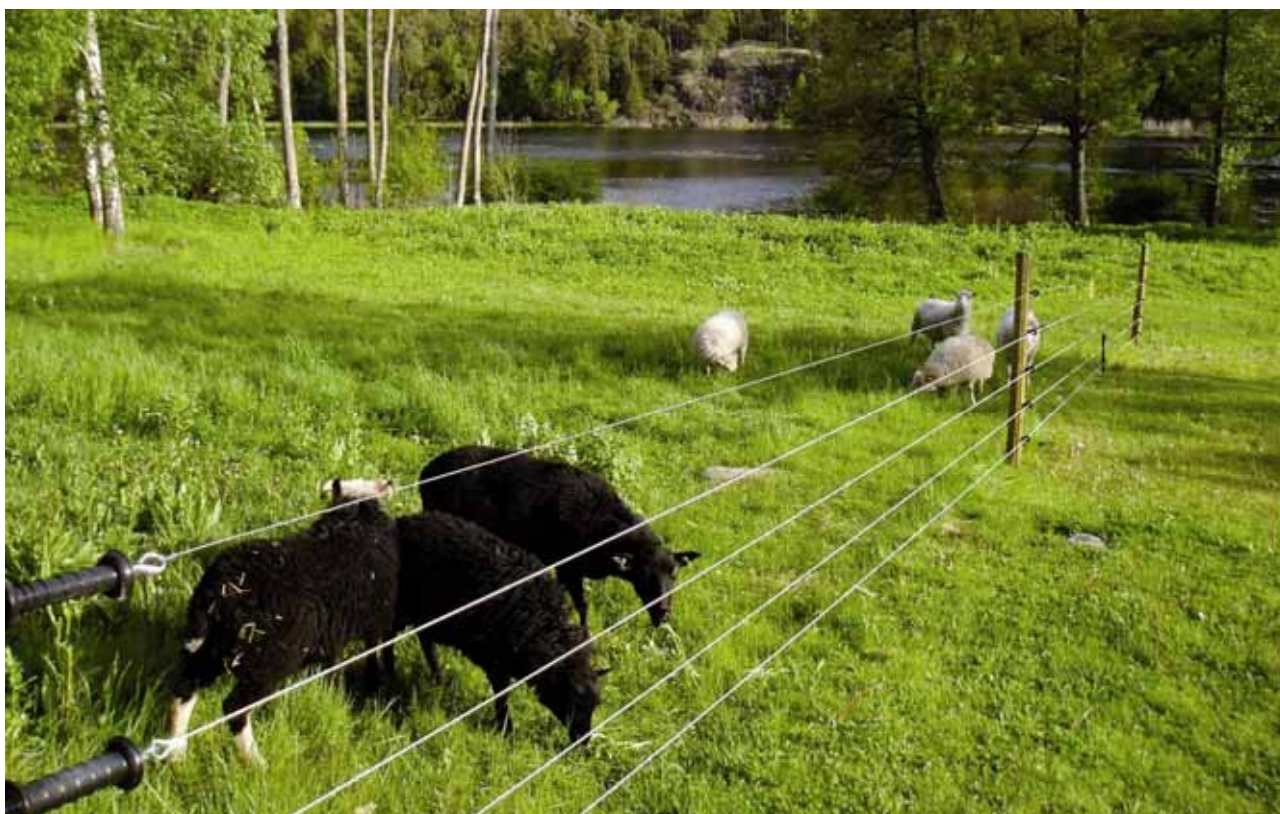
Under 2010 har stöd beviljats till drygt 25 000 m stängsel mot rovdjur.

15 av 17 inkomna ansökningar beviljades. Det totala beviljade stödbeloppet uppgick till 507 720 :-