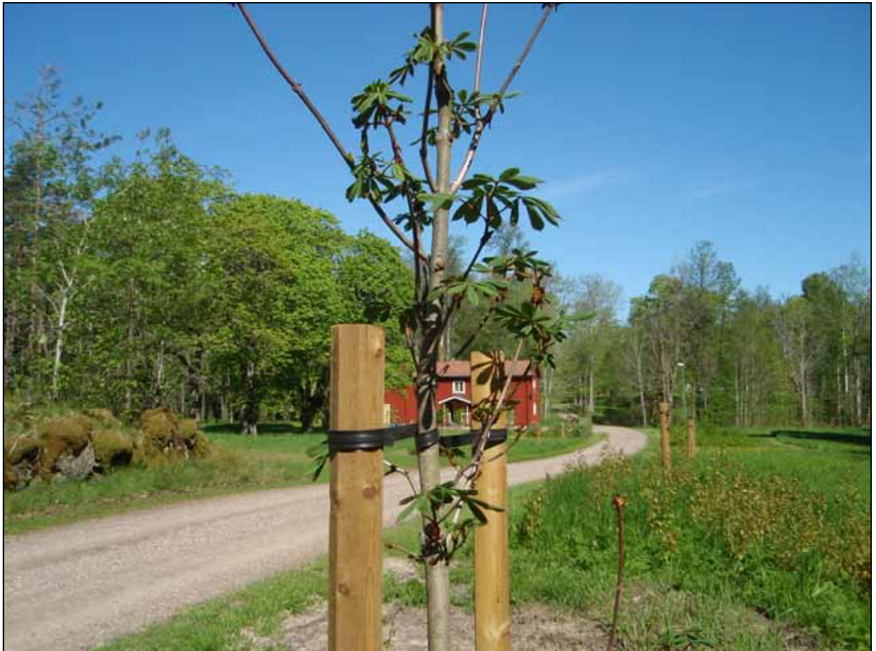
Återplanterade alléträd vid Jonsbols gård, Krisinehamn.

Projektet omfattade återplantering av 51 stycken alléträd fördelat på 3 olika alléer. En av dessa ligger i anslutning till Rämens herrgård, som är byggnadsminne. En annan ligger i anslutning till mark som beviljats stöd till restaurering av betesmark.