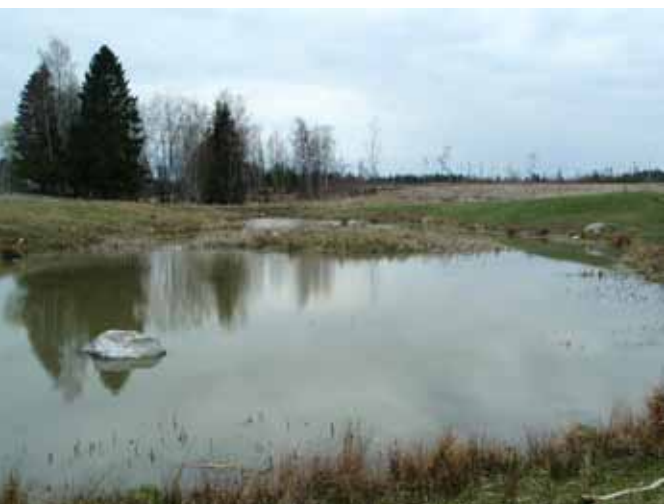
Våtmark för rening av näringsrikt vatten, Västra Götaland.