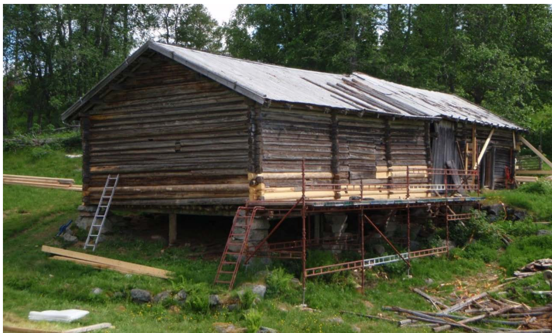
Timmerlagning år 2010 på uthus vid Ritamäki finngård, Lekvattnets socken, Torsby kommun.