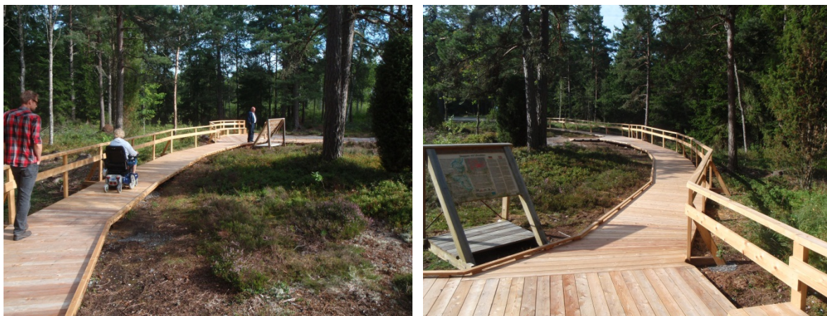
Tillgänglighetsanpassning vid fornlämningsområdet Ulvudden 2009 på fastigheten Rosenborg 1:30, i Säffle kommun.

Bidrag kan även i vissa fall ges till arkeologiska undersökningar vid bostadsbyggande i äldre stadskärnor samt vid mindre arbetsföretag. Möjligheterna till sådana bidrag är dock starkt begränsade.