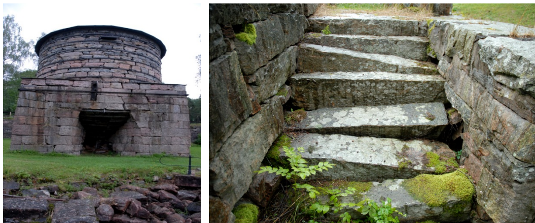
Skadade murverk vid Borgviks hyttruin, Borgviks socken, Grums kommun.

När det gäller kunskapsunderlag får bidrag lämnas både till att ta fram underlag, som är nödvändiga för att genomföra vårdinsatser på objekt som faller in under värdefulla kulturmiljöer, och till att ta fram generella eller riktade regionala och kommunala kunskapsunderlag, som syftar till att ta till vara kulturhistoriska värden i samhällsplaneringen.