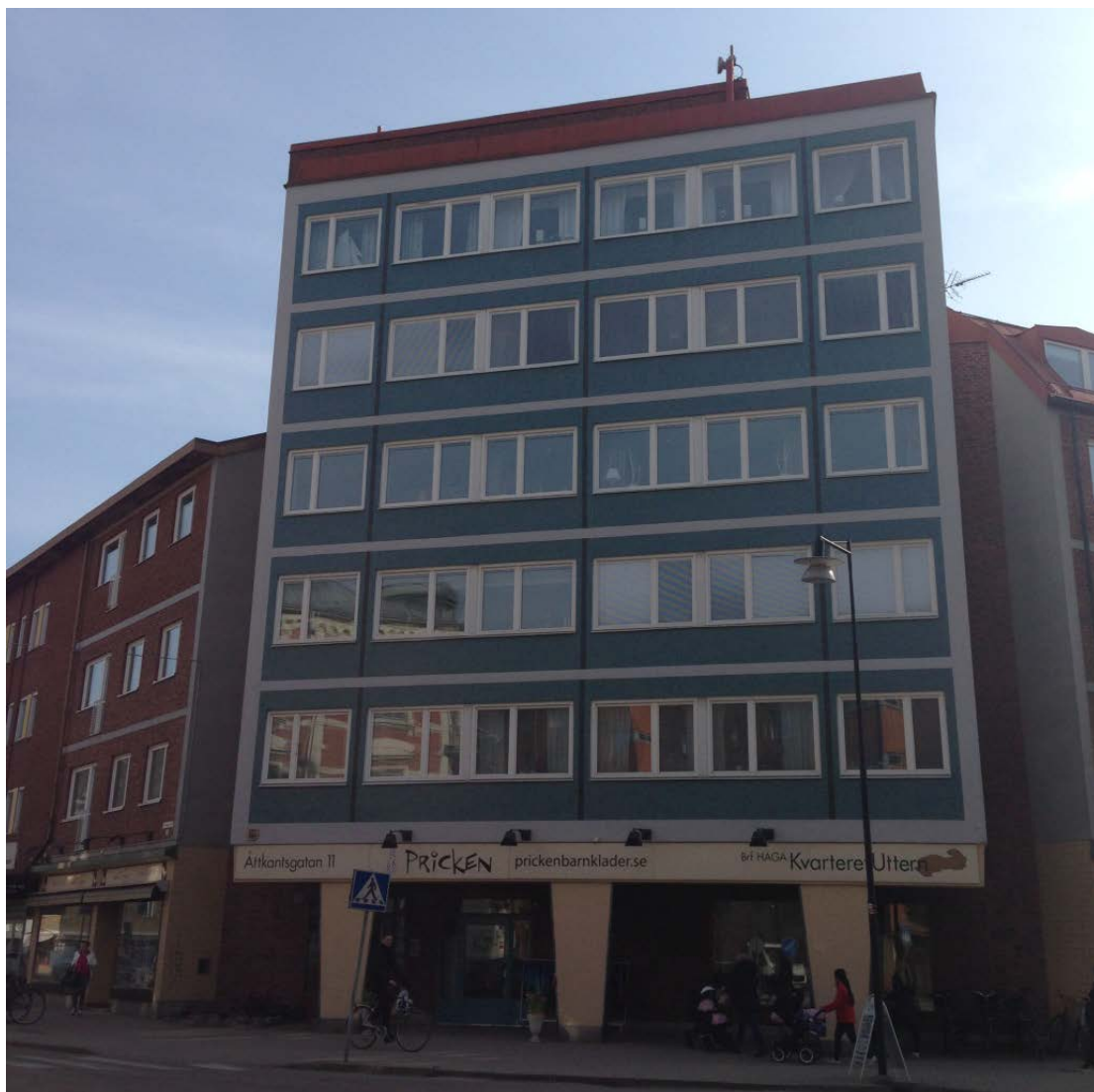
Mosaikfasad vid Åttkantsgatan 11, kv Uttern 20 i Haga, Karlstads tätort och kommun.