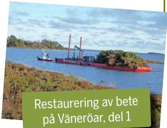
Restaurering av bete på Väneröar, del 1