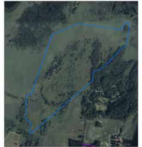
Nolgårdsvikens utveckling under 50 år. Ekonomisk karta från 1960-talet till vänster, flygfoto från 1994 i mitten och flygfoto från 2014 till höger. På 1960-talet var det blåmarkerade restaureringsområdet i stort sett hela öppet, men har sedan vuxit igen mer och mer.

Här syns en av de ko-broar som anlagts för att underlätta bete och övrig skötsel av betesmarkerna.