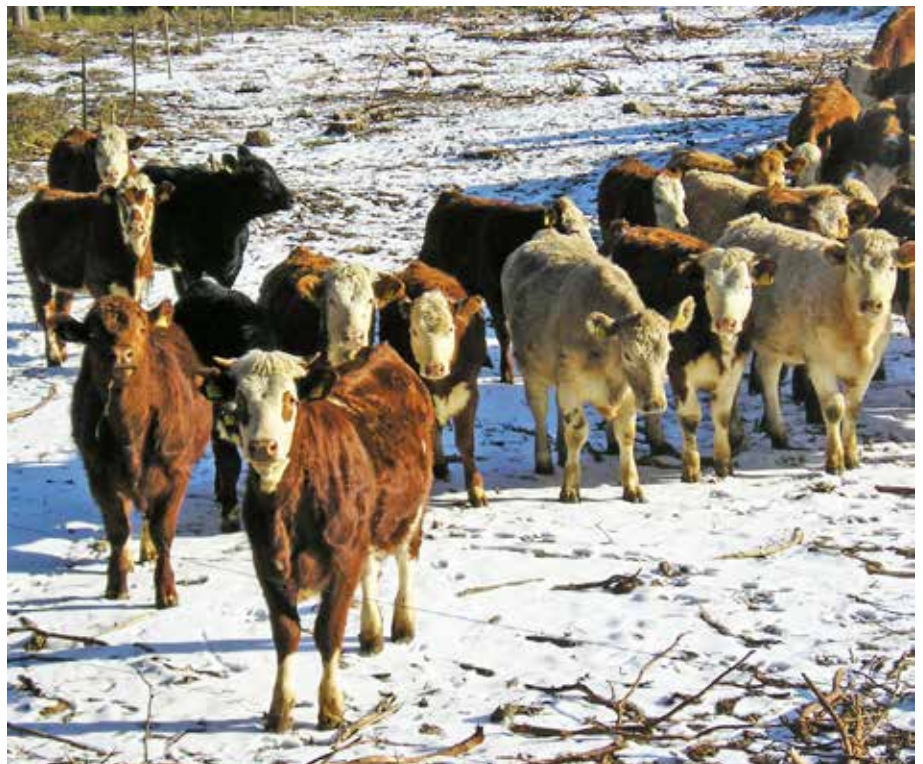
Kvigor i grupp, sorterade efter storlek och ålder