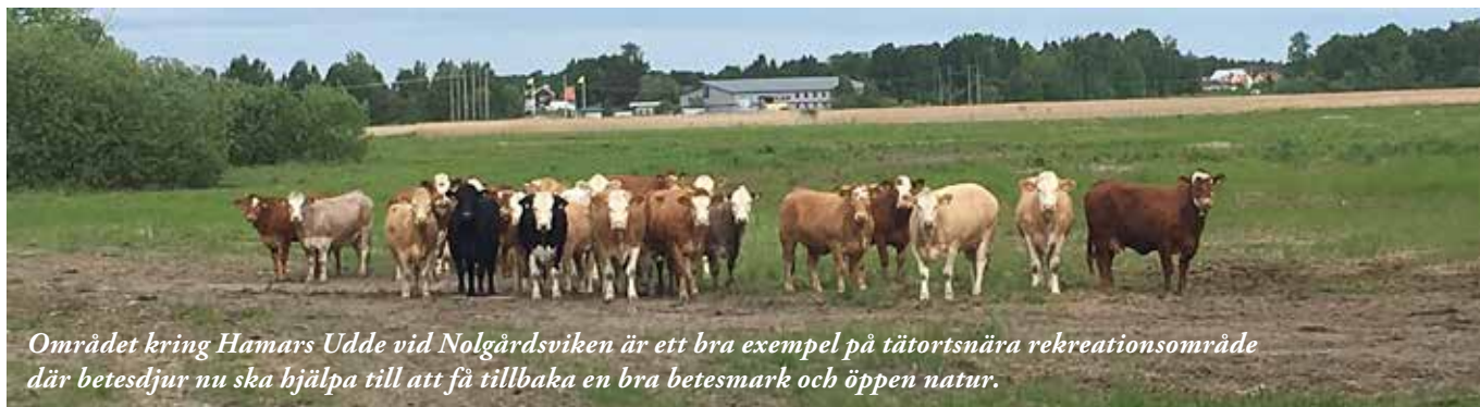
Området kring Hamars Udde vid Nolgårdsviken är ett bra exempel på tätortsnära rekreationsområde där betesdjur nu ska hjälpa till att få tillbaka en bra betesmark och öppen natur.

Klarälvsdeltat är Sveriges idag största aktiva floddelta söder om fjälltrakterna och rymmer på sina 746 hektar flera olika habitat. En stor yta av deltat täcks av träsk och våtmarker, vilka tidigare använts som betes- och slättermark.