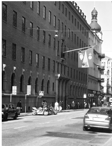
Öppet Hus på Länsstyrelsen

Eftersom inga informationsträffar kommer att hållas i länet, kommer Länsstyrelsen att ha Öppet Hus under de två sista veckorna innan SAM 2004 skall lämnas in. Öppetdagarna i lokalerna på Hantverkargatan 29 i Stockholm kommer att vara den 15-19 mars och den 22-25 mars kl 8.00-16.30. Det är då möjligt att få en översiktlig kontroll av att kryssen är rätt i ansökan innan den lämnas in.