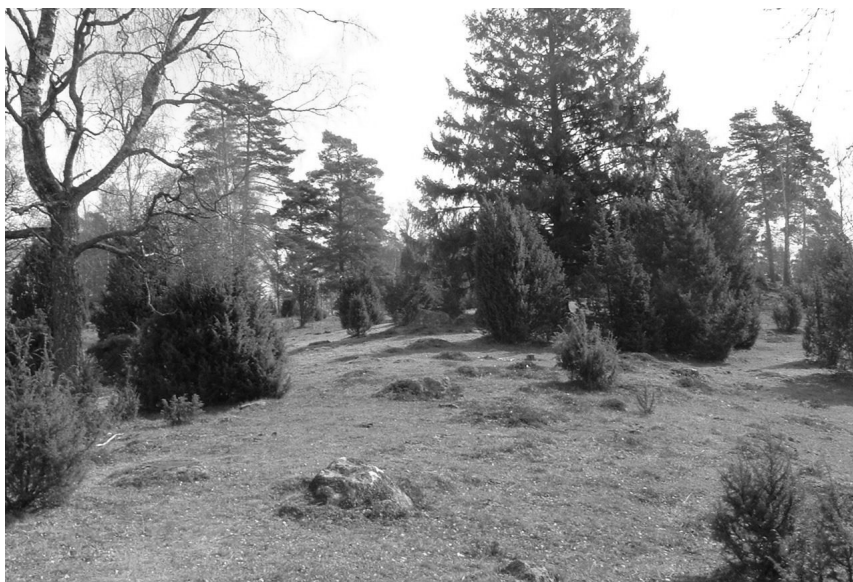
Går köttproduktion att förena med naturbeten?

malt och förvuxet. En stut på 300 kg som går på ett förvuxet bete som innehåller 8 MJ/kg ts kan konsumera 5,5 kg/dag. Gräset är grovt och tar mer plats i vommen där det också tar längre tid att bryta ner p g a det höga fiberinnehållet. Tillväxten blir 300 g per dag. En motsvarande stut på ett nytt bete som innehåller 11 MJ/kg ts kan konsumera 6,5 kg ts per dag. Tillväxten blir 950 g/dag. Genom att växla fällor och ha koll på betetrycket går det att förena köttproduktion med naturbeten.