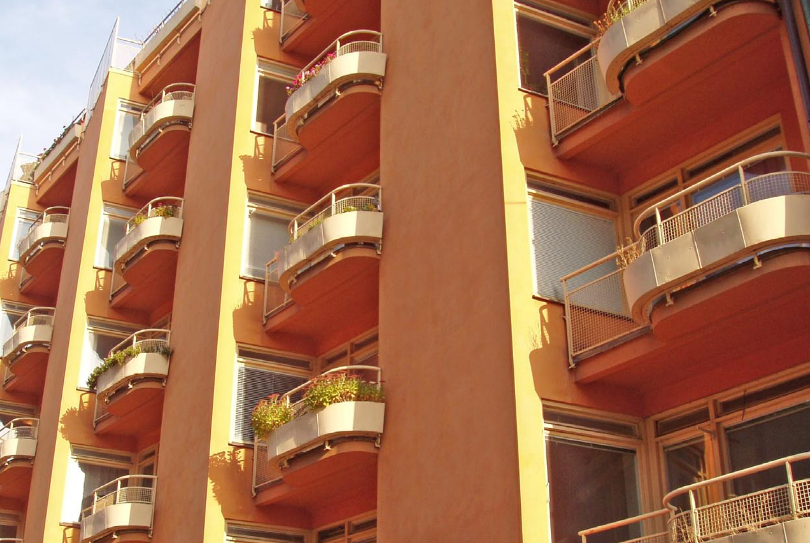
Markelius kollektivhus på Kungsholmen.