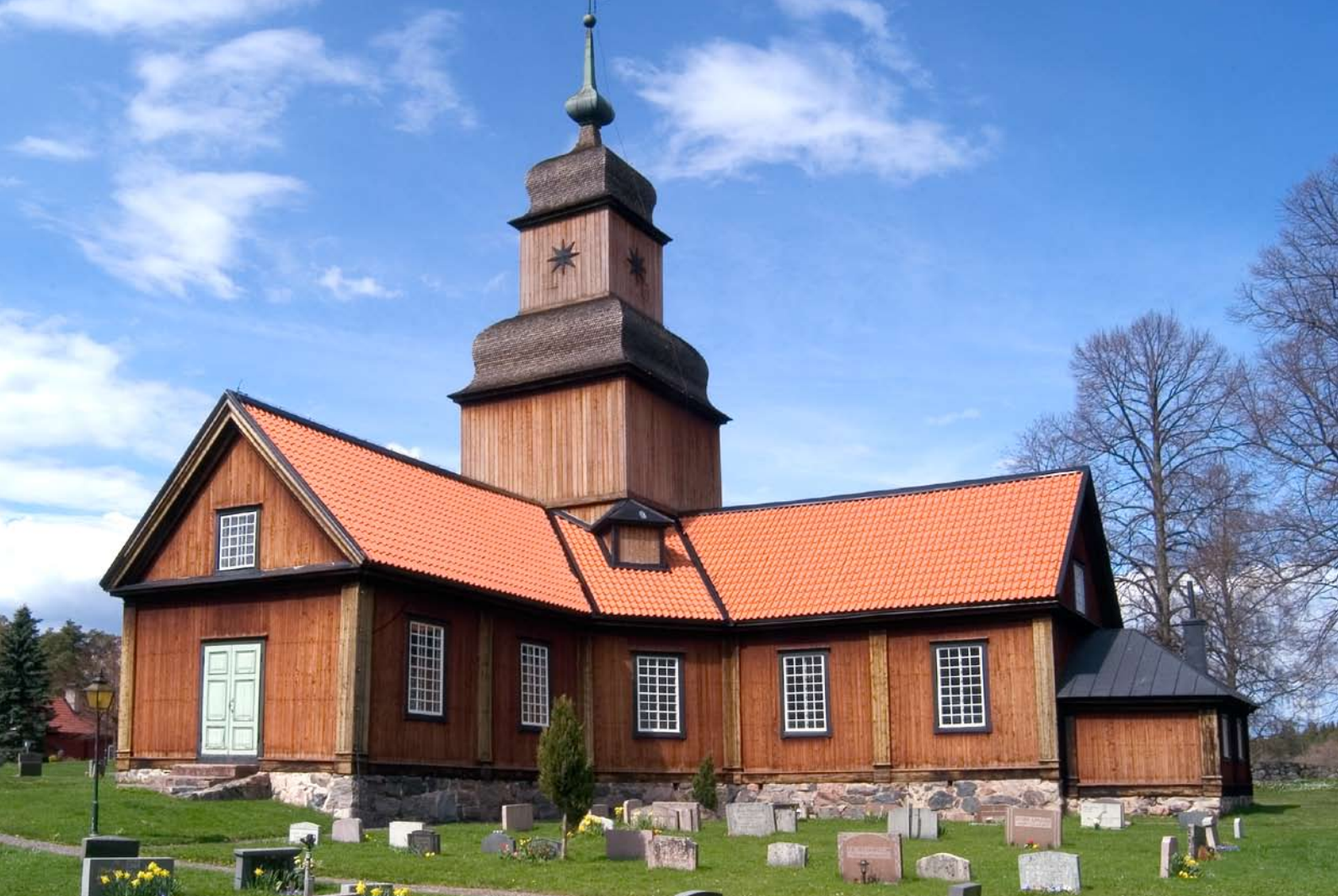
Roslags-Kulla kyrka, Österåker, är uppförd i början av 1700-talet som en gårdskyrka till Östanå gods.