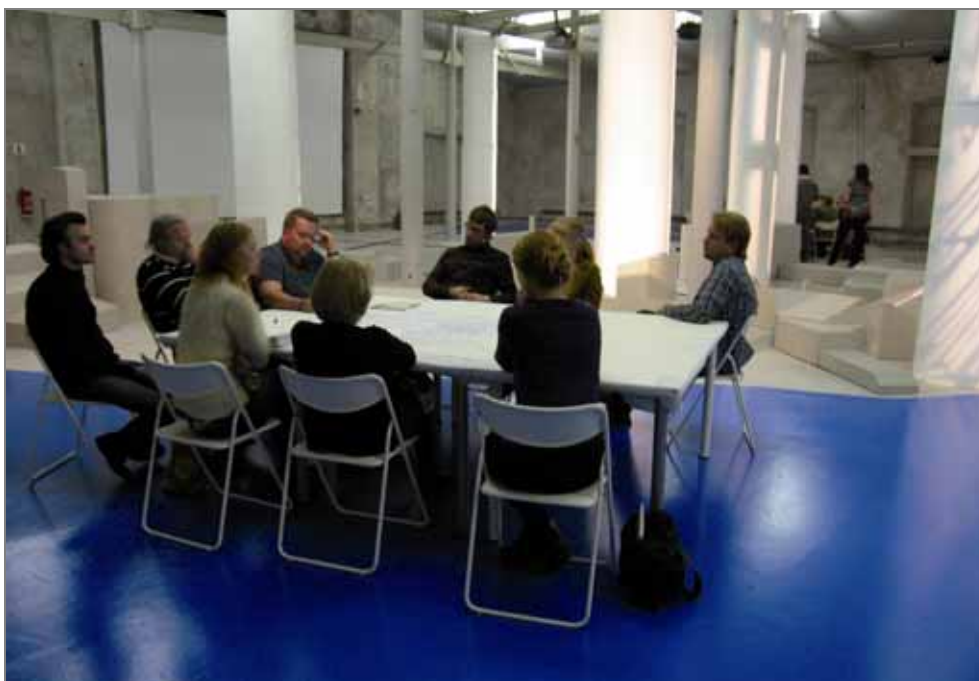
Grupparbete under seminarium i Färgfabriken oktober 2007.

Det har också varit viktigt att vidga perspektivet, som tidigare ofta handlat om trygghetsfrågor när jämställdhet och boendeplanering diskuterats till ett generellt resonemang kring vardagslivsfrågor.